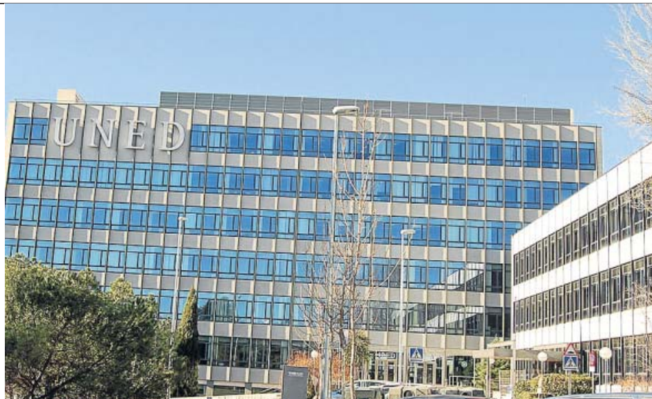
Escuela Técnica Superior de Ingeniería Informática de la UNED.

Universidad a Distancia de Madrid (UDIMA). Cuenta con 12 titulaciones de grado, 14 másteres y una treintena de títulos propios. Da la posibilidad