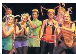
Jóvenes actores. NEBRIJA

El mundo de la interpretación y el espectáculo es generalmente uno de los que más llama la atención de los jóvenes. Aunque en ocasiones se le suele presentar como una actividad laboral en la que priman las aptitudes y el talento innato, la formación resulta primordial en este campo ya que el mercado cada vez demanda profesionales más completos. Por tanto, si tienes vocación artística y estás inte-