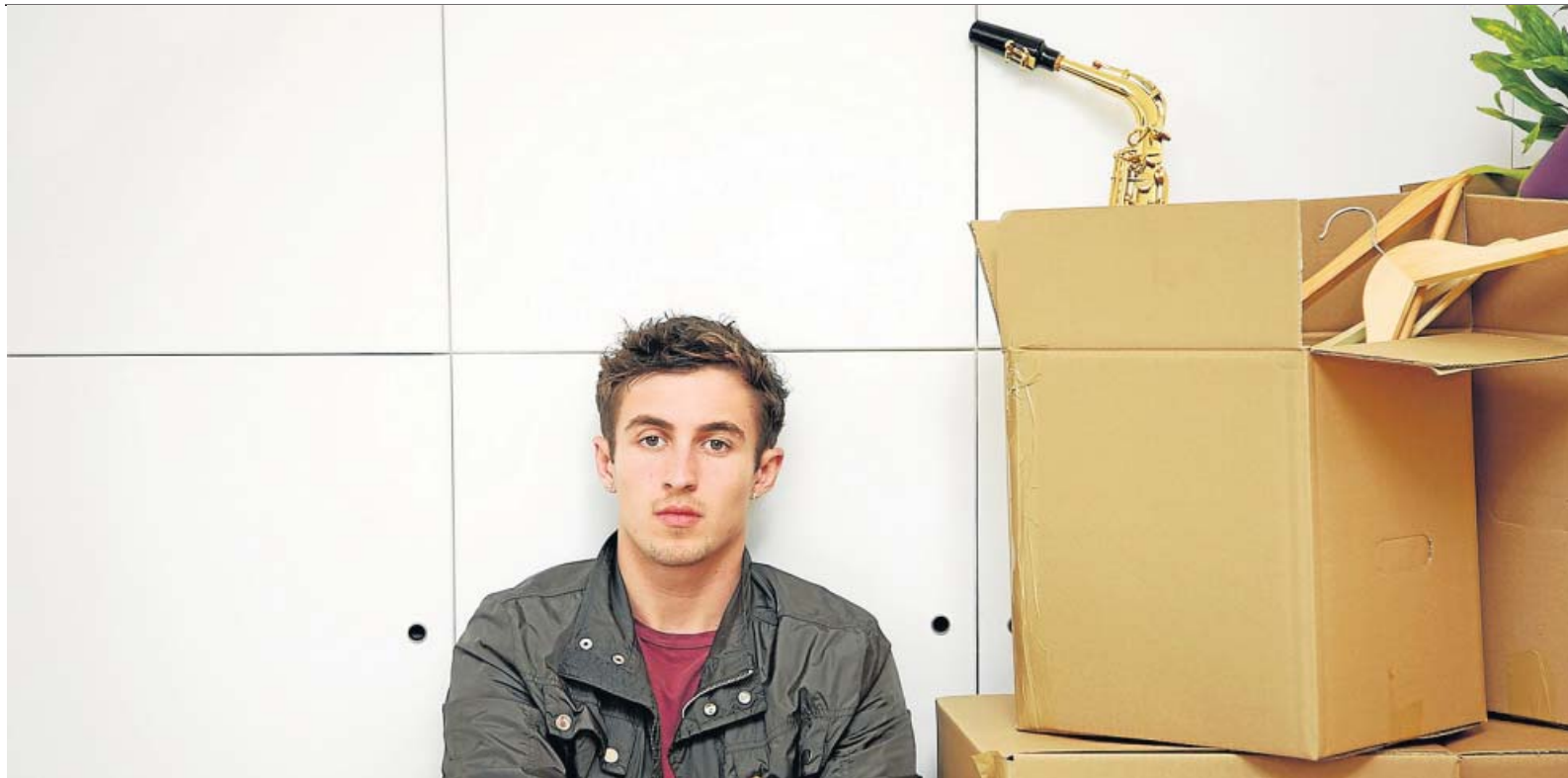
Cada año de formación de un universitario le cuesta 7.000 euros al Estado. Si al final de su carrera emigra, esa inversión se le regala a otro país.

TRABAJAR EN EL EXTRANJERO Cada vez más españoles optan por emigrar para asegurarse un futuro