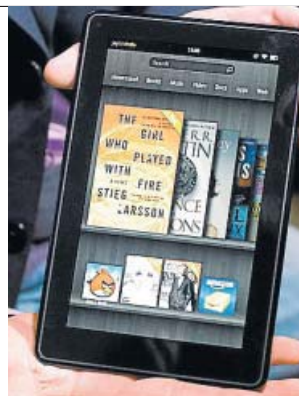
En U-tad programarán contenidos para tabletas.

El Centro Universitario de Tecnología y Arte Digitales (U-tad) se ha adaptado a las exigencias actuales y está diseñado con visión empresarial y de futuro. Algunos de sus grados son: