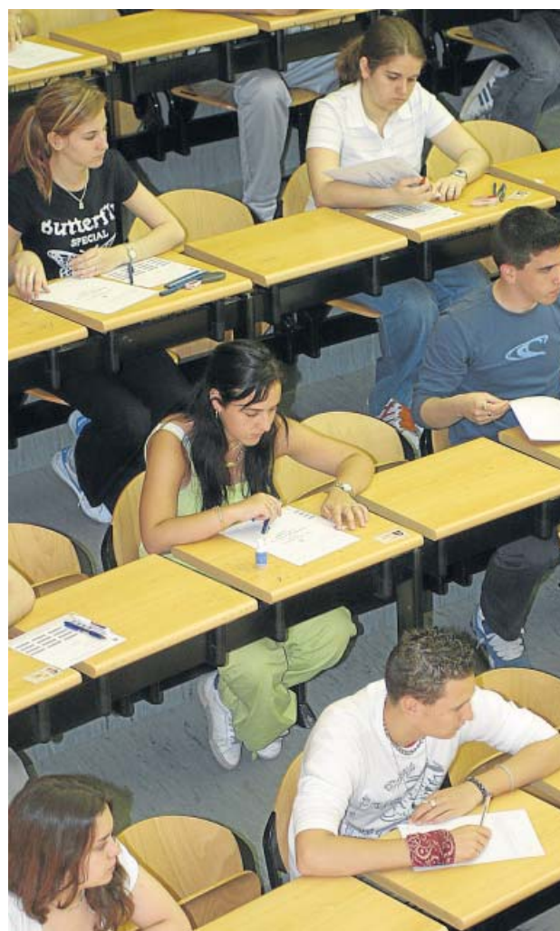
Las dobles titulaciones multiplican las posibilidades de encontrar trabajo.

Los datos del INE constatan, además, que la vía de la doble titulación es una alternativa por la que opta el 1,2% de los estudiantes universitarios. La mayoría de ellos tienen nombre de mujer (10.379, frente a 6.950 hombres).