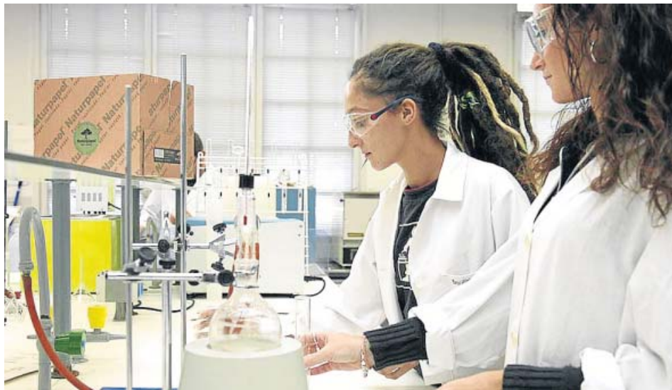
Alumnas de Formación Profesional de un curso de técnico de laboratorio.

Este hecho está provocando un aumento en el número de estudiantes en estas titulaciones. En 2011 había en España 610.860