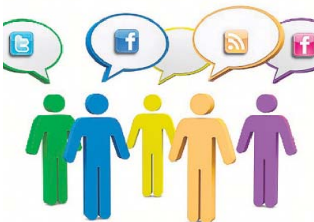
El marketing digital permite llegar a más gente en menos tiempo.

Sesiones, talleres o casos prácticos de la mano de reconocidos profesionales del sector son algunos de los pilares básicos del programa del máster.