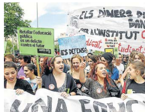
Manifestación en Barcelona por los recortes en educación.

La Conferencia Estatal de Defensores Universitarios ha manifestado su preocupación por las reformas del Gobierno que afectan al ámbito universitario. Sobre todo en lo relativo «al aumento de tasas, al régimen de dedicación del profesorado y al procedimiento de creación, modificación y supresión de centros y títulos de enseñanzas universitarias», según un comunicado. Si bien los defensores de los universitarios reconocen que las «emergencias que afectan a España, exigen urgentes reformas, ajustes y recortes», advierten de que «en modo alguno pueden justificar la quiebra de la autonomía universitaria o del autogobierno de las comunidades autónomas».