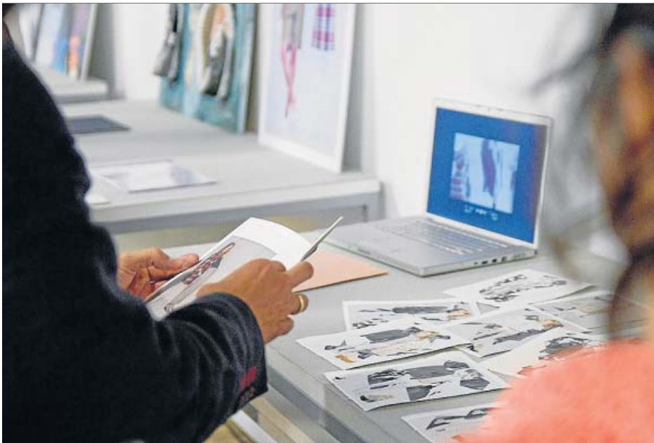
La moda es uno de los campos que más llama la atención de los jóvenes. IED