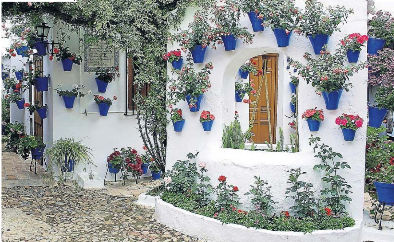
Las paredes encaladas, adornadas con múltiples macetas de flores, otorgan el atractivo visual a los patios cordobeses.