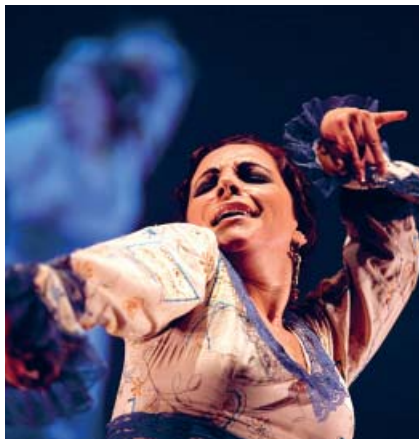
Eva Yerbabuena en la Noche Blanca de 2011.

Dentro de la programación de conciertos, destaca la actuación de Alejandro Sanz, que estará el día 5 en la plaza de toros de Los Califas, dentro de su gira La música no se toca . También participan en el festival: Desde KCórdoba (Teatro de la Axerquía, día 3); Eva Yerbabuena, con su espectáculo Federico según Lorca (T. Axerquía, día 6); Robert Cray y Los Coronas (T. Axerquía, día 11); Michael Schenker Group (T. Axerquía, día 12) y Fito y Los Fitipaldis (T. Axerquía, día 13).