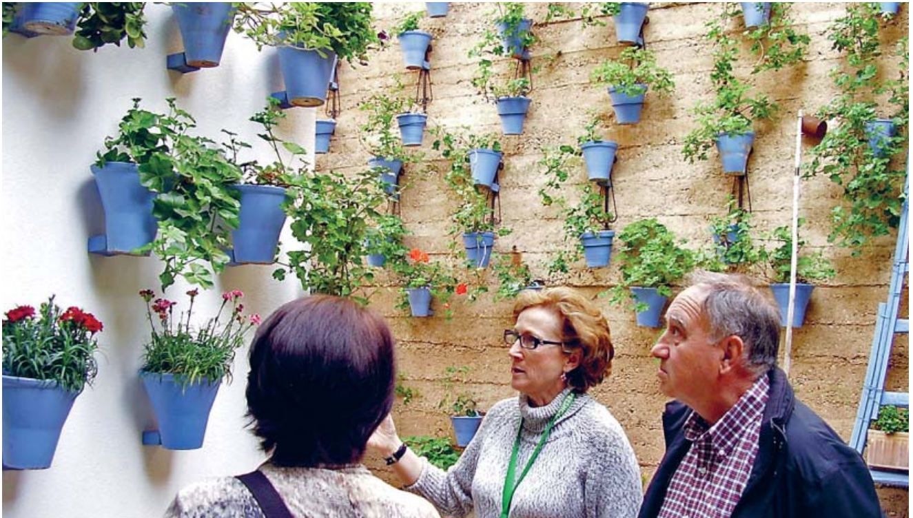
El patio de Martín de Roa, 2, puede visitarse también fuera del concurso de mayo.