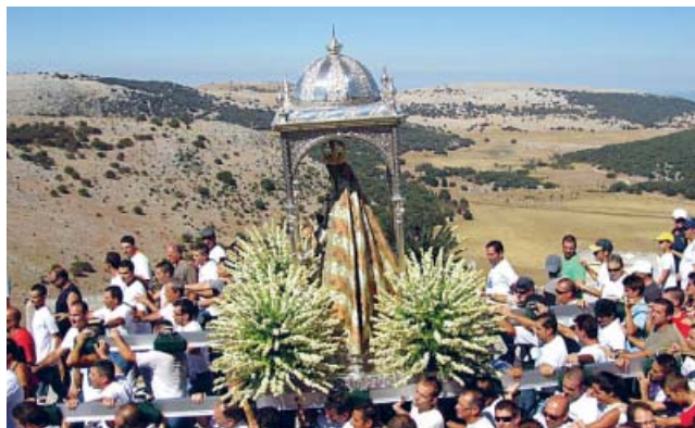
Los romeros egabrenses trasladan la imagen de la Virgen.