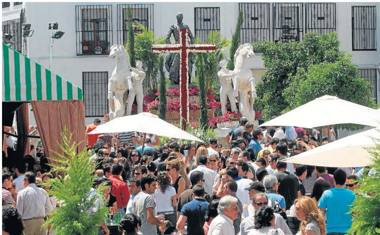
La cruz instalada en Santa Marina, junto a la estatua de Manolete, es una de las que más afluencia de público tiene todos los años.