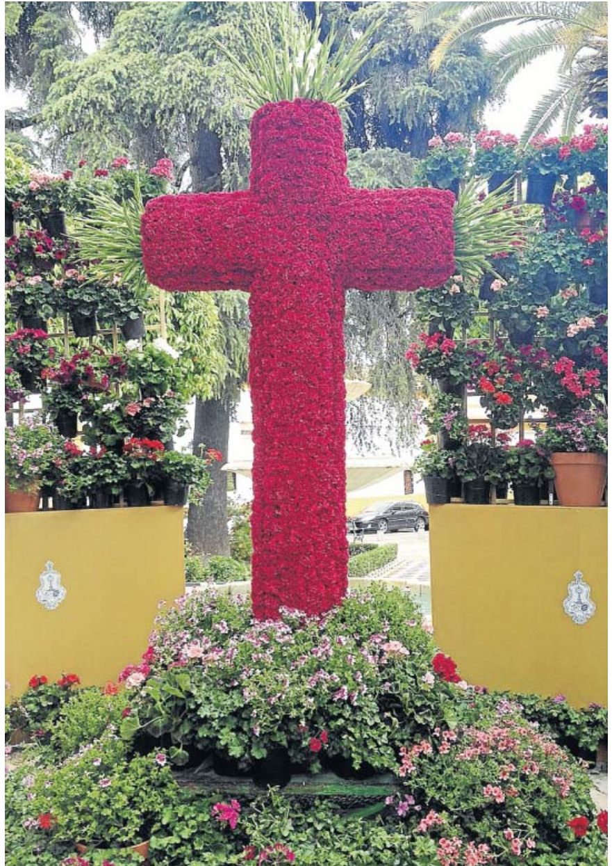
Cruz instalada por La Sangre el año pasado en la plaza del Cardenal Toledo.

No obstante, se reserva la posibilidad de que algunos de los premios queden desiertos ante la falta de calidad de las cruces presentadas al concurso. De este modo, la competición se convierte en un factor clave para intentar mejorar cada edición.