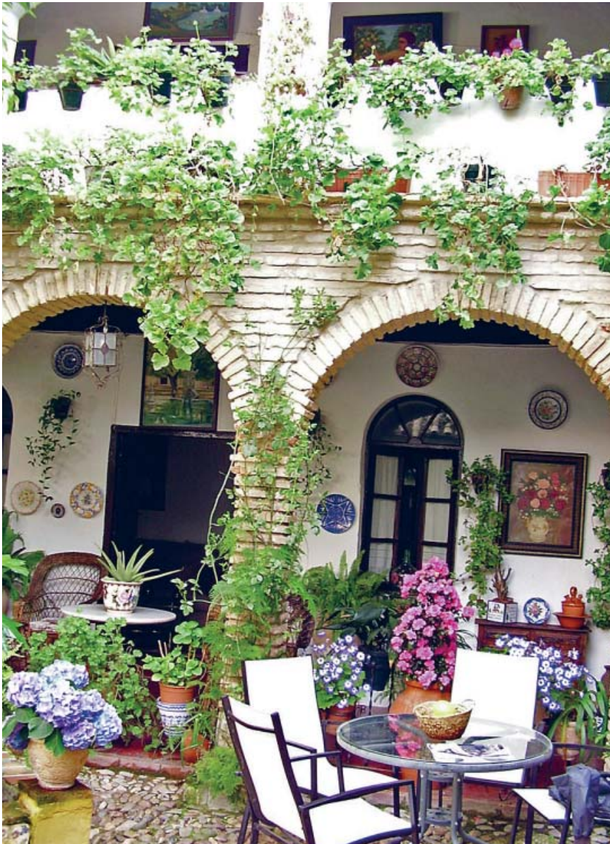
Patio de la casa donde nació el poeta Pablo García Baena, en la calle Parras, 6.