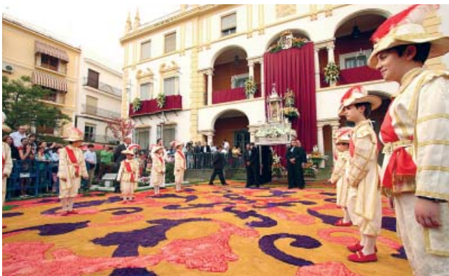
La procesión del Corpus recorre alfombras de serrín entintado.