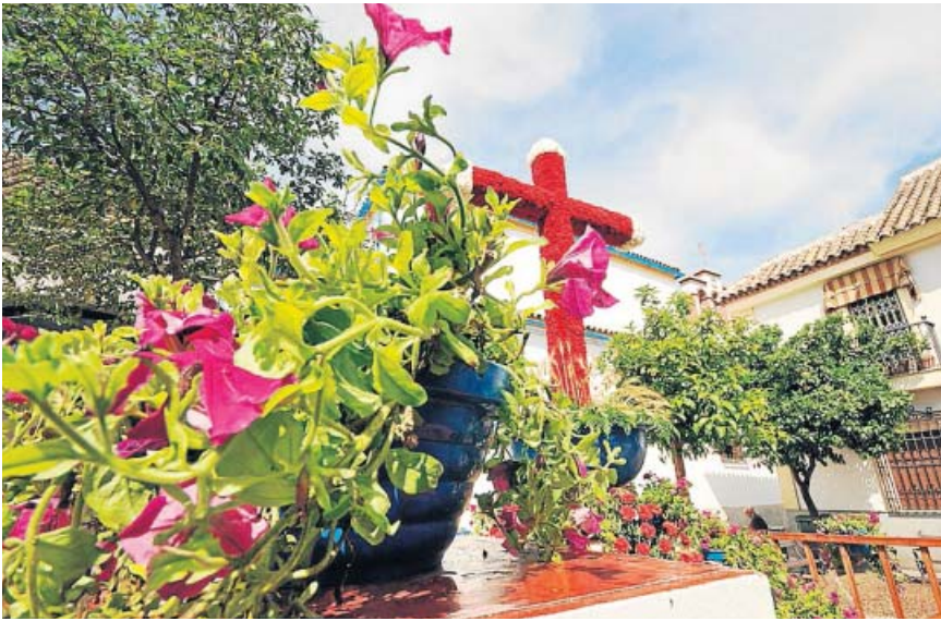
Gitanillas, geranios y claveles embellecen las cruces en multitud de rincones.