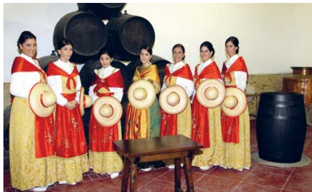
Décadas de historia y tradición en la Fiesta de la Vendimia.