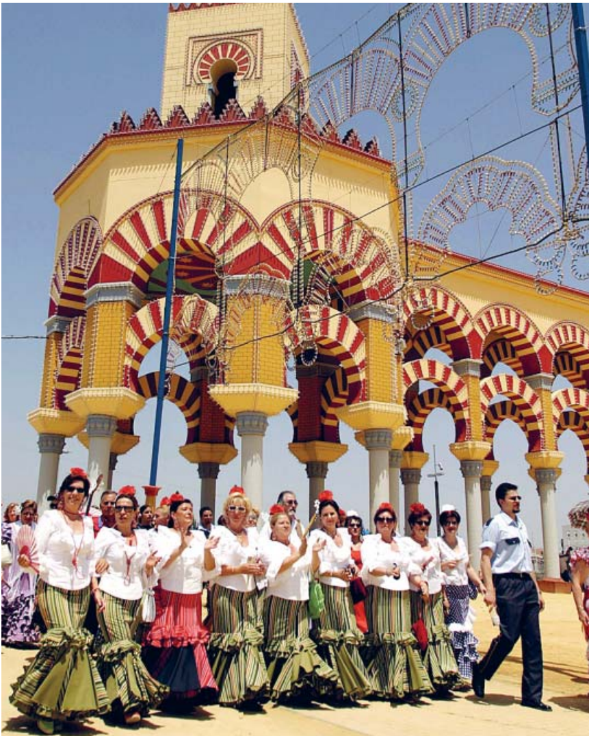
El ambiente festivo se respira nada más traspasar la portada de El Arenal.