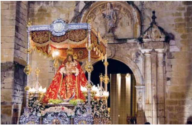
La Virgen de Araceli es la patrona de Lucena.