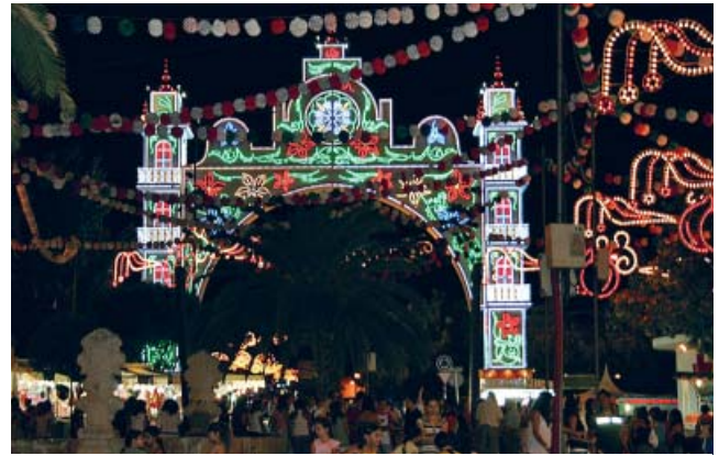
La portada de la feria con su iluminación nocturna.