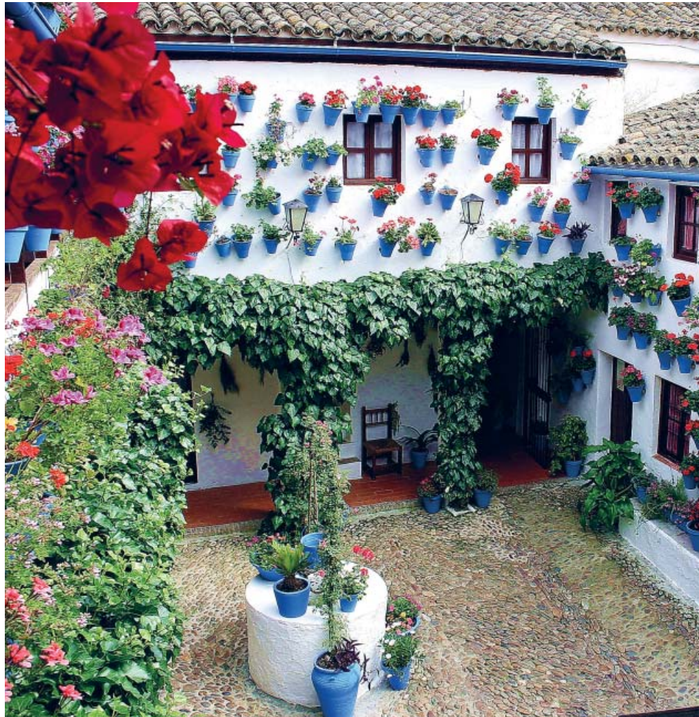
El impacto económico de esta tradición es fundamental para la ciudad.

Además, el 42% de los turistas eran cordobeses, mientras que el 58% restante, foráneos. De estos últimos, el 40% llegaron a Córdoba solo para ver los patios.