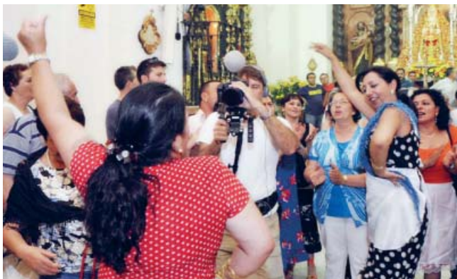
Cánticos como la alboreá dan color a esta fiesta.