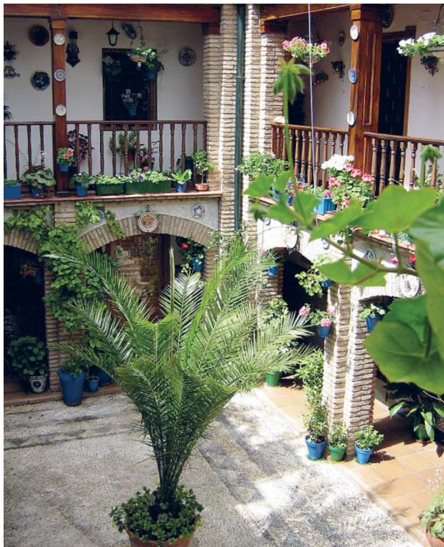
Patio cordobés situado en la calle Guzmanas, 4.

JARDÍN DE LOS POETAS. Situado junto a la muralla almohade de la ronda del Marrubial, por su lado interior, este jardín fue inaugurado el 18 de diciembre de 1992 en los terrenos de la antigua huerta de los Trinitarios. Sus estanques, naranjos, cipreses,