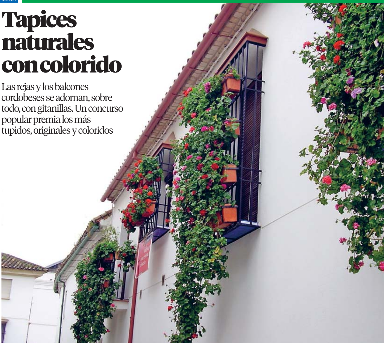
Balcones repletos de flores adornan decenas de casas, que muchas veces albergan un patio cordobés en su interior.

Las rejas y los balcones cordobeses se adornan, sobre todo, con gitanillas. Un concurso popular premia los más tupidos, originales y coloridos