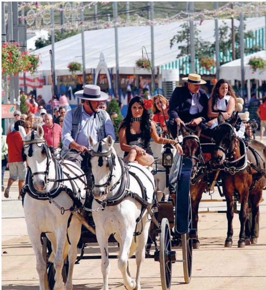
Carros de caballos, trajes de flamenco y un baile por sevillanas son estampas clásicas de feria.