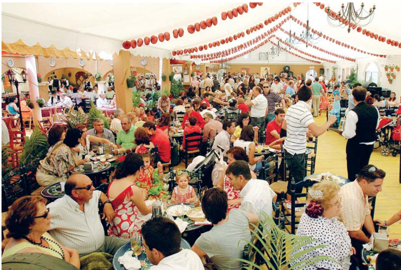
Muchas casetas de la feria conservan un carácter costumbrista muy marcado tanto de día como de noche.