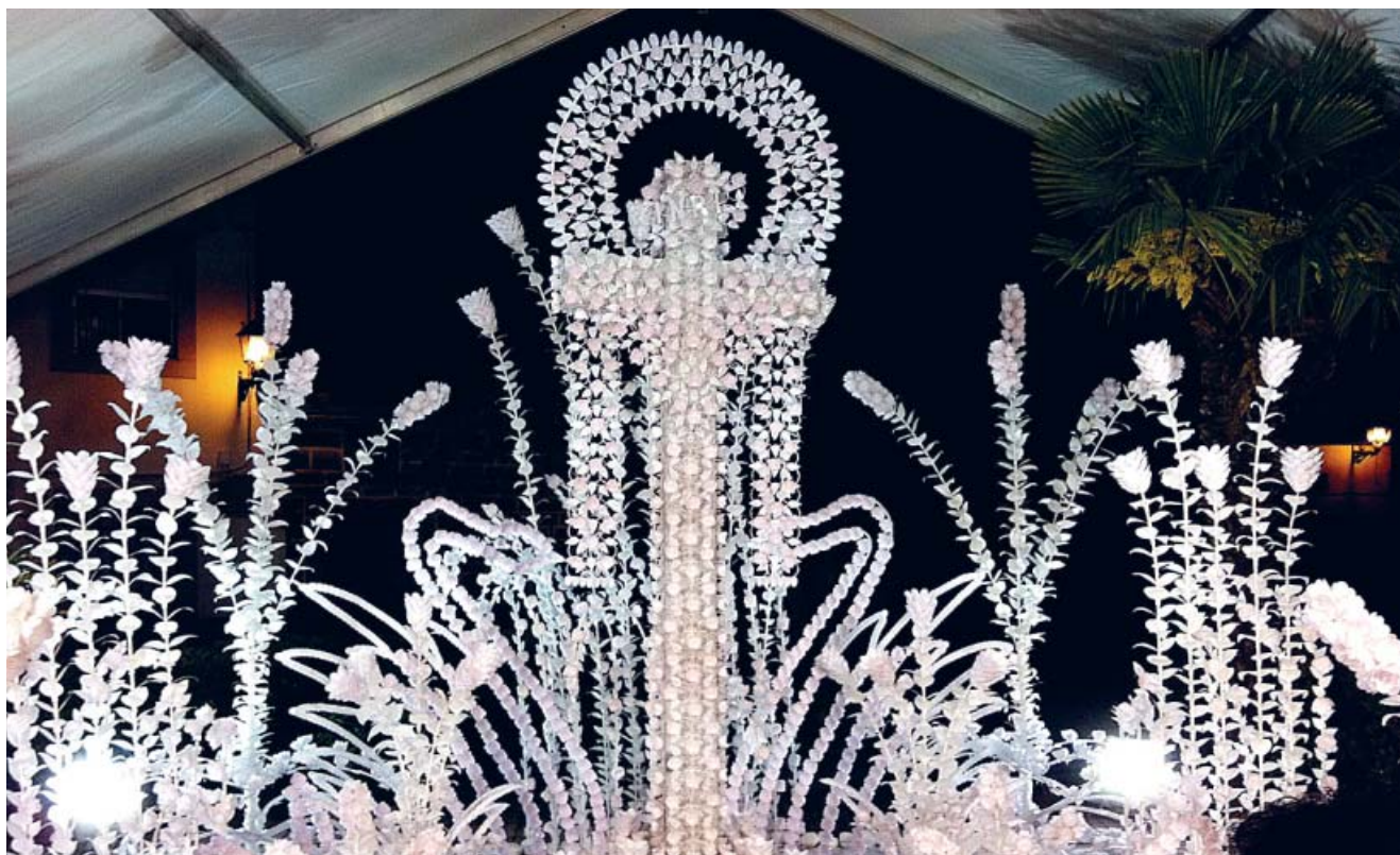
Las Cruces de Añora llaman la atención por sus laboriosos adornos en blanco, que conllevan muchos años de trabajo.