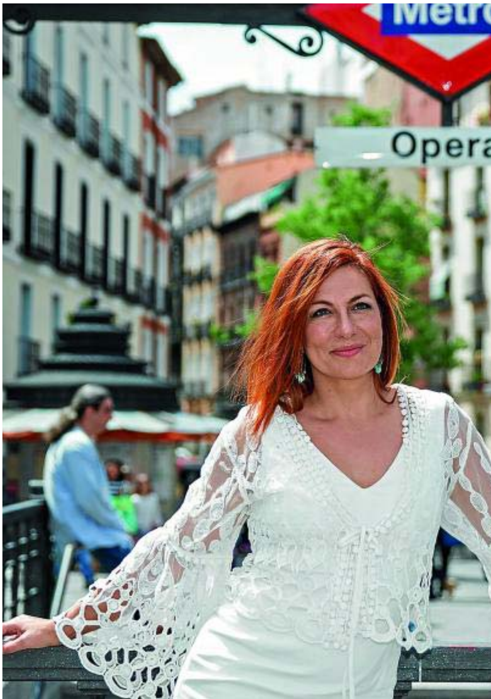
La cantante y compositora española asegura que «al salir del escenario es muy enriquecedor comunicarse con los demás,

A veces, en el sitio más insospechado, aparece alguien con un talento desbordante. Pero si ese talento va acompañado de técnica y trabajo duro, se convierte en algo mucho más sublime. Es una pena que haya gente que no tenga las herramientas para desarrollarlo. Como en todo, el saber no ocupa lugar, y hay que dedicarle tiempo a las cosas. Pero desgraciadamente