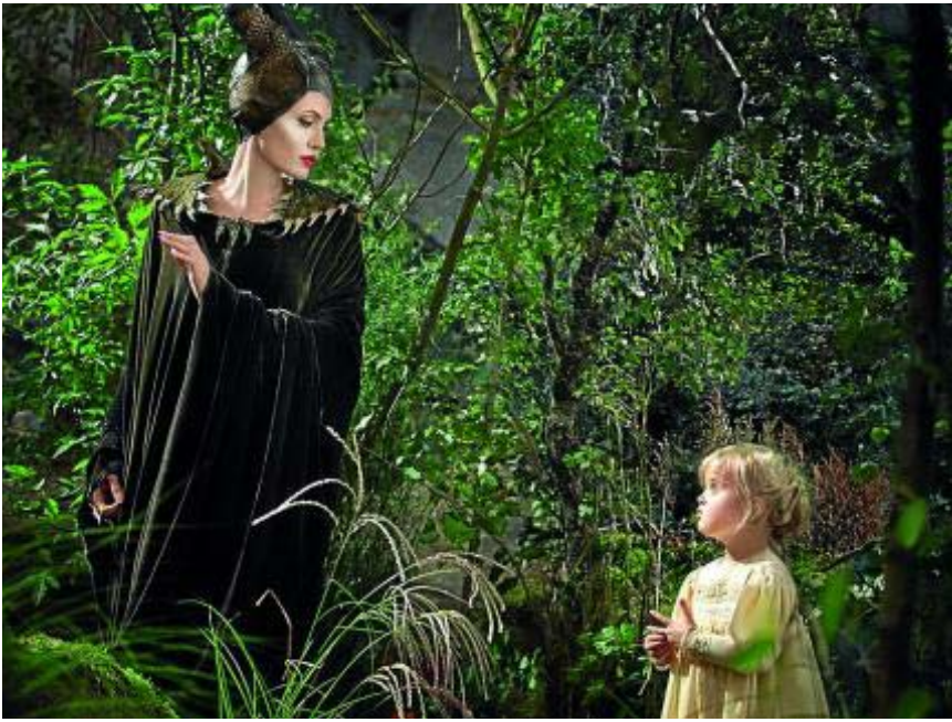
La villana de La Bella Durmiente , encarnada por Angelina Jolie en Maléfica , se deja llevar por la envidia.