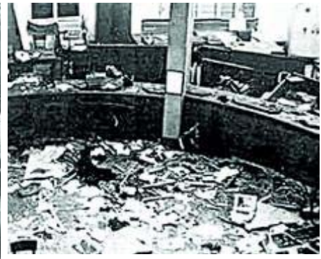
Cadáver de Aldo Moro hallado el 9 de mayo de 1978. Propugnaba un Gobierno de coalición con el PCI. Arriba, estado del banco en piazza Fontana tras la bomba. A la dcha., un símbolo de la Red Gladio (espada romana)