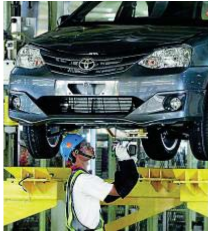
Sustituir robots por humanos, nueva política de Toyota.

Otra buena noticia para los trabajadores es el experimento que acaba de acometer el Ayuntamiento de Gotemburgo (Suecia): sus empleados trabajarán seis horas al día sin que les