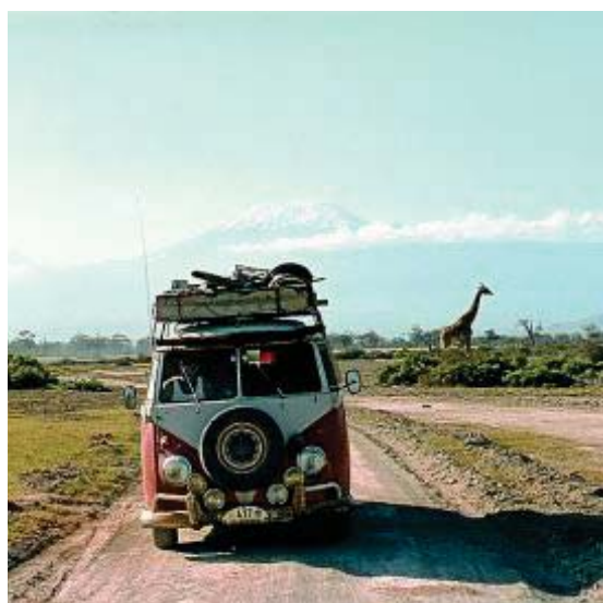
Las concentraciones populares reúnen a los aficionados en torno a esta mítica furgoneta. ww

Su diseño fue obra del empresario holandés Ben Pon, quien durante una visita en 1947 a la fábrica de VW en Wolfsburg para negociar la importación del escarabajo vio un tractor con base de carga y se le ocurrió que podría crearse un vehí-