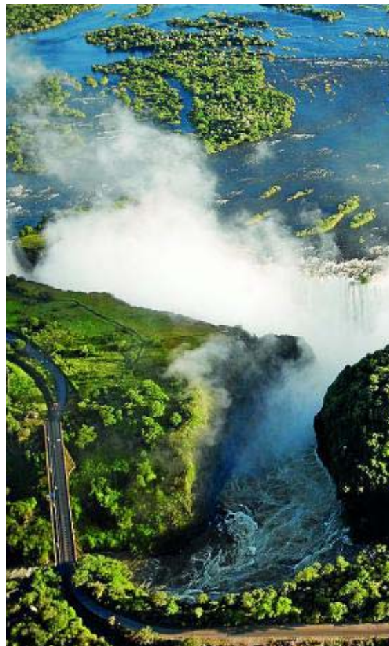
Las cataratas se desploman formando una densa nube de gotas de agua. A la derecha, puesta de sol sobre el río Zambeze y los jardines del Royal Livingstone Hotel, por donde cruzan las cebras. Bajo estas líneas, el tren de época Royal Livingstone Express.

Las carreteras, los vehículos, la gente descalza o los elefantes que vagan junto a las calzadas recuerdan al turista que se halla en el continente africano. La seguridad es un asunto importante, por lo que no viene mal asegurarse los traslados y el acceso a los recintos con una agencia local. Para pasar de Zambia a Zimbabue –o viceversa– y ver las cataratas desde ambas vertientes, habrá que pagar un visado de 50 dólares. Y además es necesario llevar la cartilla internacional de vacunación ( yellow card ), ya que la vacuna de la fiebre amarilla es obligatoria para transitar entre países como Zambia o Sudáfrica.