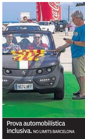
Prova automobilística inclusiva. NO LIMITS BARCELONA

Organitzen l'esdeveniment ECOM, moviment associatiu de persones amb discapacitat, i RallyClassics, amb el suport de l'Ajuntament i de l'Institut Barcelona Esports. En aquesta carrera no guanya qui va més de