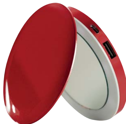
ESPEJITO, ESPEJITO... Se trata de una batería con espejo compacto. Podrá maquillarse en la oscuridad gracias a su luz LED a la vez que carga el dispositivo. Batería. 34,99 €. Tiendas Phone House y phonehouse.es