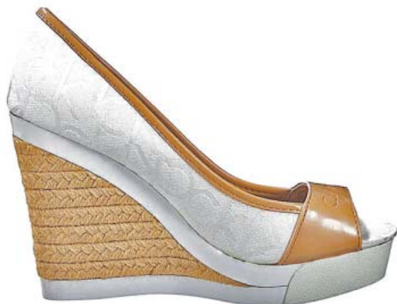
EL TERRITORIO DE LO CASUAL. Las cuñas de esparto son uno de los calzados más completos que hay porque las puedes combinar con vaqueros y faldas. Cuñas de Calvin Klein. 99,95 €. zalando.es