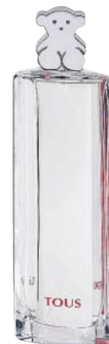
UNA LENTA OBSESIÓN. Jean Paul Sartre decía que «el perfume es la forma más intensa del recuerdo». Bien es cierto que los aromas recuerdan a personas, momentos de la vida, despiertan sentimientos... El cofre de TOUS contiene Eau de Toilette de 90 ml y una bolsa plegable. 72 €. elcorteingles.es