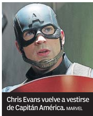
Chris Evans vuelve a vestirse de Capitán América.

derosos del planeta y les impone un registro. Steve Rogers, conocido como Capitán América, no está de acuerdo con esta medida, mientras que su compañero Tony Stark, alias Iron Man, decide