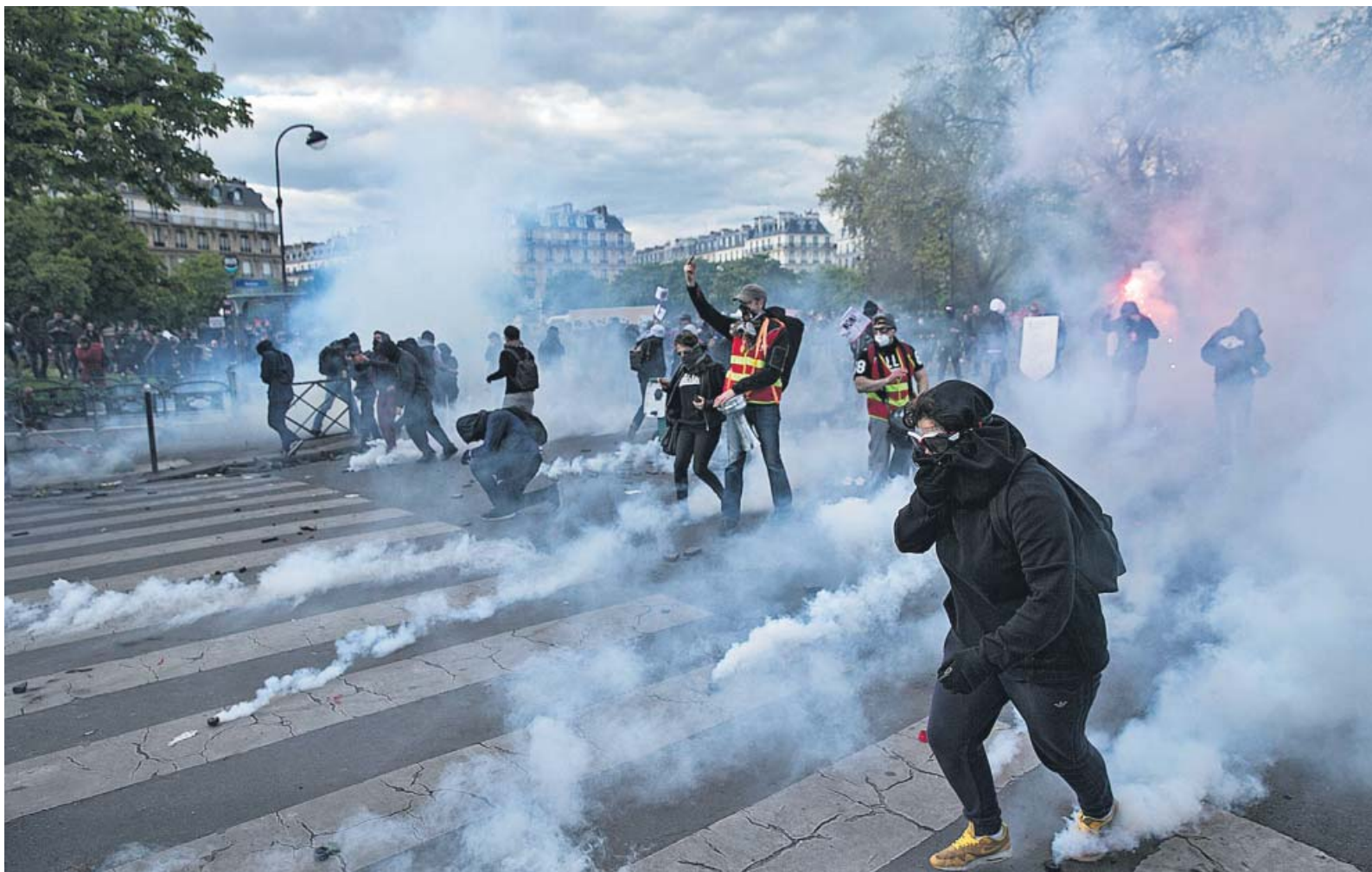
MÁS PROTESTAS EN FRANCIA DEJAN 124 DETENIDOS

Cientos de miles de trabajadores y estudiantes volvieron a protestar ayer en Francia contra la reforma laboral propuesta por el gobierno de François Hollande en el que fue el cuarto gran pulso lanzado en dos meses por los sindicatos, una jornada que se saldó con 24 agentes heridos, tres de ellos graves, y 124 detenciones en diferentes manifestaciones por todo el país.