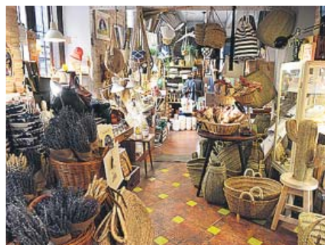
El centro B3B Woman (arriba) fusiona bike, boxeo y ballet para quemar, endurecer y estilizar la figura de las mujeres. Debajo a la izquierda, el atelier de Teresa Helbig y la tienda de decoración Simple en Valencia. A la derecha, el restaurante Torres y García de Sevilla. JAVIER FERRER VIDAL

OneOcean Club tendrá sesiones gratuitas de maquillaje, un animador infantil y talleres de pintura