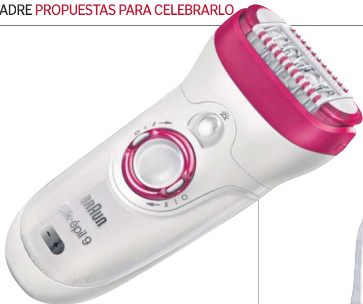
NI UN PELO DE TONTA. Gracias a que tiene un cabezal 40% más ancho, la depiladora de Braun cubre una superficie aún mayor y elimina el vello de una sola pasada. Braun Silk-épil9. 159 €. elcorteingles.es