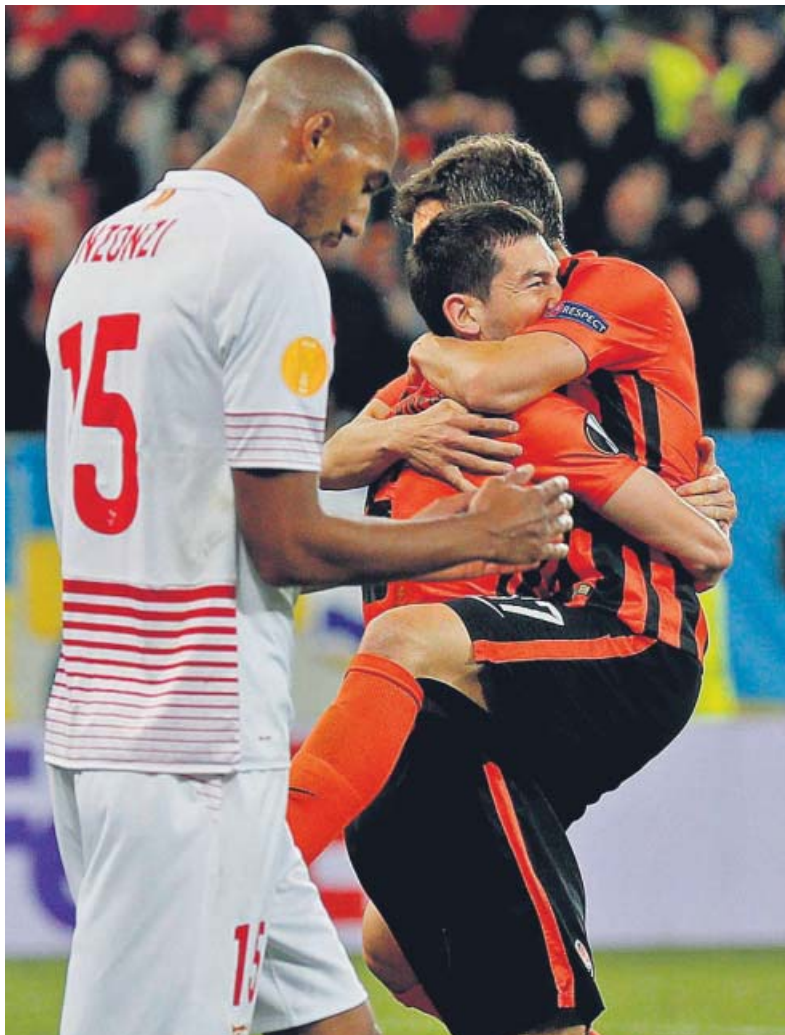
SEVILLA Y VILLARREAL SE ACERCAN A LA FINAL

Los dos equipos españoles sacaron valiosos resultados en la ida de las semifinales de la Liga Europa. El Sevilla se adelantó en Ucrania, pero el Shakhtar le dio la vuelta al marcador. Tras el descanso, los de Emery apretaron y sacaron un empate más que interesante (2-2). El Villarreal superó en El Madrigal al Liverpool (1-0) gracias a un tanto en el descuento de Adrián.