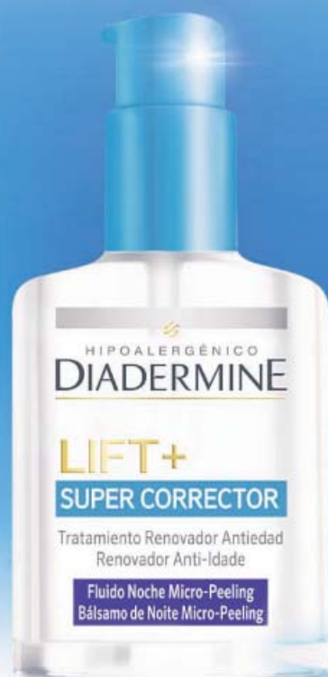
Fluido Noche Micro-Peeling