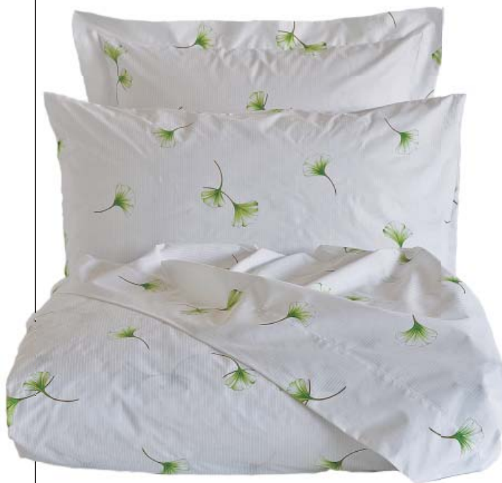
DETALLES 'HOME SWEET HOME'. Para las amantes de la decoración de interiores: una funda nórdica de algodón percal con cierre de botones ocultos. Funda de Zara Home. A partir de 65,99 €. zarahome.com