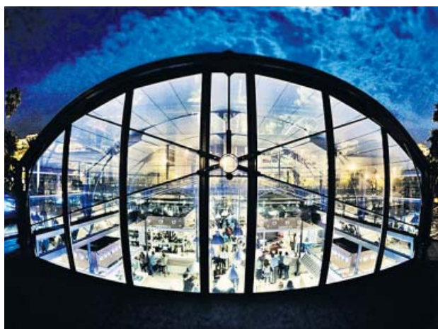
El hotel Marbella Club (arriba) ofrece por el Día de la Madre un plan de belleza y bienestar que incluye una sesión holística individual. Debajo a la izquierda, el Observatorio Astronómico de la casa rural El Valle, en Lecrín (Granada), lugar ideal para observar las estrellas, y a la derecha, una imagen del moderno Mercado Victoria de Córdoba, que cuenta con 24 puestos.