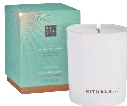
PRACTICA EL ARTE DEL BUEN KARMA. La edición especial de Rituals gira en torno al karma: buenas palabras, pensamientos y acciones. Recibes lo que das. Vela de Rituals. 18,50 €. rituals.com