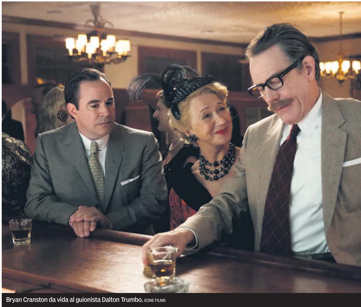
Bryan Cranston da vida al guionista Dalton Trumbo.

«Dalton Trumbo es un personaje muy complejo. Sumamente rico, viviendo el sueño de Hollywood... y comunista. Todos habíamos estado viendo a Bryan Cranston evolucionar