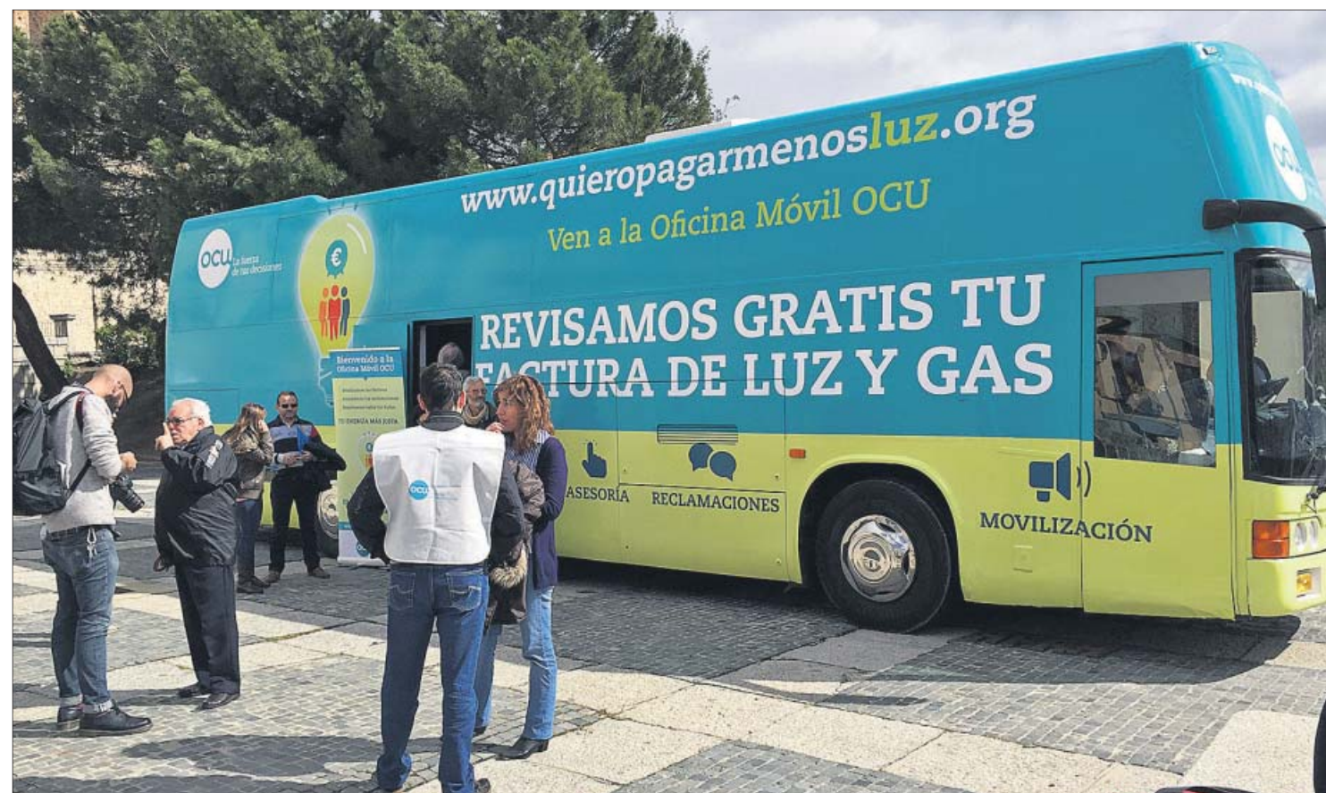
La Oficina Móvil OCU ofrece a los consumidores asesoría energética personalizada, además de la posibilidad de inscribirse en la III Compra Colectiva de Energía.

Hasta el 3 de mayo puedes inscribirte en www.quieropagarmenosluz.org , la III Compra Colectiva de Energía de OCU, y reducir tu factura a través de la oferta ganadora de la subasta y de muchas otras ventajas que te permiten ahorrar desde el primer momento.