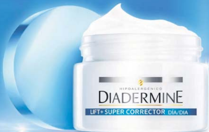
Crema de Día Anti-Edad Correctora 50ml