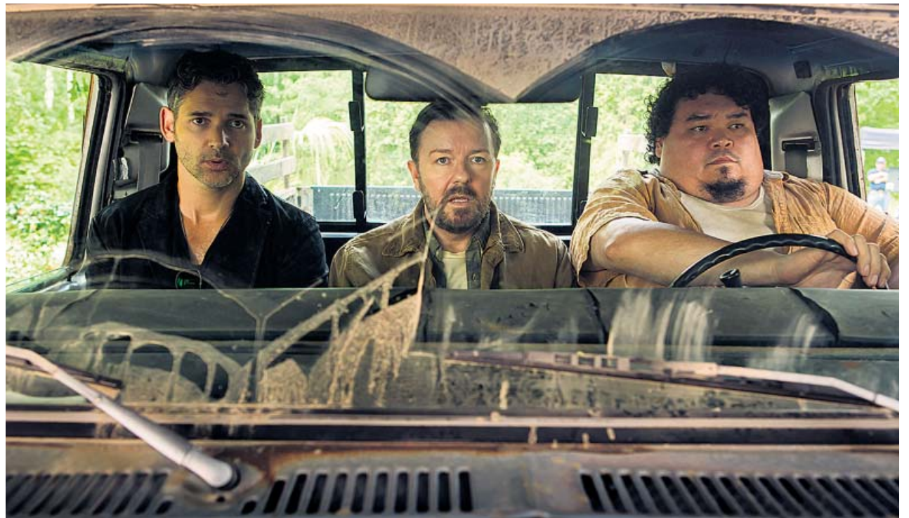
Los protagonistas de Special Correspondents son falsos reporteros de guerra.

Con esta premisa, una crítica directa a un oficio cada vez más cuestionado, afronta ahora «el proyecto más ambicioso» de su larga trayectoria profesional, tal y como aseguró hace unas semanas en un macroevento que celebró Netflix en París. ¿El resultado? Una hora y cuarenta minutos de sátira periodística orquestada