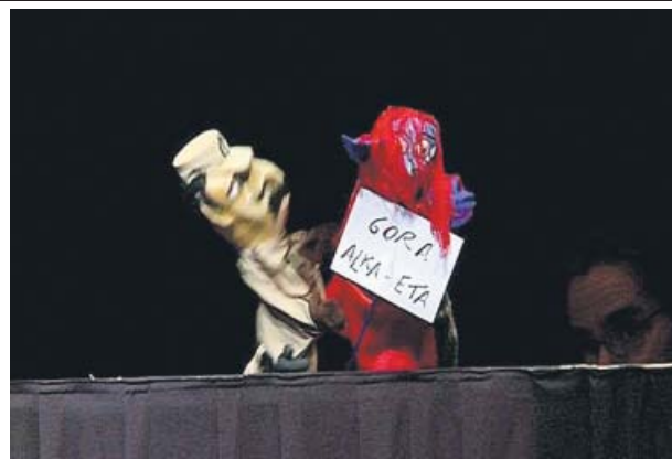
Un fragmento de la representación.

La adaptación a la gran pantalla del best-seller La chica del tren , protagonizada por Emily Blunt, se estrenará en España el 21 de octubre.