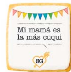
QUE DESPIERTE CON UNA GRAN SONRISA. Ella que madrugó contigo, divertidas galletas que llevan frases, cada vez que se coma una, sabrá