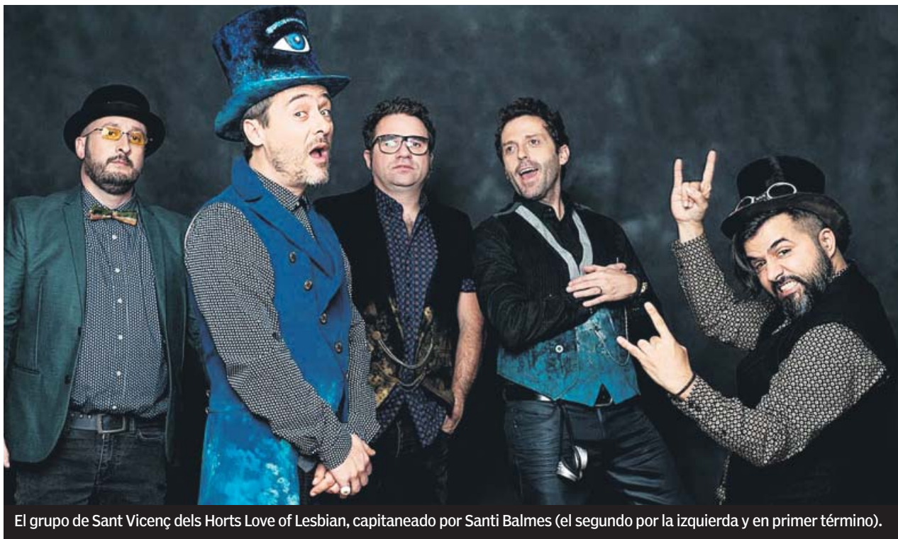
El grupo de Sant Vicenç dels Horts Love of Lesbian, capitaneado por Santi Balmes (el segundo por la izquierda y en primer término).