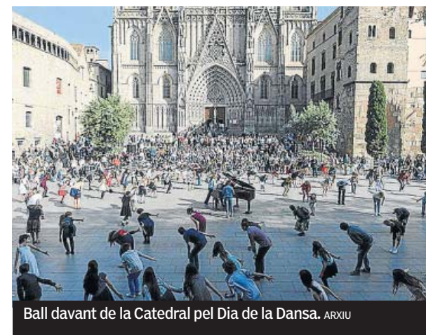
Ball davant de la Catedral pel Dia de la Dansa.

Fins demà dissabte, el Seminari Internacional de Convivència Planetària Construïm biocivilització reflexiona sobre economia, ètica i política, amb unes bases de cura i el respecte a la biodiversitat. Les trobades es porten a terme a l'Espai Francesca Bonnemaison i, dissabte, a la plaça Universitat. R. B. Més informació al web www.dansa-cat.org.