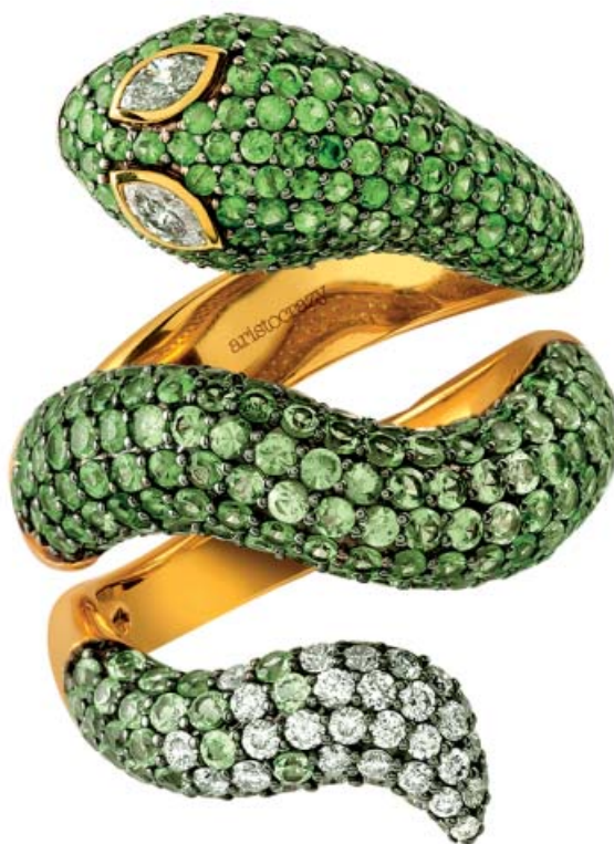
ESPÍRITU SALVAJE. La firma Aristocrazy celebra su quinto aniversario realizando una edición especial de su icónica sortija de serpiente que tu madre querrá tener. Anillo de Aristocrazy. Consultar precio. aristocrazy.com