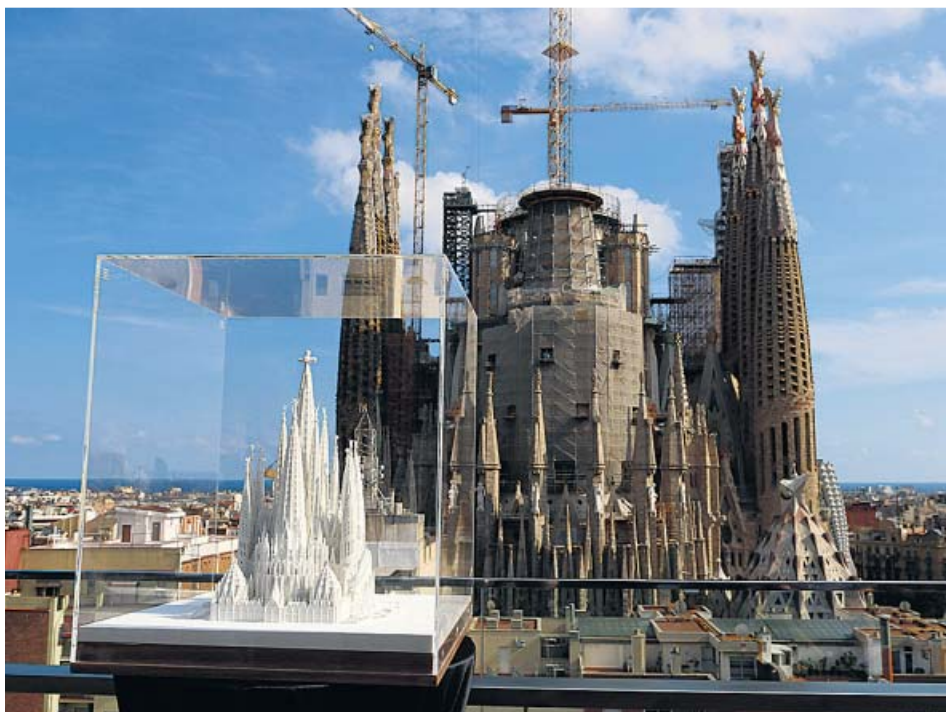
Una maqueta de la Sagrada Família con las torres acabadas y al fondo, el templo a día de hoy.

AHORA En la actualidad ya se han ejecutado el 70% de los trabajos del templo, que acabarán en 2026