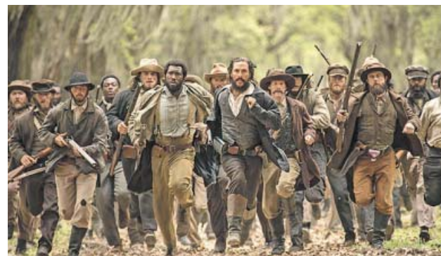
Fotograma de los Hombres libres de Jones . ARCHIVO

CINEMES TEXAS. C/ Bailén, 205. Tel. 93348748. Dead man (VOSC). 20:00, 22:15. Francofonia (VOSC). 16:00, 20:15. Kiki, el amor se hace. 22:20. La revolució cantada (VOSC).