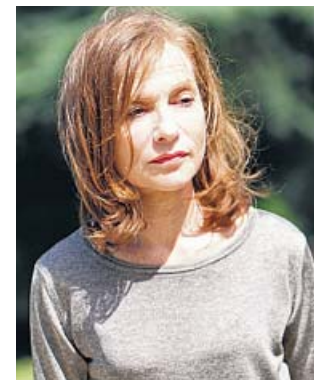
Isabelle Huppert convence en El porvenir . Golem