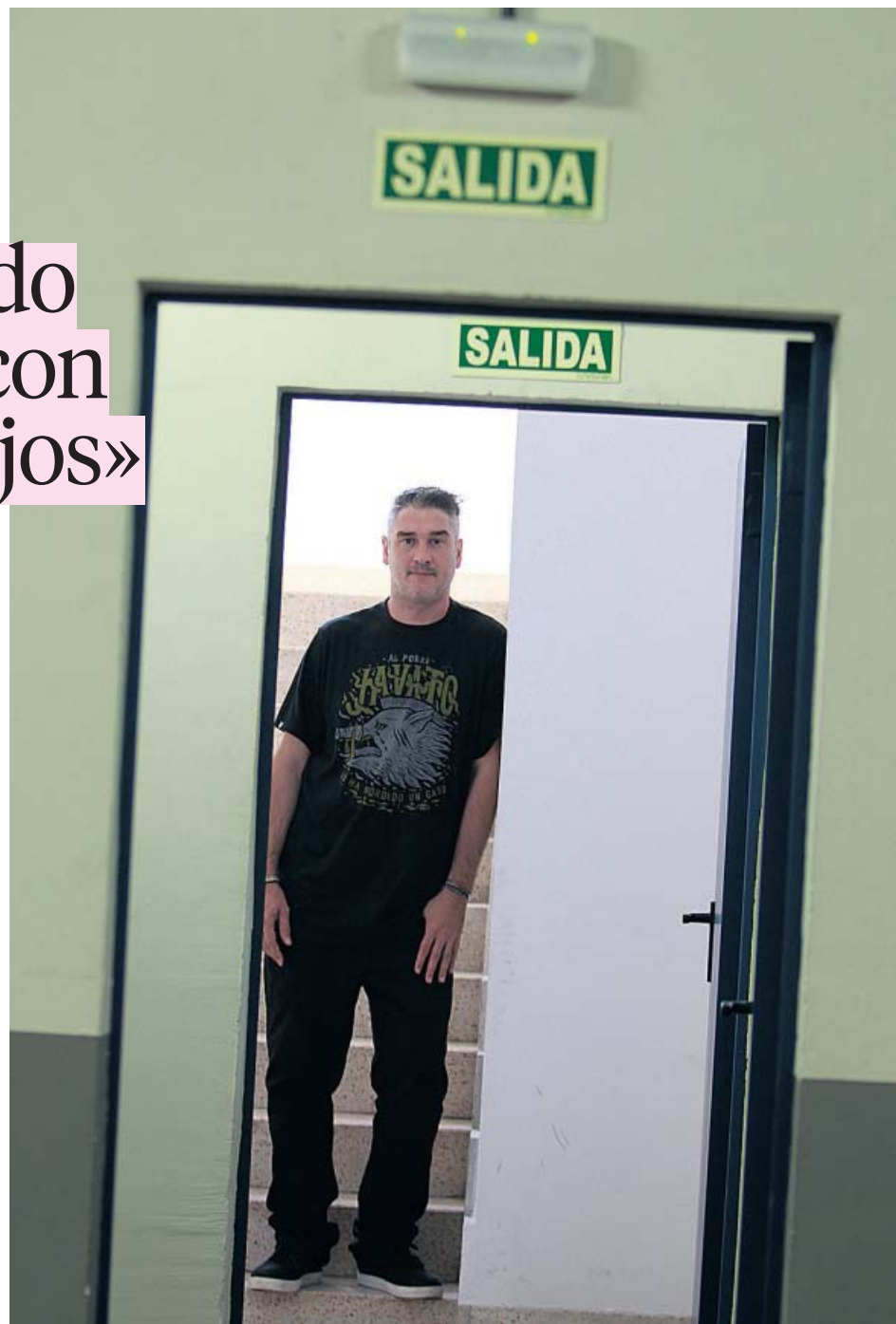
El rapero Kase.O vuelve después de cinco años con El Círculo , su nuevo disco. JORGE PARÍS

En Esto no para y Risoterapia habla de cómo está la po-