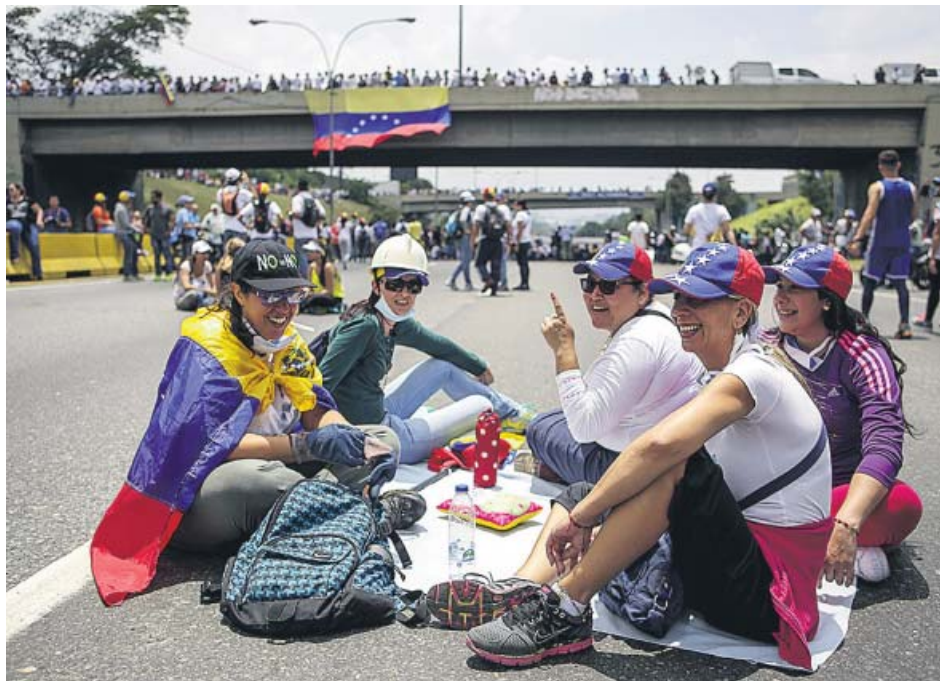
Un grupo de personas participan en una manifestación contra el Gobierno venezolano.

Los venezolanos vuelven a la calle. Ayer, centenares de personas se concentraron bajo el lema «Venezuela se planta contra la dictadura» y llamaron a manifestarse contra el Gobierno de Nicolás Maduro en al menos 15 ciudades. Las protestas «continuarán hasta que Maduro respete la Constitución y cese su autogolpe», indicó el excandidato presidencial y gobernador Henrique Capriles. Además, durante las últimas semanas, al menos 39 policías resultaron heridos en el estado de Táchira, informó ayer su gobernador. ● R.A.