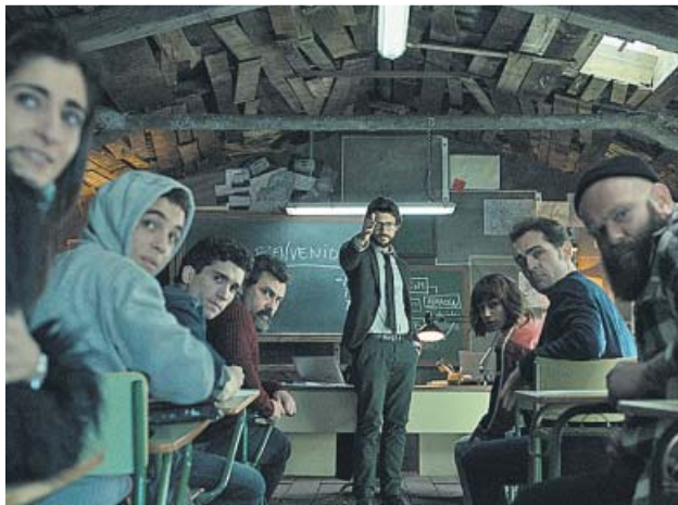
Los atracadores reciben instrucciones de su mentor.