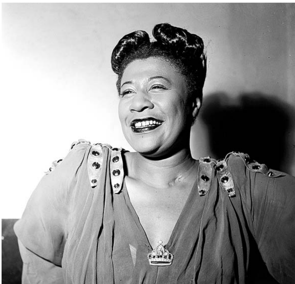
La cantante Ella Fitzgerald, en una imagen de archivo de 1946.