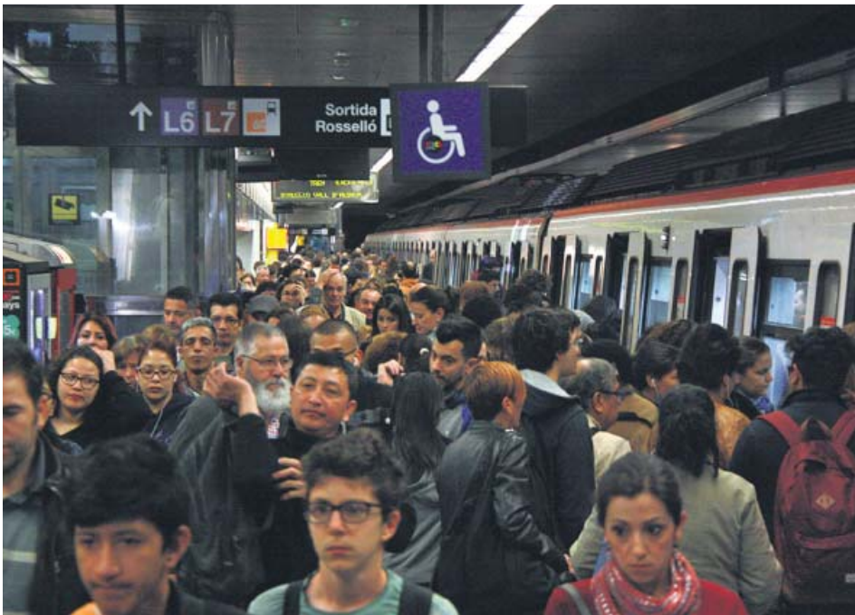
El andén de la estación de Diagonal, ayer, a las 7.30 horas.