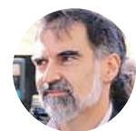
JORDI CUIXART President d'Òmnium Cultural

«No descartem convocar una nova aturada de país si no es respecta la voluntat del poble català manifestada el passat 1 d'octubre. És un instrument per pressionar els governs»