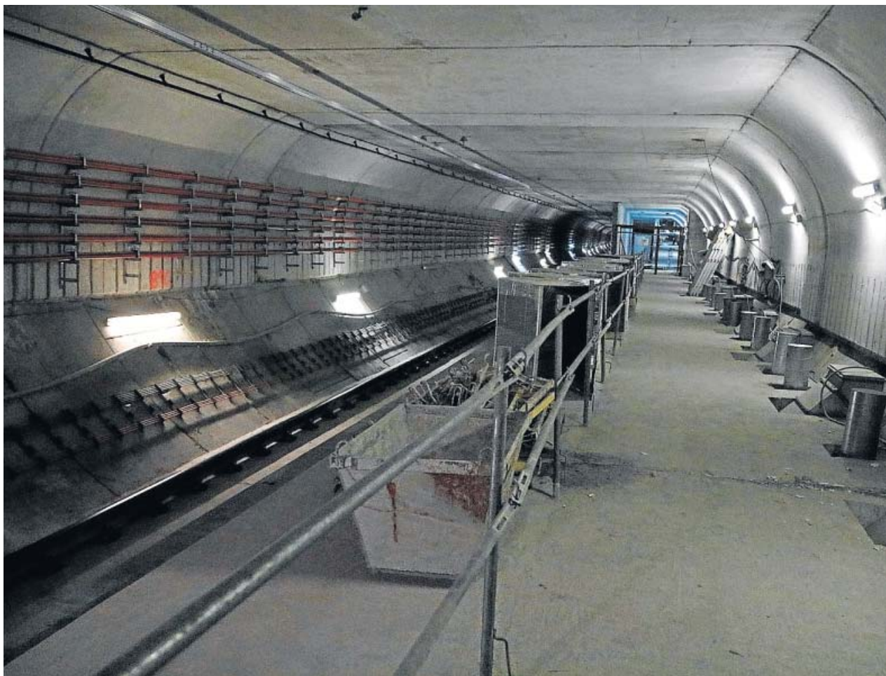
El futuro andén de la estación Foneria de la L10 del metro de Barcelona, en obras.