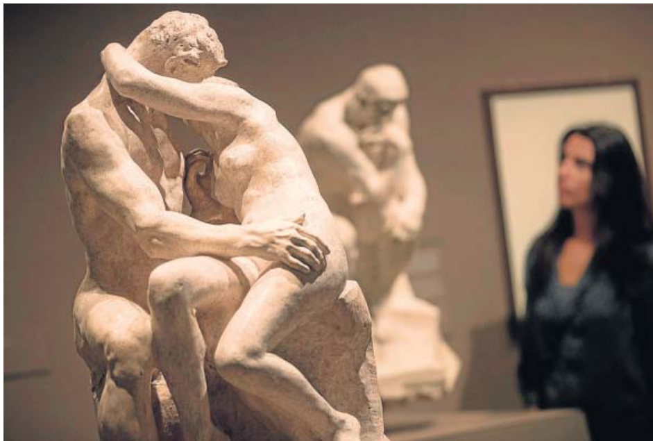
De dalt a baix, Ugolino i els seus fills (1881-82); Dones condemnades (1885); El petó (1881-82) i Ugolino i els seus fills, primer dia (1884). MUSEU RODIN