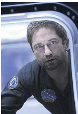
Gerard Butler es la esperanza ante la catástrofe.

Para contrarrestar una serie de desastres naturales que amenazaban el planeta, los líderes mundiales crearon una red de satélites que permitía dirigir el clima. Ahora, este sofisticado sistema se ha descontrolado y podría desatar una devastadora tormenta a escala global. Max y su hermano, con el que lleva años sin hablar, intentarán solucionar la crisis en el espacio. Mientras, en la Tierra se trama una conspiración para asesinar al presidente de EE UU. A pesar de su descabellado planteamiento, ha contado con la colaboración de la NASA para rodar en sus instalaciones. ●