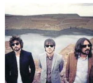
El trio granadí de pop independent.

La nova edició de tardor d'aquest esdeveniment solidari torna dissabte a una nova seu, la del Castell de Montjuïc. El vermut ret tributa a la ciutat i al seu esperit solidari després de l'atemptat del passat dia 17 d'agost a La Rambla. Castell de Montjuïc. Dissabte de 12 a 24 h. http://vermutsolidario.com .