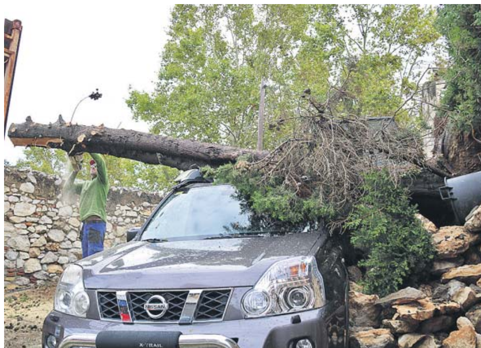
Un home talla un arbre caigut sobre un vehicle durant la tempesta a Valls.

El telèfon 112 va rebre ahir 732 trucades relacionades amb les fortes pluges caigudes a Catalunya, la majoria per inundacions de baixos i branques o arbres caiguts a la via. A la tarda, Protecció Civil mantenia l'alerta del Pla especial d'emergències per inundacions (Inuncat). A Valls (Tarragona) un total de 13 persones van patir ferides i cops pel temporal, dimecres. Una d'elles va haver de ser intervinguda per una ferida en l'avantbraç esquerre. ● R.B.