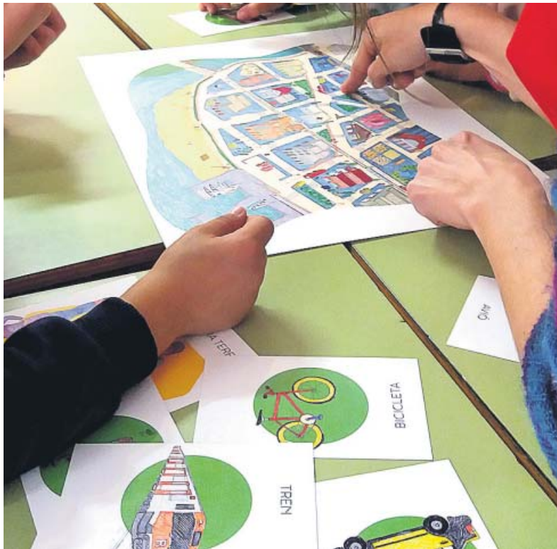
Activitats de les campanyes Abaixem els fums i En marxa per la salut ambiental, que busquen lluitar contra la contaminació. AMB

Vols sorprendre els teus fills amb una perspectiva diferent del #DeltadelLlobregat? Descobreix aquí els diferents miradors i aguaites que hi ha al territori: http://www.elprat.cat/.../que-vis.../els-espais-naturals-del-riu . Si pots aconseguir uns prismàtics, quedaran bocabadats. www.facebook.com/portadeldelta