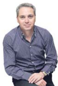
Vicente Vallés Periodista

Si el problema de Cataluña se hubiera producido en la Italia de los años 70, Giulio Andreotti habría encontrado la fórmula. Era un democristiano purasangre: maquiavélico, retorcido y cínico. Siendo la Transición española una labor de virtuosismo, el hábil político italiano dijo que, aun así, « manca finezza » (falta finura). Andreotti habría hecho un ejercicio churriguero con la carta de Puigdemont: concluir que no se ha instalado fuera de la ley al asegurar que el Parlament podría declarar «la independencia que no votó el día 10 de octubre». Agarrado ese párrafo por los pelos, paralizado el 155 y dando carrete a una estéril esperanza de negociación, Moncloa podría haber ganado tiempo y provocado la confusión general. Y no hay armamento más dañino que provocar su confusión. Pero ya no hay acuerdo que pueda satisfacer a todos. Solo cabe que uno gane y el otro pierda. No es lo óptimo, pero es lo que hay. Salvo sorpresa, que no es descartable. ●