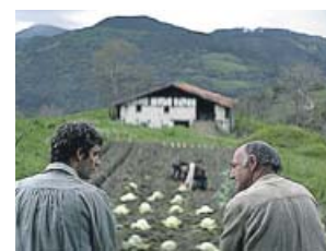
Mezcla de ficción y realidad en el País Vasco. A CONTRACORRIENTE

Después de luchar en la Primera Guerra Carlista, Martín vuelve a su caserío familiar en Gipuzkoa con la tremenda sor-