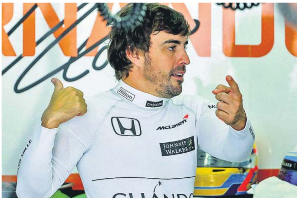
Fernando Alonso, piloto de la escudería McLaren.