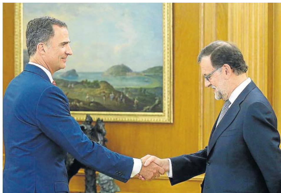
Felipe VI y Mariano Rajoy se estrechan la mano antes de su reunión.

SIN RESPALDO LEGAL La Constitución no prevé la renuncia tras aceptar el encargo del monarca