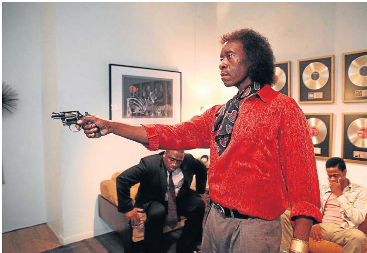
Don Cheadle, caracterizado como Miles Davis, en una escena del filme.