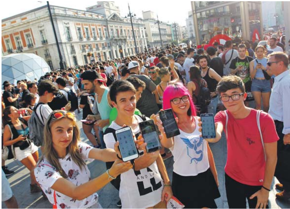
Cazadores de pokemons muestran sus capturas en la madrileña Puerta del Sol. JORGE PARIÉS

Más de 3.000 se dieron cita en la Puerta del Sol para establecer una marca mundial, superando la anterior gran concentración de jugadores, en Sídney