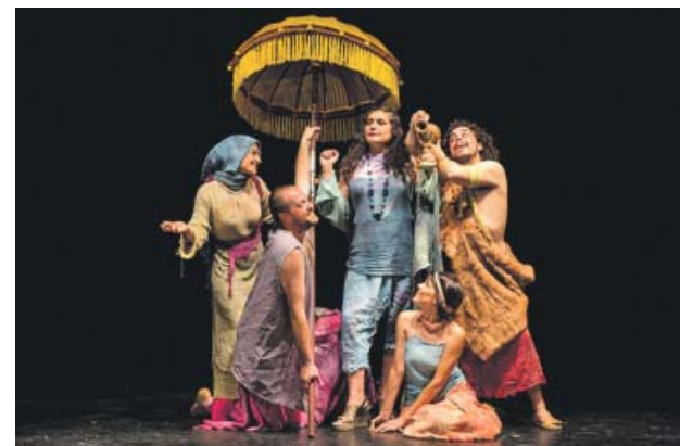
El Teatro de Itálica acoge la obra clásica 'El eunuco'.

Hotel Inglaterra. Plaza Nueva 7. Hoy, a las 21.00 horas. www.43livetherooft.com