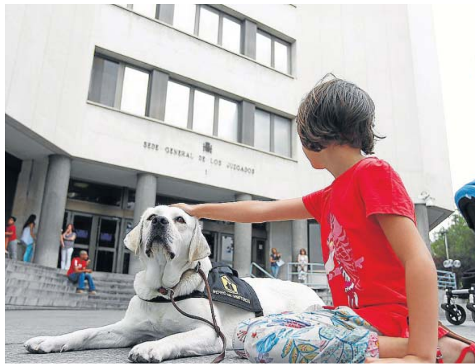
Fangoria es una labradora que ya está entrenando con Bocalán para dar asistencia judicial. JORGE PARÍS

donde el animal es una herramienta, es crear un ambiente más familiar y reducir la tensión. Para esto, el perro juega con los niños varias veces antes de que se les interrogue, y luego los acompaña para que puedan responder con mayor serenidad a las preguntas del juez. Una vez en la sala el perro no se mueve,