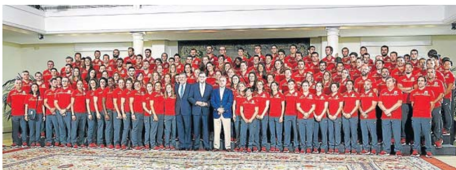
Mariano Rajoy recibió en la Moncloa a la delegación española, que parte hoy hacia Río.

Dónde verlo: GP de Alemania. Calificación, mañana 14.00 horas; y carrera, domingo 14.00 horas. MovistarTV