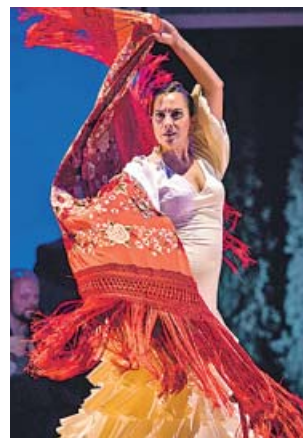
Un momento de la obra 'Tierra Lorca'. J. M. GRIMALDI

ca en un entorno incomparable en el que la figura del poeta se fusiona con el evocador poder del flamenco para dar como resultado una fórmula perfecta. La edición de este año está protagonizada por el Ballet Flamenco de Andalucía, que estrena sobre las tablas del Teatro del Generalife su nuevo espectáculo Tierra Lorca , cancionero popular . Bajo la dirección artística y la coreografía de Rafaela Carrasco, la obra rinde homenaje a todo el universo musical de Lorca, desde la cercanía