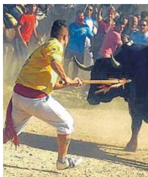
La tradicional matanza del Toro de la Vega.

La celebración no incluirá lidia ni muerte, según han pactado los grupos municipales en la Comisión de Toros. El astado pastará en el Prado de Zapardiel, junto al Duero, hasta las 23.00 horas del lunes, cuando correrá acompañado por caballistas hasta la plaza de toros. Al día siguiente, protagonizará un 'toro de cajón' y será desencerrado de vuelta en la dehesa. ● R. A.