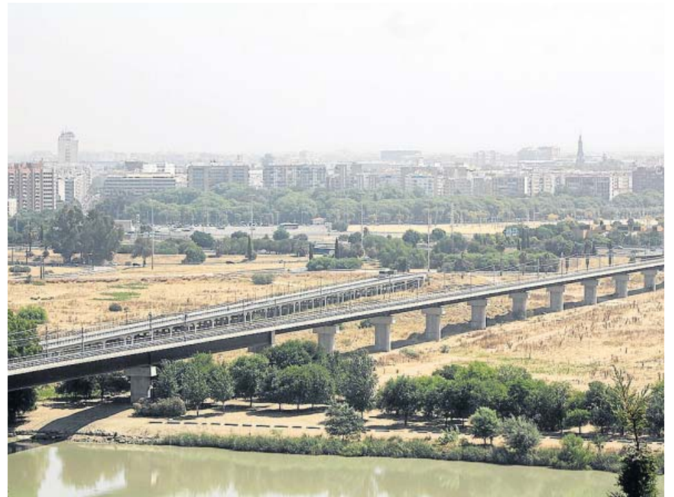
Vista del Puente de Hierro de San Juan de Aznalfarache.

Por su parte, el PP-A criticó que desde 2012 se hayan perdido más de 7.000 docentes en el sistema de educación público. ● R. A.