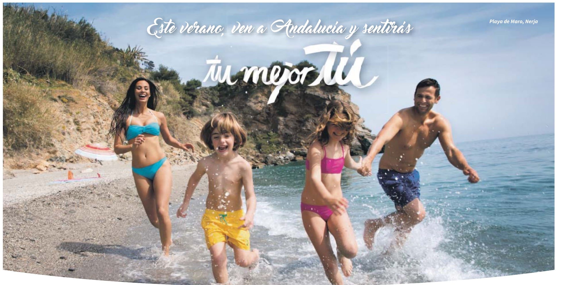
Playa de Maro, Nerja

La Comisión Europea (CE) defendió ayer su independencia a la hora de anular la multa a España y Portugal por haber incumplido los objetivos de reducción de déficit, después de las llamadas del ministro de Finanzas alemán, Wolfgang Schäuble, a algunos comisarios.