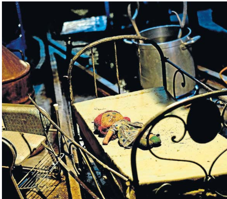
Una de las escenas más reconocidas y terroríficas de la película La mina .

KINÉPOLIS GRANADA. Circunvalación Salda Maracena-Pulianas. Tel. 958 18 90 00. Ahora me ves 2 (VOSE) - Digital. 19:45. Ahora me ves 2 - Digital. 17:30. V-S-D: 16:30, 19:00, 20:00, 21:45. V-S-D: 22:30. L-M-X-J: 19:45, 22:00, 00:15. S: 18:00, 20:10, 22:20, 00:30. L-M-X-J-D: 18:00, 20:15, 22:30. D: 12:00. S-D: 16:00. La leyenda de Tarzán. 18:00. V-S: 20:10, 22:20, 00:30. S-D: 16:00. S: 18:05. D: 18:10, 20:20, 22:30, 12:00. L-M-X-J: 20:05, 22:15. Malas madres. 17:30, 19:30, 21:30, 23:30. S-D: 16:10. L-M-X-J-S-D: 18:10, 20:10, 22:10. S: 00:10. D: 12:00. Un espía y medio. 23:00. S: 23:30. L-M-X-J-D: 22:00. Zippi y Zape y la isla del capitán. 16:00, 18:15, 20:15, 22:15. V: 18:00, 20:00, 22:00. L-M-X-J: 17:30, 19:30, 21:30