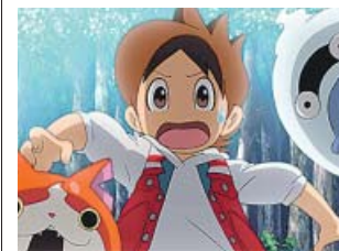
Nathan y los yokai Jibanyan y Whisper. SELECTA VISIÓN

cia y es un éxito de ventas de juguetes, videojuegos y todo tipo de merchandising . Ahora llega a la pantalla grande con este largometraje de animación que sigue con humor las aventuras del joven Nathan, un niño capaz de ver a los yokai , en-