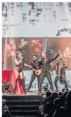
Una de las actuaciones de 'Music has no limits'.

Tras haber agotado entradas en espacios tan emblemáticos como el Lincoln Center