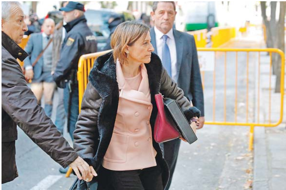
La presidenta del Parlament, Carme Forcadell, a su llegada ayer al Tribunal Supremo.

LA MESA, EN LIBERTAD La Fiscalía pedía prisión para cinco de los seis comparecientes