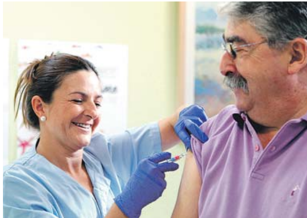
Una enfermera vacuna a un paciente.

Cada año se registran en España entre 200 y 300 muertes por gripe. El 64% de los fallecidos la temporada 2015-2016 no se habían vacunado