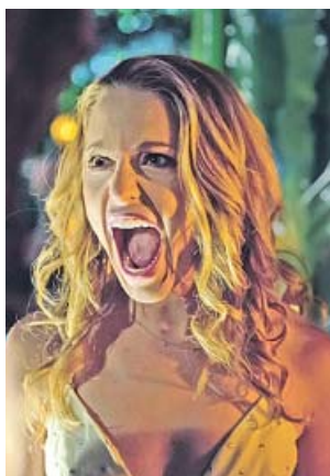
Tree intenta escapar de un bucle de muerte.

Tree es una frívola estudiante universitaria que el día de su cumpleaños se despierta en la cama de Carter, su ligue de la noche anterior, en lo que será el principio de una jornada de situaciones extrañas con las que vivirá un constante déjà vu . Al caer la noche, Tree es asesinada por un misterioso enmascarado, para volver a levantarse en la habitación de Carter, el único que la ayudará a salir de ese bucle: hasta que no descubra quién es el asesino, terminará siempre muriendo. Una combinación llena de humor negro de los slasher tipo Scream y la película Atrapado en el