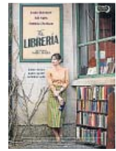
2017. Directora: Isabel Coixet Reparto: Emily Mortimer, Patricia Clarkson, Bill Nighy

Pero esta guerra no es sucia. Aquí no hay violencia ni palabras malsonantes. La batalla se desarrolla con el más estricto y protocolario saber estar británico, en un decorado lleno de telas por el que amabilísimas palabras vuelan como dardos envenenados. El reino por conquistar es un viejo local y los ejércitos, claramente descompensados, son casi invisibles.