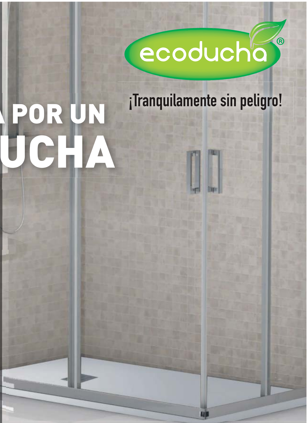
PLATO DE DUCHA DE CARGA MINERAL DE 2,8 CM "CERTIFICADO C3" COLOR EN MASA, DISPONIBLE EN 7 COLORES.

¡TODO INSTALADO POR 999 €! Y POR 15 € MÁS (70 €/MES), TAMBIÉN LE AÑADIMOS ESTE ESTUPENDO DUCHÓN TERMOSTÁTICO