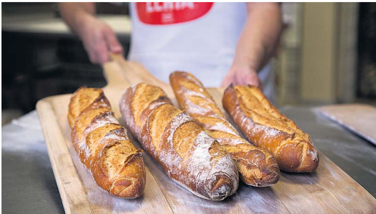
Una pala de barras de pan artesano recién salida del horno. MASA LENTA