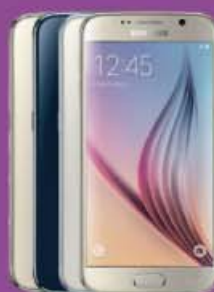
SAMSUNG GALAXY S6 32GB 469€ 550€