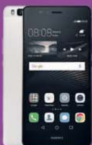
HUAWEI P9 LITE 299€ 320€