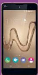
WIKO ROBBY 99€ 130€