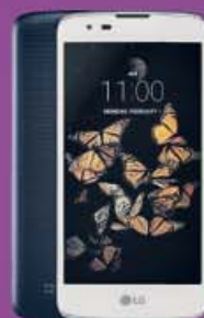
LG K8 129€ 160€