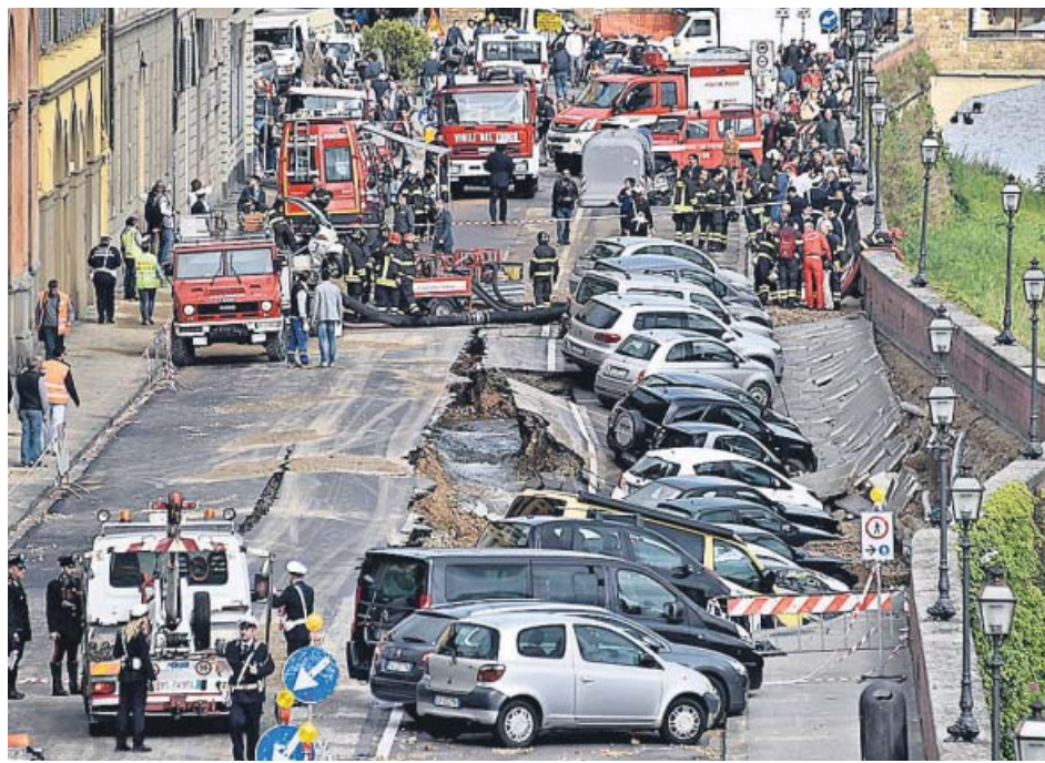
Varios coches engullidos por un socavón a orillas del río Arno en Florencia.

La justicia sueca decidió ayer mantener el orden de arresto dictada en 2010 contra el fundador de WikiLeaks, Julian Assange, por un supuesto delito sexual. El tribunal dice que existe el riesgo de que quiera evitar un juicio.