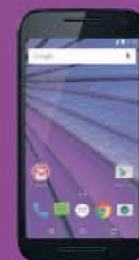
MOTO G 3ª GEN 129€ 150€