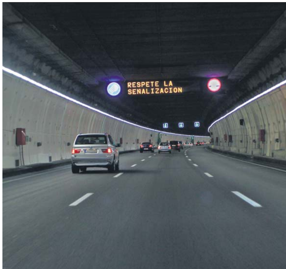
Interior de uno de los túneles de la M-30.

Antes, el Gobierno municipal (Ahora Madrid) había detectado otras irregularidades.