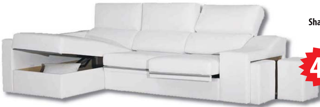
Shaise Longue desde