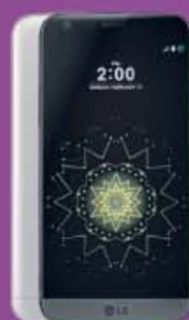
LG G5 599€ 600€