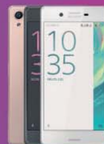
SONY XPERIA X 599€ 620€

Siempre cerca de ti: más de 500 tiendas Phone House o www.phonehouse.es