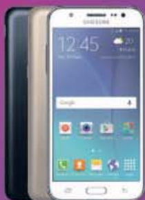
SAMSUNG GALAXY J5 149€ 170€