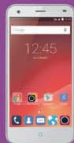
ZTE BLADE S6 159€ 180€