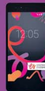
BQ AQUARIS M5 189€ 240€