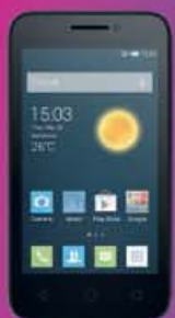
ALCATEL PIXI 3 4" 49€ 50€