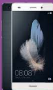
HUAWEI P8 LITE 159€ 220€