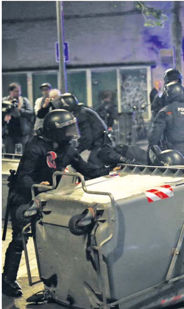
Agentes retiran contenedores volcados la noche del martes.

Tres noches de enfrentamientos en el barrio barcelonés tras una desocupación ponen en jaque a la alcaldesa y vuelven a suscitar polémica en torno a los Mossos