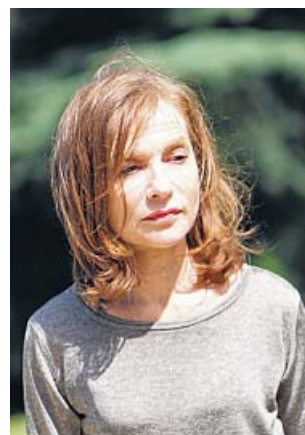
Isabelle Huppert convence en El porvenir.

Isabelle Huppert nos conduce al éxtasis en sus últimos registros de la mano de cineastas como Hong Sang-soo, Paul Verhoeven (en su esperadísimo regreso al vértice de la perversión, Elle , que se estrena la semana que viene) y la que nos compete ahora: Mia Hansen-Løve, quien consigue exprimir, con la hermosa sencillez de sus gestos filímicos, todo el jugo agrídulce