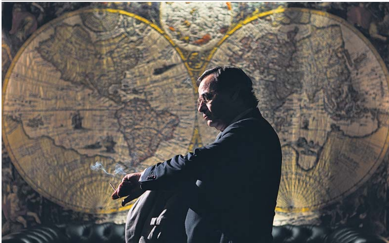
Eduard Fernández se transforma con bastante parecido en Francisco Paesa.

política para que las cañerías se atoren o desatasquen a placer del contratante. No obstante, a pesar de realizar el trabajo sucio, siempre termina con las manos aparentemente más limpias que todos los que le rodean.