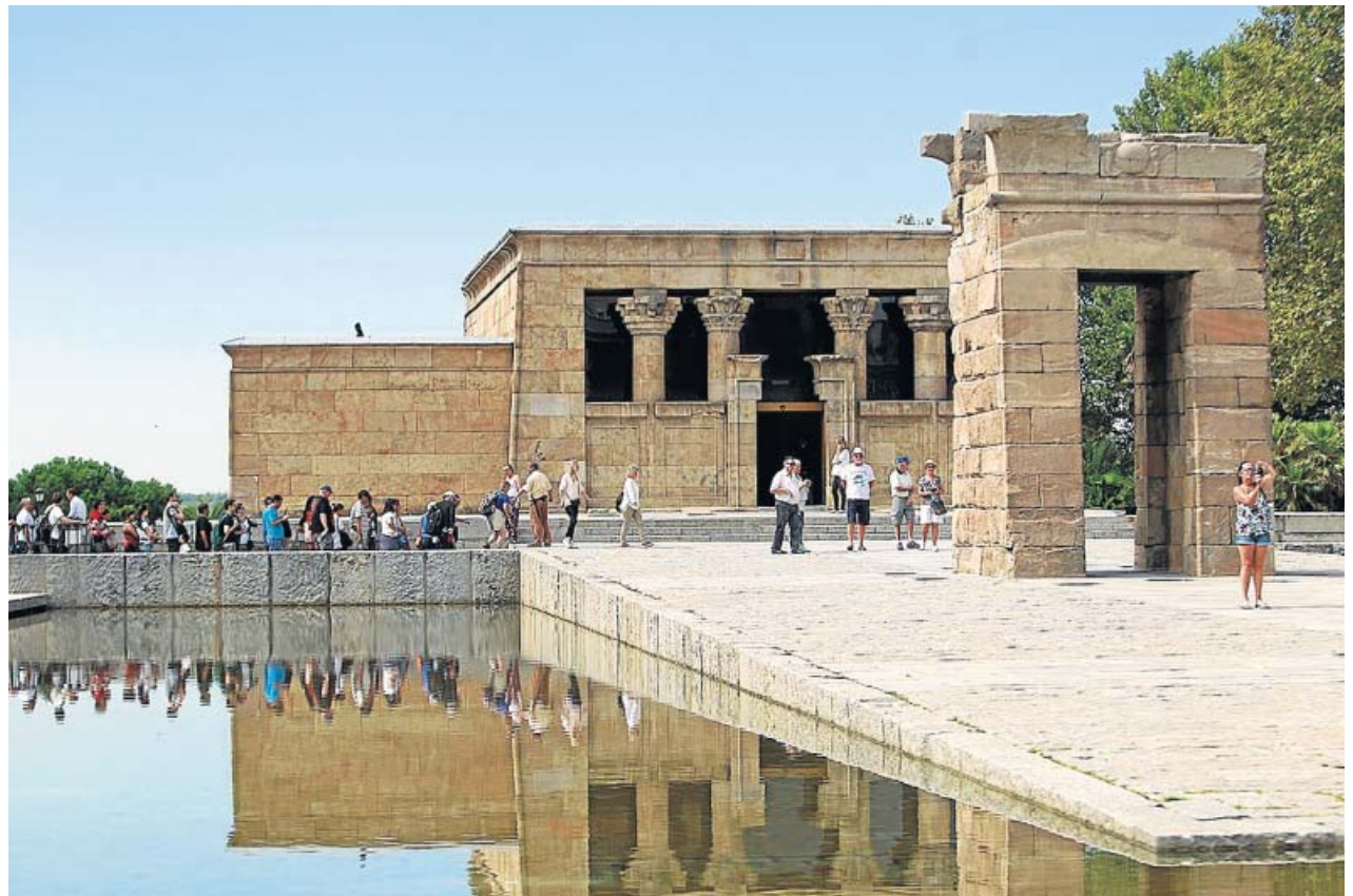
Los turistas ya pueden visitar de nuevo el Templo de Debod. JORGE PARÍS