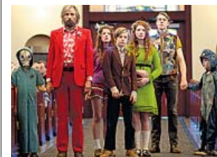
La familia completa, en una escena de la película.

Pero se ajusta al cine indie más amable y, aunque trata la subversión, resulta mansa en forma y contenido, llegando a obviar toda la problemática que