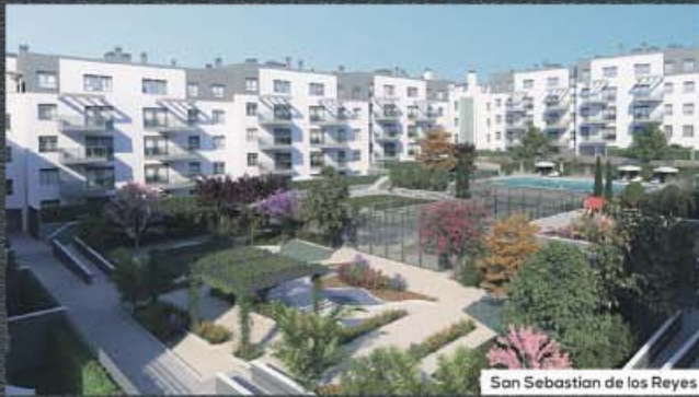
San Sebastian de los Reyes