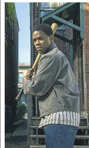
Fences trata la discriminación racial en el béisbol.

En los años 50, Troy Maxson es un humilde trabajador del sistema de alcantarillado de la ciudad de Pittsburg. Cuando era joven, Troy siempre soñó con convertirse en jugador de béisbol profesional, pero por aquel entonces la primera división de este deporte no admitía a jugadores negros.