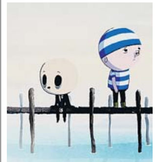
Pisconautas es animación de calidad para adultos. BASQUE FILMS

Tras un exitoso paso por festivales y una amplia cosecha de premios, coronada con el Goya a mejor película de animación, llega a los cines este largometraje animado español. Cuenta la historia de una isla poblada por animales antropomorfos, que deben superar los traumas y las pérdidas generadas por una catástrofe ambiental que arrasó con buena parte del lugar y acabó con la vida de muchos. Birdboy y Dinki, un niño pájaro y una niña ratón, enfrentan la pérdida de sus pa-