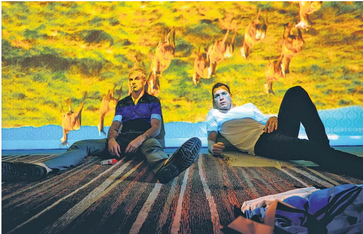
Jonny Lee Miller e Ewan McGregor vuelven a meterse en el pellejo de Sick Boy y Mark Renton.