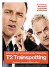
2017. Director: Danny Boyle Reperto: Ewan McGregor, Robert Carlyle, Jonny Lee Miller

Sin embargo, como continuación fan service , como homenaje al universo Trainspotting , es soberbia. Todas las escenas icónicas de la cinta original tienen aquí su reflejo, ya sea mediante repetición, variación, mención explícita o sutil guiño. También a través de flashbacks , muchos, demasiados a veces según avanza la película. La autorreferencia es constante. Estos recursos, que muchos verán como trucos fáciles y prescindibles, son pura metadona boyliana para los adictos a Trainspotting que lle-