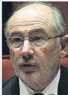
Rodrigo Rato De 2010 a 2012

Su amigo Aznar le puso al frente de Caja Madrid sin tener formación financiera. Le absuelven del delito de administración desleal, pero le mandan 6 años a la cárcel por desvalijar el banco. A otra amiga de los Aznar, Carmen Cafranga, 1 año y 8 meses.