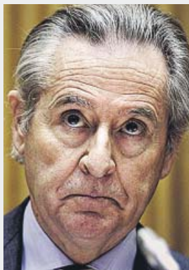
Miguel Blesa de la Parra 13 años y medio al frente del banco

Su amigo Aznar le puso al frente de Caja Madrid sin tener formación financiera. Le absuelven del delito de administración desleal, pero le mandan 6 años a la cárcel por desvalijar el banco. A otra amiga de los Aznar, Carmen Cafranga, 1 año y 8 meses.