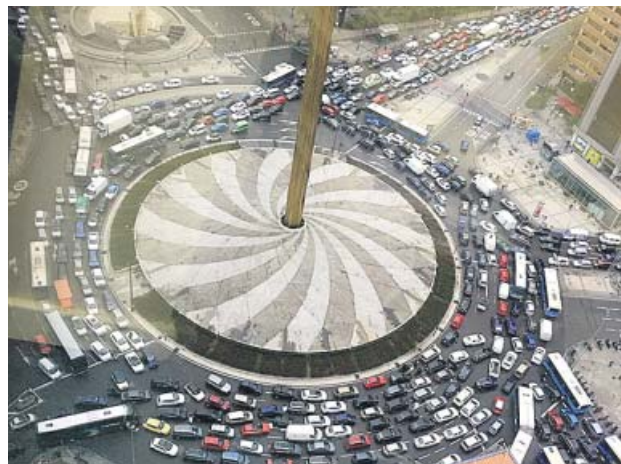
La rotonda de Plaza de Castilla, colapsada ayer.