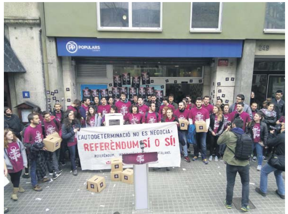
Policías y bomberos evacuando, ayer, a uno de los estudiantes heridos en la avalancha.

saldo que tenía la cuenta cuando la transfirió a su hermano, pero que se hizo de forma legal, por lo que el documento debe estar en el banco, explicó. El exdiputado de CiU, al igual que el resto de los hermanos, tuvo desde 1992 cuenta en la entidad Andbank, en la que se registraron ingresos por 955.254 euros. En 2010, como ocurrió también en el caso de sus hermanos, se transfirieron los fondos a otra entidad andorrana, BPA, aunque, a diferencia de ellos, luego se sacó todo en efectivo, sin que se sepa el «destino final» del dinero, sostiene el juez. ● R. A.