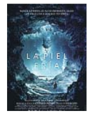
2017. Director: Xavier Gens Reparto: David Oakes, Ray Stevenson, Aura Garrido

Algo parecido sucede con el final, excesivamente frío. Uno