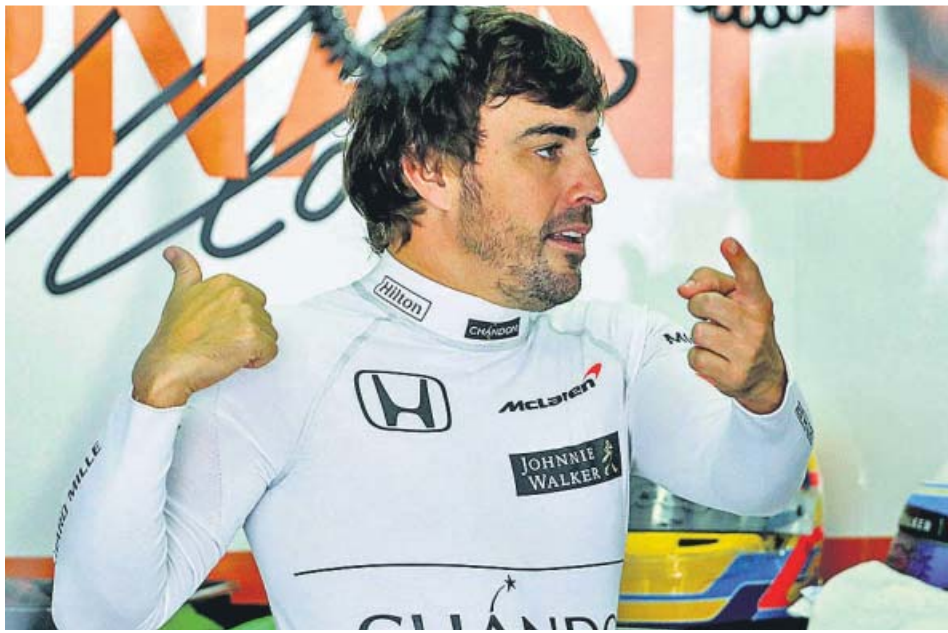
Fernando Alonso, piloto de la escudería McLaren.