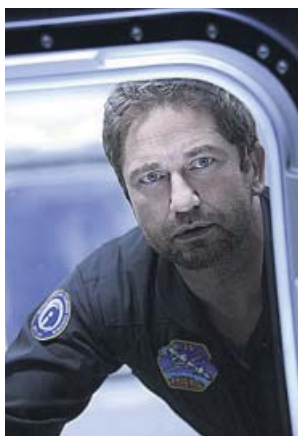
Gerard Butler es la esperanza ante la catástrofe.

Para contrarrestar una serie de desastres naturales que amenazaban el planeta, los líderes mundiales crearon una red de satélites que permitía dirigir el clima. Ahora, este sofisticado sistema se ha descontrolado y podría desatar una devastadora tormenta a escala global. Max y su hermano, con el que lleva años sin hablar, intentarán solucionar la crisis en el espacio. Mientras, en la Tierra se trama una conspiración para asesinar al presidente de EE UU. A pesar de su descabellado planteamiento, ha contado con la colaboración de la NASA para rodar en sus instalaciones. ●