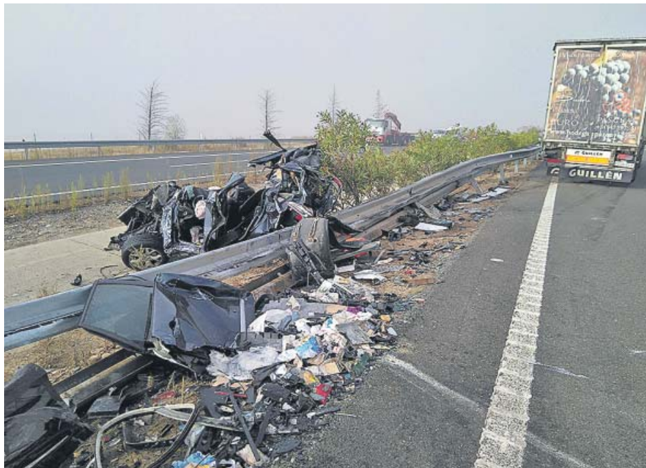
Así quedó la autovía que une Navalmoral de la Mata con Plasencia tras el accidente.

Un total de 36 vehículos se vieron implicados en esta colisión múltiple ocasionada por un banco de niebla, y se necesitaron hasta cuatro dotaciones de bomberos para rescatar a dos personas que quedaron atrapadas por el choque. Entre los coches afectados, había varios camiones de gran tonelaje. ● R. A.