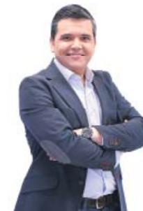
Alfredo Menéndez Periodista de RNE

Esto es como uno de esos partidos de tenis de Wimbledon, interminables, en los que vas viendo cómo caen los juegos de uno u otro lado pero al final parece que ninguno de los dos jugadores quiere ganar porque están más bloqueados por el miedo a perder. La situación entre Carles Puigdemont y Mariano Rajoy es una de esas finales, porque en realidad los dos saben que es imposible que uno se lleve el trofeo y el otro el premio de consolación por más que la raqueta más grande la tenga uno de ellos. Aquí el que se mueve, pierde. Y si tú me mandas un globo liftado con un requerimiento, yo te respondo en el último momento con un passing shot que te obliga a quedarte al fondo de la pista. De vez en cuando paran, se comen un plátano y recuperan fuerzas. Rajoy al servicio, con bola de set el sábado, pero la final no ha terminado. Hay partido y el cuello empieza a doler de mirar a uno y otro lado. ●