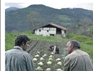
Mezcla de ficción y realidad en el País Vasco. A CONTRACORRIENTE

Después de luchar en la Primera Guerra Carlista, Martín vuelve a su caserío familiar en Gipuzkoa con la tremenda sor-