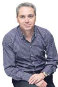
Vicente Vallés Periodista

Si el problema de Cataluña se hubiera producido en la Italia de los años 70, Giulio Andreotti habría encontrado la fórmula. Era un democristiano purasangre: maquiavélico, retorcido y cínico. Siendo la Transición española una labor de virtuosismo, el hábil político italiano dijo que, aun así, «manca finezza» (falta finura). Andreotti habría hecho un ejercicio churriguero con la carta de Puigdemont: concluir que no se ha instalado fuera de la ley al asegurar que el Parlament podría declarar «la independencia que no votó el día 10 de octubre». Agarrado ese párrafo por los pelos, paralizado el 155 y dando carrete a una estéril esperanza de negociación, Moncloa podría haber ganado tiempo y provocado la confusión general. Y no hay armamento más dañino que provocar su confusión. Pero ya no hay acuerdo que pueda satisfacer a todos. Solo cabe que uno gane y el otro pierda. No es lo óptimo, pero es lo que hay. Salvo sorpresa, que no es descartable. ●