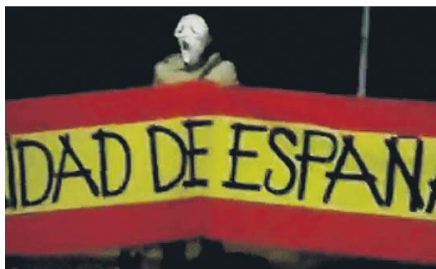
Escrache en casa de Mónica Oltra.