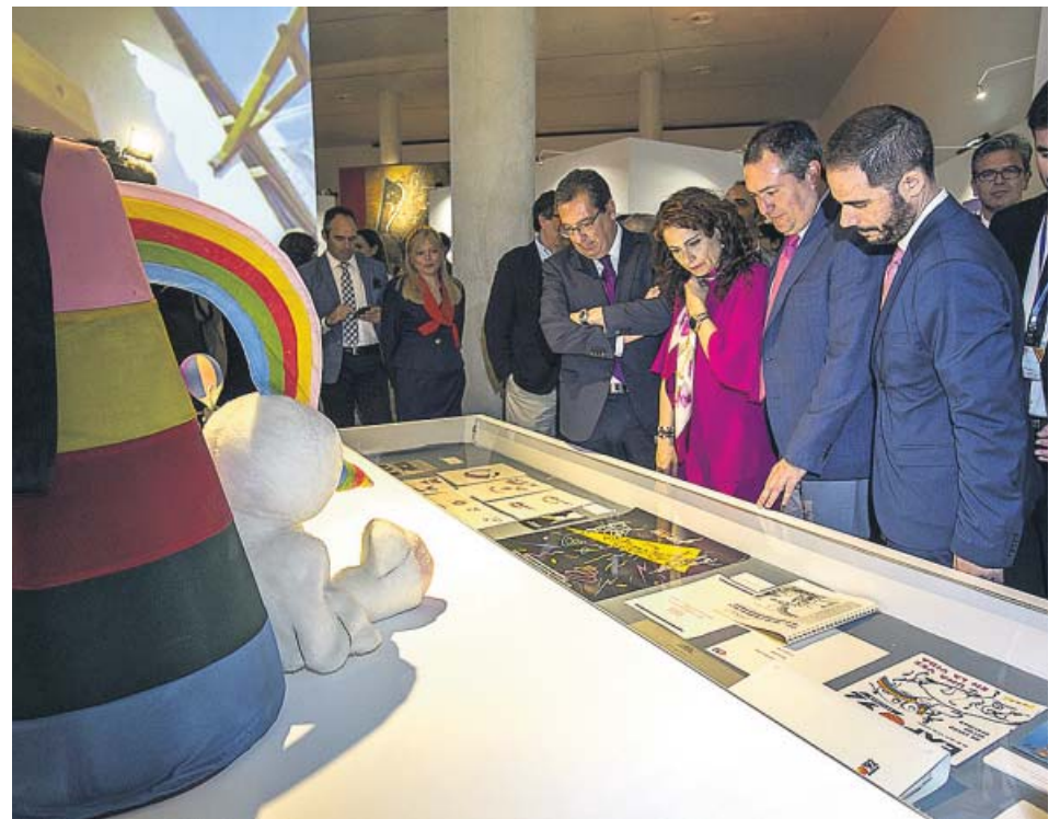
El alcalde de Sevilla, Juan Espadas (2d), junto a otras autoridades, en la muestra.

El conflicto está originado debido a la ampliación este año de la Feria, que tendrá un día más de duración. Los trabajadores aseguran que pasarán de «prestar siete días de servicio especial de 24 horas a nueve días de servicio especial ininterrumpido», lo que supone, dicen, una «modificación sustancial de los turnos, horarios y carga de trabajo. «Había que negociar un acuerdo de compensación», exigen. La empresa afirma que las exigencias de la plantilla supondrían una «modificación del convenio», que ya contempla «compensaciones salariales durante los servicios especiales». ● R. A.