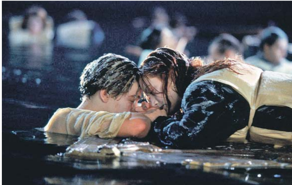
Leonardo DiCaprio y Kate Winslet en la controvertida escena de Titanic .

En su momento provocó enormes colas en los cines de todo el mundo durante semanas y semanas. Después de su pase por diversos festivales, el primero en Tokio el 1 de noviembre de 1997, se estrenó comercialmente a partir del 18 de diciembre, y eclipsaría a la película destinada a arrasar en esas Navidades: la decimotava de la saga Bond, El mañana nunca muere , con Pierce Brosnan. A los cines españoles Titanic llegaría poco