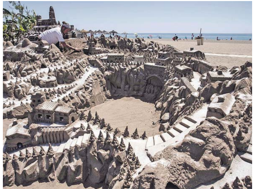
La escultura de arena Montaña de Burgo , con la que Afis ha reproducido su pueblo.

El mercado de segunda mano funcionará algo mejor, no solo este año sino también el que viene. El sector prevé que cuando finalice 2017 se habrán vendido cerca de 400.000 coches usado en la comunidad, un 9% más que en 2016; y para el año siguiente, en 2018, se espera un aumento del 6%. ●