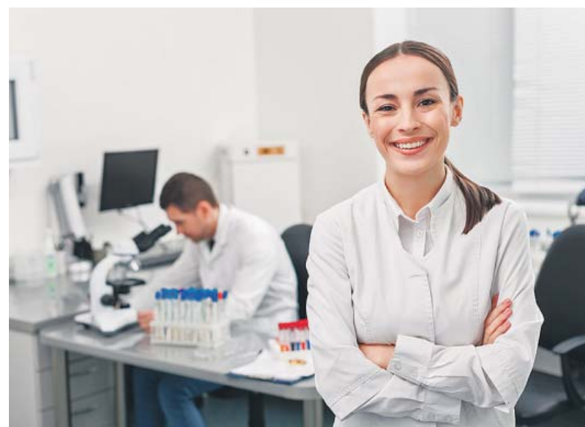
Un comité de profesores del MIT evaluará las propuestas.

Naveed se siente muy agradecido por el apoyo que le han brindado y tiene claro qué hará en cuanto tenga trabajo y dinero: «Iré de voluntario a Lesbos. A mí me han ayudado y yo también quiero ayudar». ●