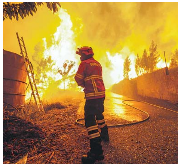
Un bombero intentaba, ayer, sofocar las llamas.

●●● España también está siendo víctima estos días de los incendios forestales. Ayer, en concreto, hasta un total de cuatro se registraron en Córdoba (1), Sevilla (2) y Huelva (1), y dejaron más de una veintena de hectáreas calcinadas. Todos ellos fueron controlados a tiempo por las autoridades. También ayer, un hombre de 36 años fue detenido por la Policía Local de Toledo como presunto autor de un incendio con tres focos distintos junto a la autovía A-42.