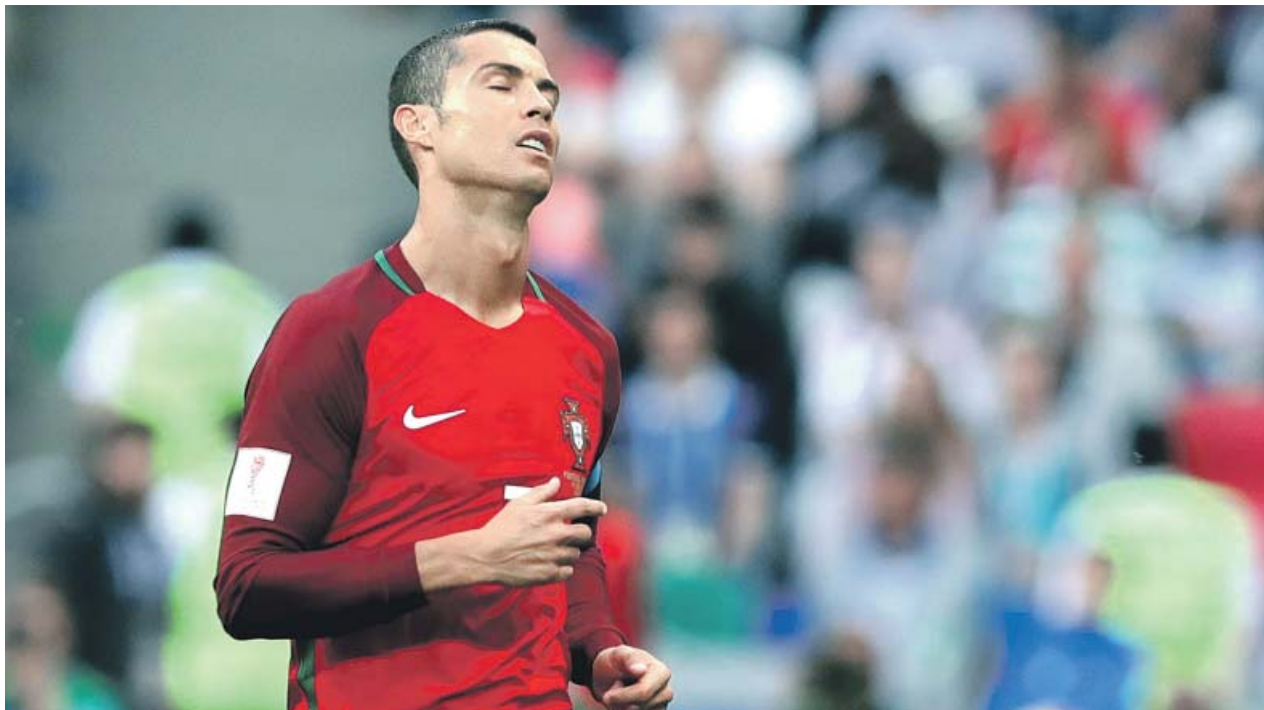
Cristiano Ronaldo se lamenta en el partido ante Chile, en el debut de Portugal en la Copa Confederaciones.

IRREGULAR choque del luso en su debut en la ConfeCup ante Chile, que empató en el 91 DIO la asistencia del 0-1 tras una gran jugada, pero por momentos estuvo desaparecido