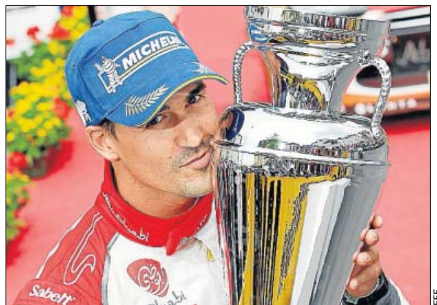
BIO Nació en Torrelavega en 1983. Debutó en el Mundial de Rallies en 2003. El pasado mes de agosto logró en Alemania su primera victoria en la categoría WRC.

Al principio sí que me comparaban siempre con Carlos. Con el paso de los años, la