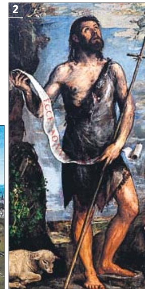
1. Paisaje con San Cristóbal, de Joachim Patinir 2. San Juan Bautista, de Tiziano. 3. Cristo coronado de espinas, de El Bosco.

pinturas y reliquias (como árboles genealógicos, libros miniados, bocetos arquitectónicos o documentos) que no se suelen exponer al público. Entre las piezas destacan obras de El Bosco y Tiziano. De este último es el tríptico que Felipe II instaló en la iglesia pequeña del monasterio formado por El Martirio de San Lorenzo , El entierro de Cristo y La Adoración de los Reyes . También destacan dentro de la muestra dos obras de El Bosco: Cristo coronado de espinas y el Ángel , este último uno de los artistas favoritos del monarca Felipe II.