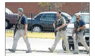
Policías rodeando el edificio.

Entre ellos, el presunto autor del ataque. Al menos 13 personas murieron ayer, entre ellas el presunto autor del ataque, en un tiroteo registrado en unas instalaciones de la Armada de EE UU en la capital del país, según informó el alcalde de la ciudad de Washington, Vincent Gray.