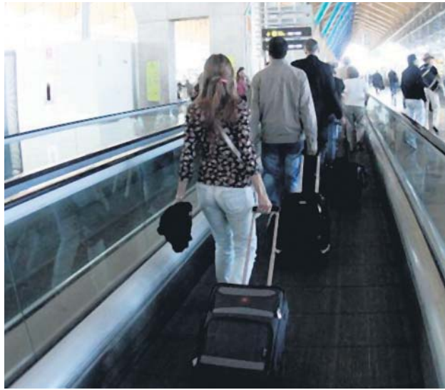
Saber qué países ofrecen mejores condiciones ayuda a decidir.

Actualmente, está cada vez más de moda la movilidad laboral entre los países europeos y este listado puede ser de utilidad para todas aquellas personas que están pensando en desplazarse a otro lugar. Aun así, hay que tener en cuenta que cada cultura es diferente y aunque las condiciones laborales que se ofrezcan sean mejores que las del país de origen, puede que nuestro estilo de