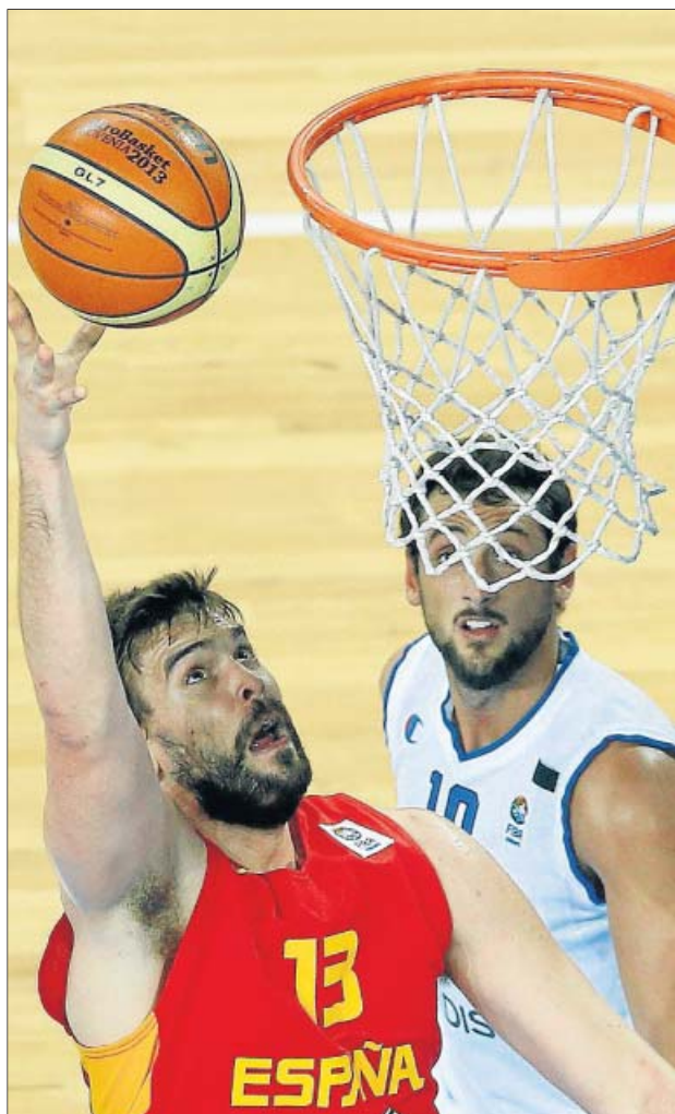
Marc Gasol, ante el alero italiano Marco Belinelli.

Italia no se rindió y de perder hasta por 15 se acercó a solo dos puntos en el último minuto. La última posesión de los transalpinos acabó con canasta de Datome, lo que llevó el partido a