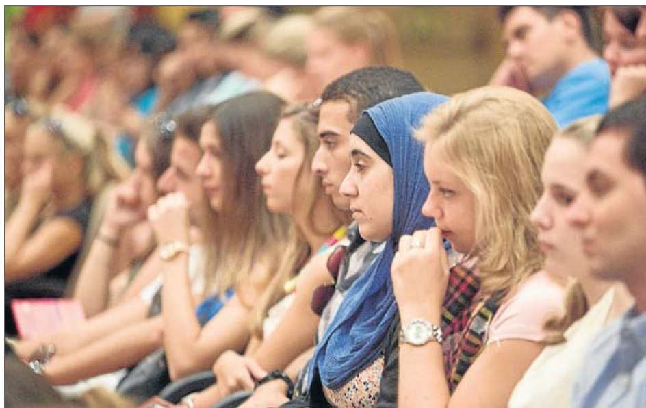
Alumnos extranjeros en el acto organizado por la Hispalense ayer para darles la bienvenida.

El informe de CSIF (ha encuestado a más de 600 docentes y 300 equipos directivos) apunta que solo se han iniciado las