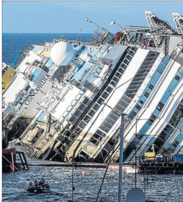
El operativo concluirá, previsiblemente, en la primavera del próximo año.

Una vez que el crucero se encuentre ya en posición vertical se pasará a la siguiente fase: disponer 15 nuevos flotadores-estabilizadores en la parte izquierda del casco para que, gracias a un sistema neumático, se expulse el agua de forma gradual de su interior.