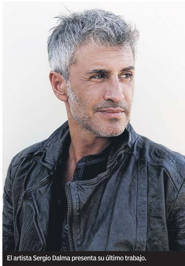
El artista Sergio Dalma presenta su último trabajo.

que ahora recalca en Granada y en Córdoba, el cantante ofrecerá una selección de este último álbum y un repaso por