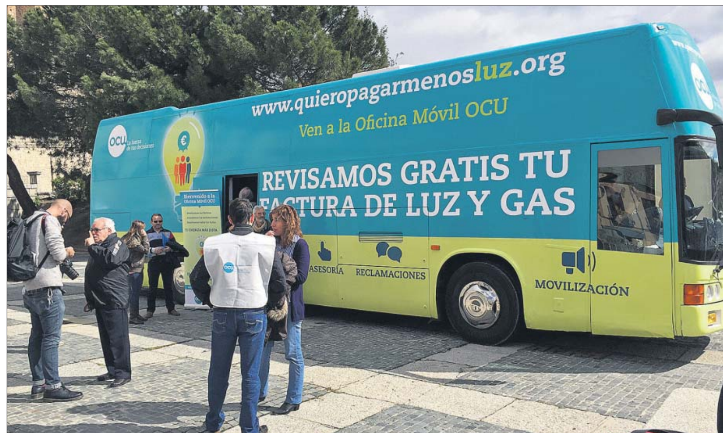
La Oficina Móvil OCU ofrece a los consumidores asesoría energética personalizada, además de la posibilidad de inscribirse en la III Compra Colectiva de Energía.

Hasta el 3 de mayo puedes inscribirte en www.quieropagarmenosluz.org , la III Compra Colectiva de Energía de OCU, y reducir tu factura a través de la oferta ganadora de la subasta y de muchas otras ventajas que te permiten ahorrar desde el primer momento.