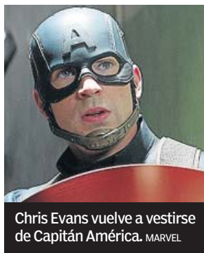
Chris Evans vuelve a vestirse de Capitán América.

derosos del planeta y les impone un registro. Steve Rogers, conocido como Capitán América, no está de acuerdo con esta medida, mientras que su compañero Tony Stark, alias Iron Man, decide