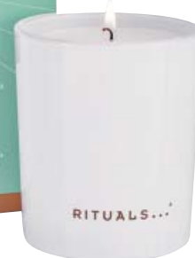
PRACTICA EL ARTE DEL BUEN KARMA. La edición especial de Rituals gira en torno al karma: buenas palabras, pensamientos y acciones. Recibes lo que das. Vela de Rituals. 18,50 €. rituals.com