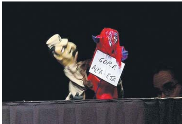
Un fragmento de la representación.

La adaptación a la gran pantalla del best-seller La chica del tren , protagonizada por Emily Blunt, se estrenará en España el 21 de octubre.