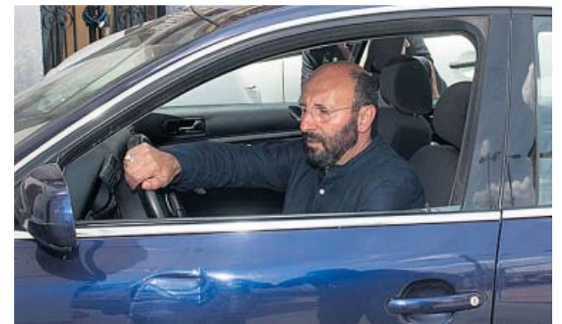
GREGORIO XVIII (SERGIO GINÉS) LO DEJA TODO POR AMOR

Una niña de 14 años permanece grave tras ser atropellada por un coche en la capital cuando cruzaba la calle para coger el autobús.