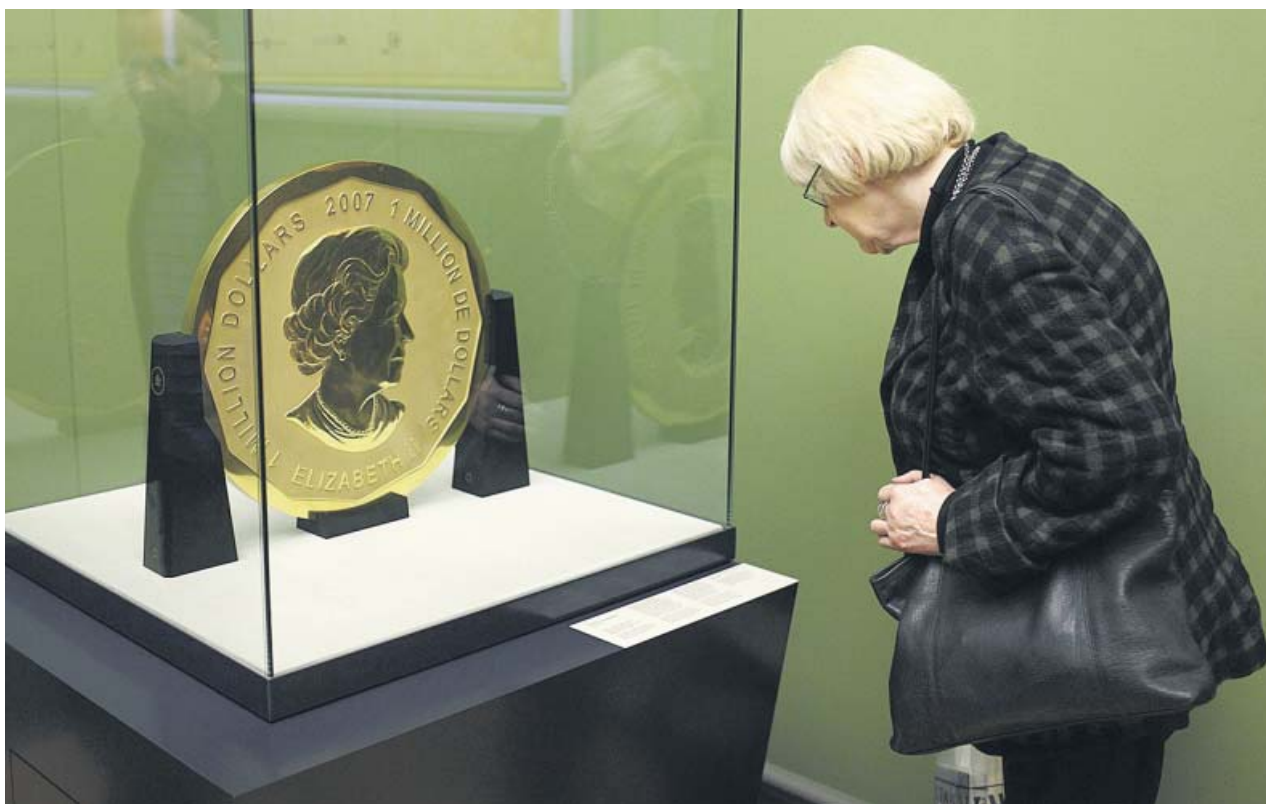
Una mujer observa la moneda robada, en su emplazamiento habitual en el Museo Bode de Berlín.