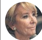
ESPERANZA AGUIRRE Sobre el escarache de la CUP en la sede del PP

«Las imágenes del asalto nos llevan a la Alemania de 1933. Todos los totalitarismos acaban siendo idénticos»