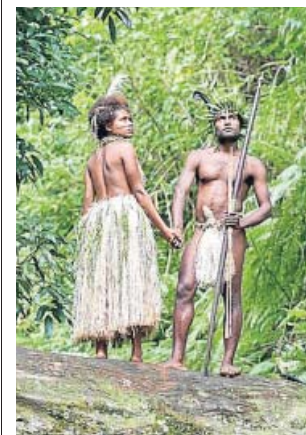
Miembros de la tribu Yakei protagonizan Tanna .

El amor es algo tan universal que la historia de Tanna , ambientada en la República de Vanuatu (una isla volcánica a 2.000 km de Australia, en el océano Pacífico), nos devuelve otra vez a Romeo y Julieta , de Shakespeare. Los documentalistas australianos Bentley Dean y Martin Butler se estrenan en la ficción con esta película basada en hechos reales, donde cuentan cómo una jo-