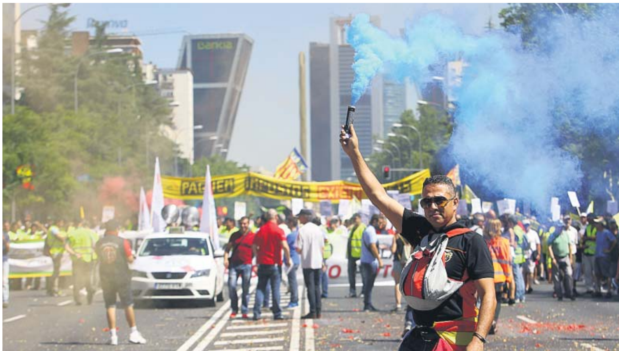
Manifestación de taxistas, ayer en el Paseo de la Castellana de Madrid.