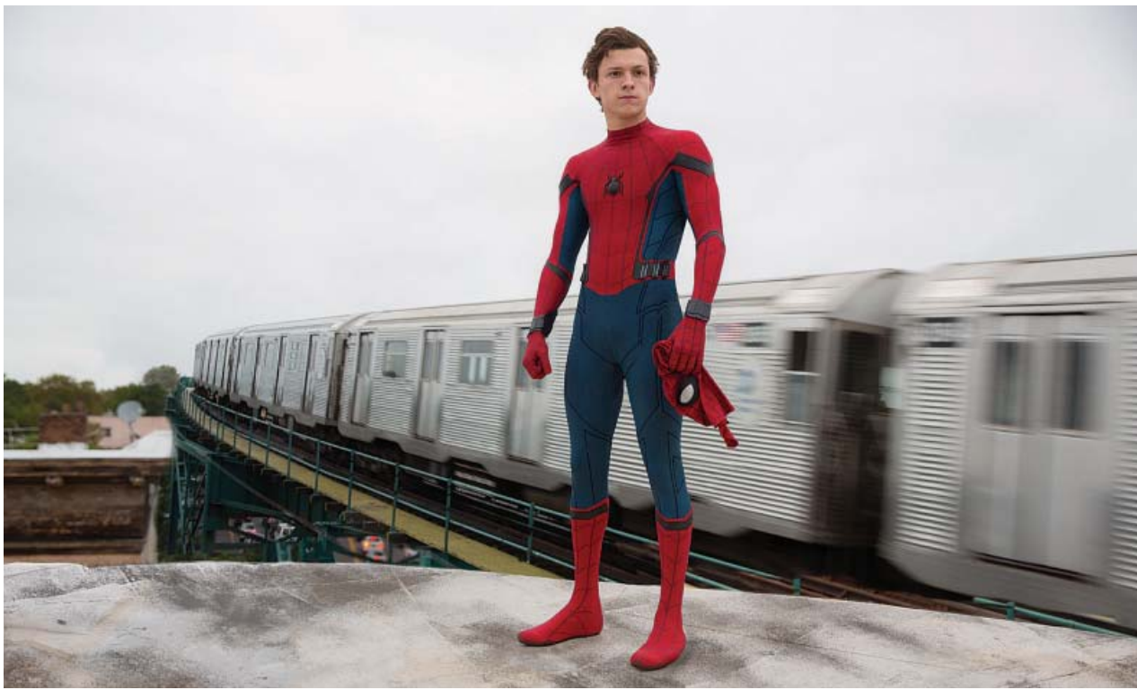
El actor Tom Holland se convierte en el superhéroe arácnido en Spider-Man: Homecoming .