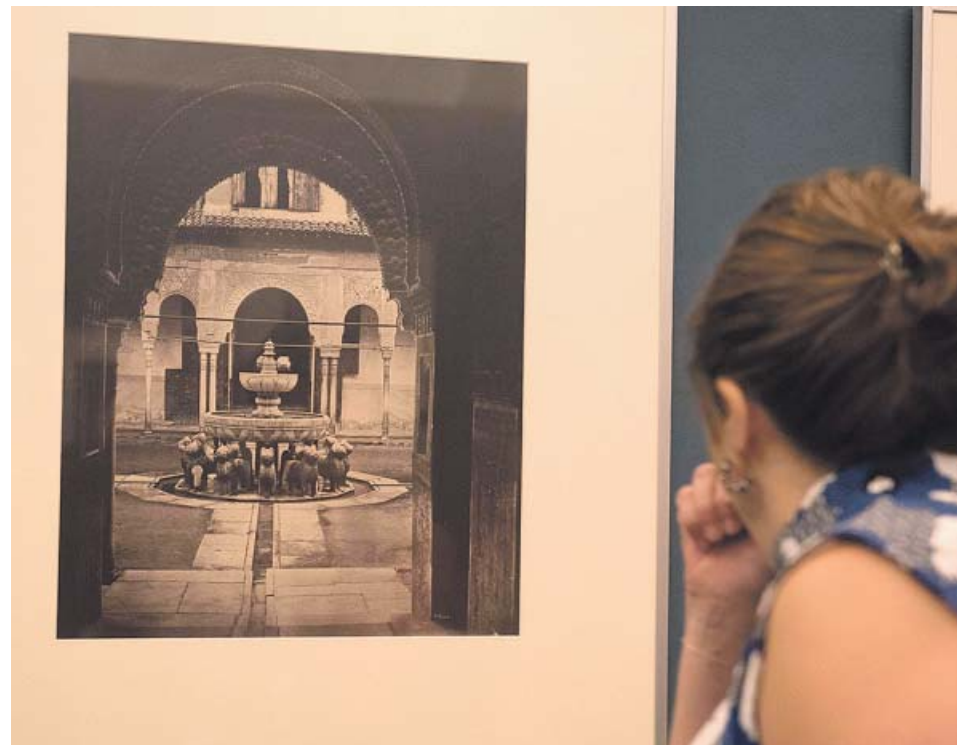
Una mujer observa una de las imágenes de la exposición inaugurada ayer.

Efectivos de la Policía Científica y del Grupo de Homicidios acudieron a la zona para investigar lo sucedido. El levantamiento del cuerpo se produjo a media mañana. La autopsia del cuerpo, que tendrá lugar hoy, determinará las causas de la muerte, así como si se produjo alguna agresión sexual. ● R. A.