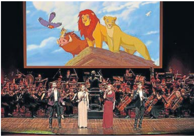
Un momento del 'Disney in concert'.