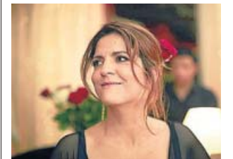
La vida nos da sorpresas incluso a los 50.

Ser abuela a los 50 años es algo que te cambia la vida. Pero lo que realmente puede dar un vuelco a la rutina es reencontrarse con un amor de juventud al que habías olvidado. Esto es lo que le sucede a Aurore: separada y con problemas en el trabajo, deberá dejar su orgullo a un lado para ser capaz de disfrutar de las sorpresas que le depara la casualidad. 50 primaveras es un filme sobre las segundas