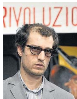
Louis Garrel se convierte en un excéntrico Godard.

The Artist , Michel Hazanavicius vuelve a la gran pantalla y a los homenajes cinéfilos con este biopic de uno de los directores más importantes del cine francés. En Mal genio ( Le redoutable ) cuenta la relación de Godard con su segunda esposa y lo hace partiendo del libro de la propia Wiazemsky,