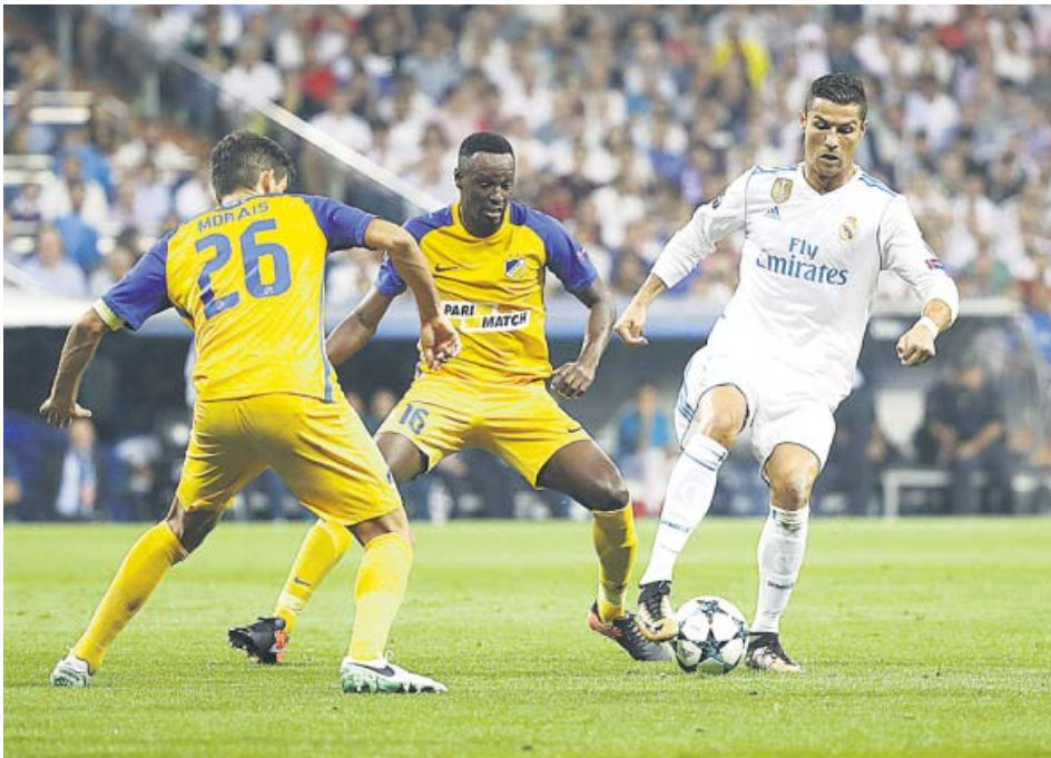
Cristiano Ronaldo controla el balón ante el Apoel.