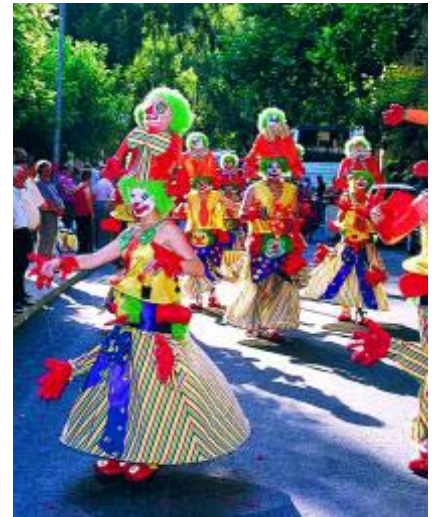
La Pública es muy colorida.