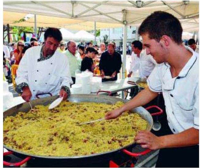
Las comidas populares atraen a todos los vecinos.

* Más información: www.ayuntamientocijuela.com www.turgranada.es