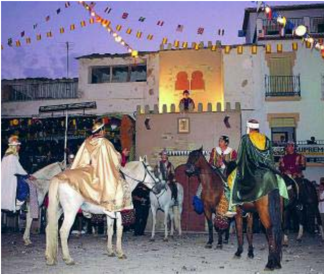
Las plazas acogen la representación de las fiestas.