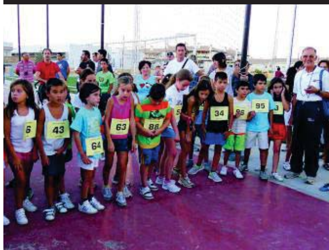
Las actividades deportivas forman parte del programa de fiestas.

Esa misma noche, en el recinto ferial, se presentarán las misses y los misters del municipio que, junto al pregón, abren la fiesta nocturna. Sin duda, las actividades con mayor número de participantes se desarrollan en este lugar, ya que es donde se celebran los conciertos y las verbenas populares, que cada año atraen también a los vecinos de otras localidades. Además, el escenario es utilizado para que las escuelas de baile de Ogijares hagan una exhibición de lo que han aprendido durante los últimos meses. A todas estas actividades hay que unirles un amplio y variado pro-