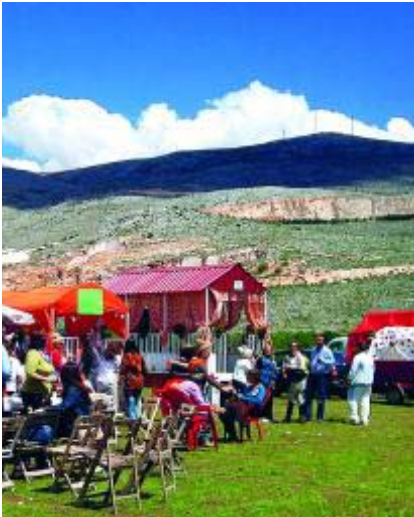
Una romería típica de las fiestas.