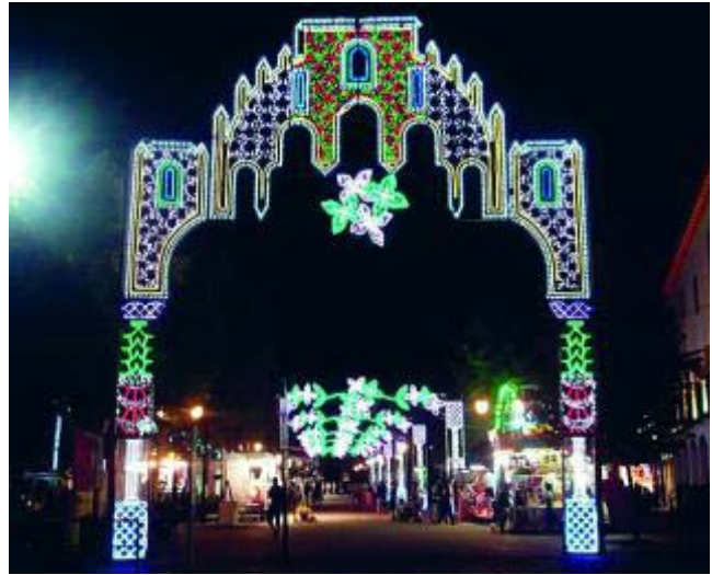
La portada del recinto ferial con su alumbrado.

* Más información sobre el municipio: info@ayuntamiento-peligros.es www.ayuntamiento-peligros.es