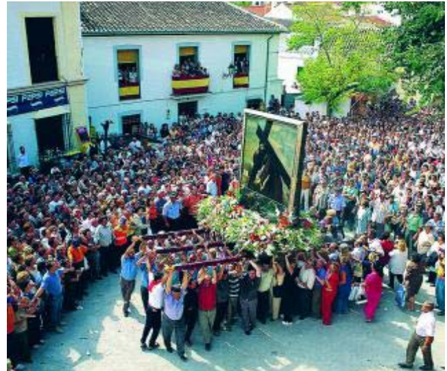
El Cristo del Paño es seguido por miles de fieles.

* Más información: www.fiestasdevalor.es www.turgranada.es