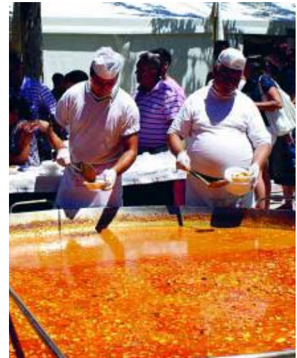
Comidas populares en las plazas. AYTO. ALBOLOTE