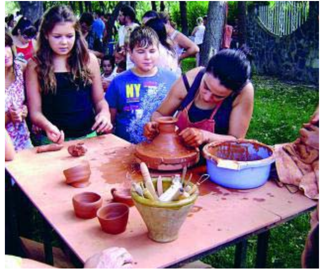
Las actividades para los niños son uno de los platos fuertes.

* Más información: www.hueteorvega.com www.turgranada.es