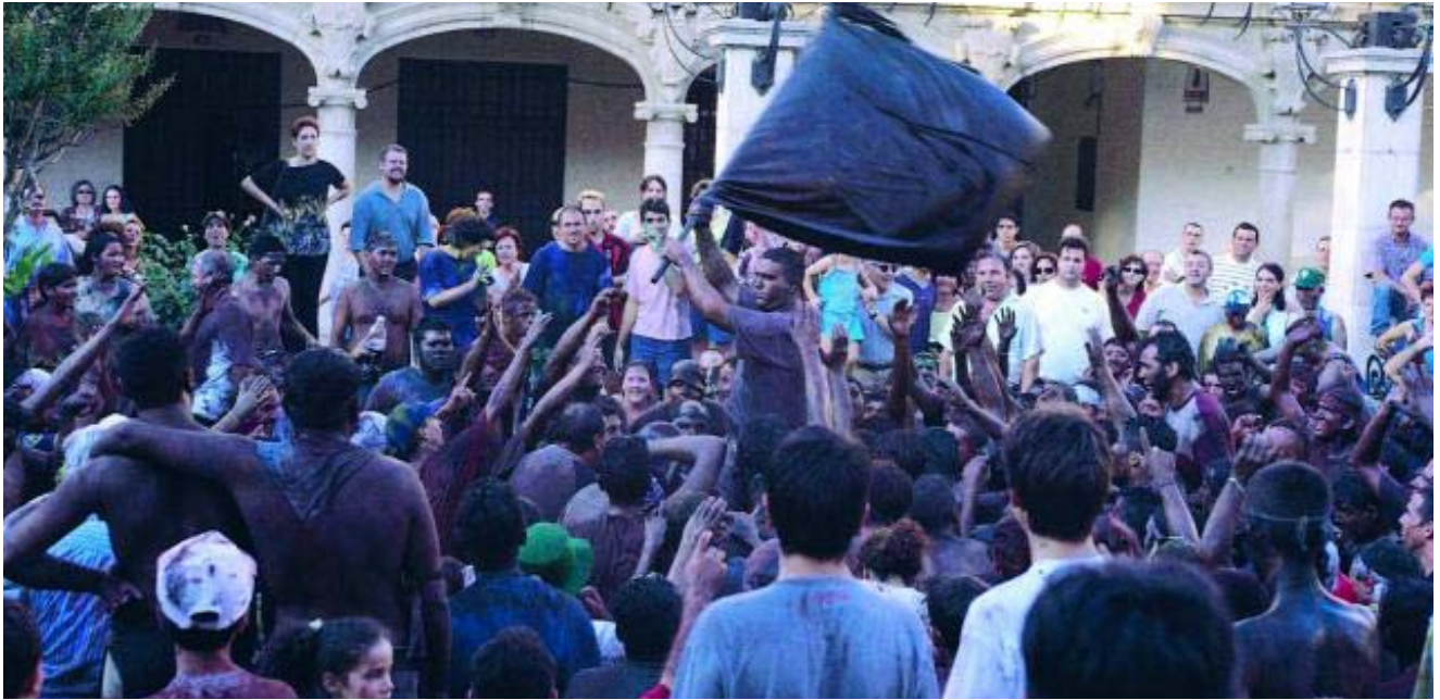
El Cascamorras tiene una misión imposible: ir desde Guadix a la iglesia de la Merced de Baza sin que le manchen.

PATRONATO PROVINCIAL DE TURISMO DE GRANADA