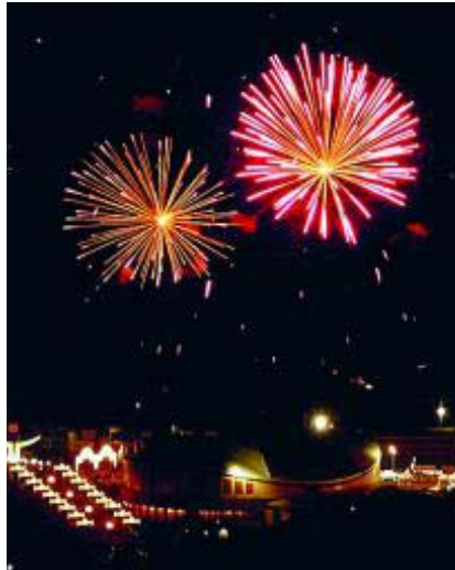
Fuegos artificiales sobre Atarfe.

* Más información: www.ayuntamientolazubia.com