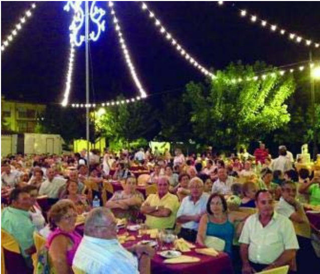
Gente de todas las edades se reúne en las fiestas.