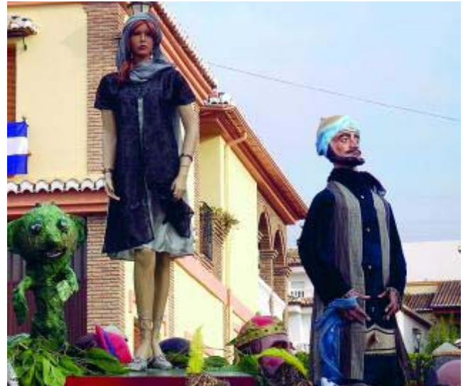
La Pública de las fiestas es una de las tradiciones más arraigadas.