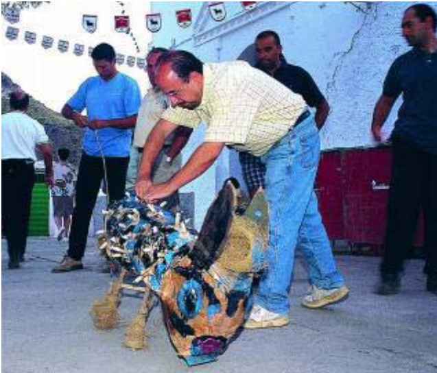
La zorra se fabrica de cartón y se rellena de bengalas.