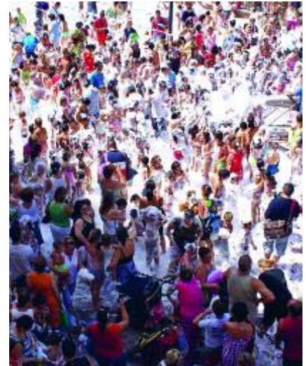
Popular fiesta de la espuma. AYTO. MOTRIL