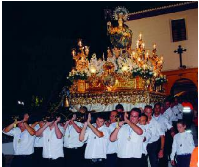
La Virgen de la Aurora es la patrona de la localidad. AYTO. OTURA

* Más información: www.churriandela Vega.org www.turgranada.es