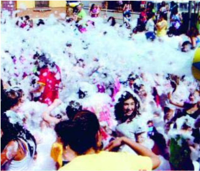
Los menores disfrutan de la fiesta de la espuma.