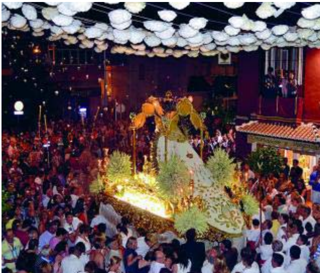
La procesión es uno de los actos principales de las fiestas. AYTO. CHURRIANA DE LA VEGA