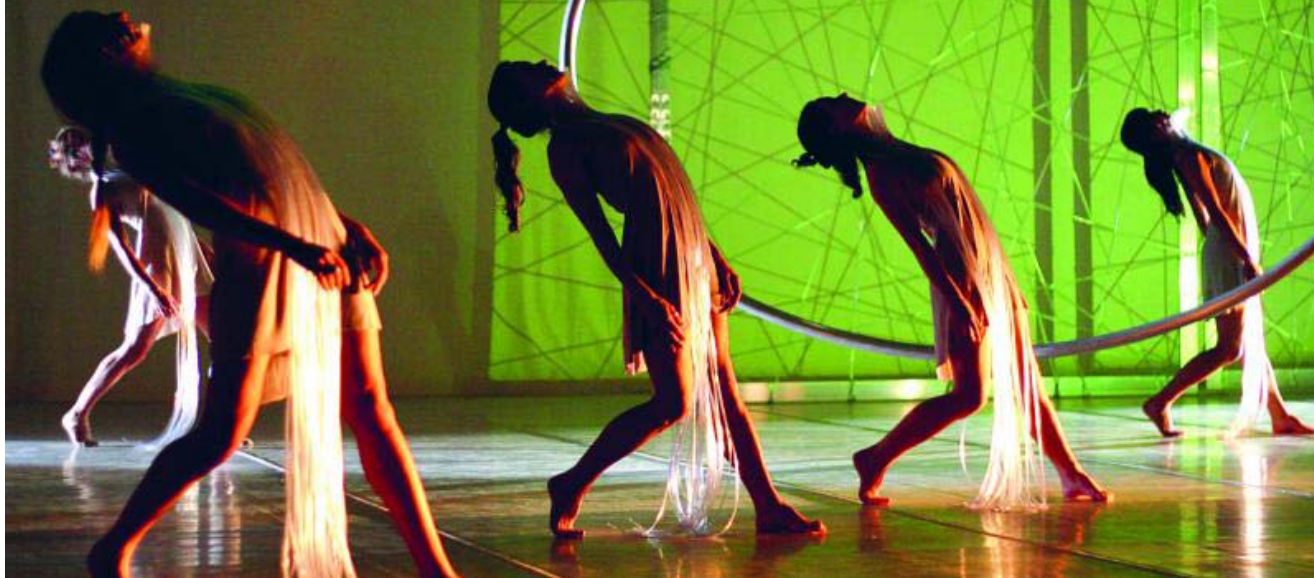
FESTIVAL INTERNACIONAL DE MÚSICA Y DANZA DE GRANADA

El certamen internacional de Granada se desarrolla en escenarios mágicos como los jardines del Generalife