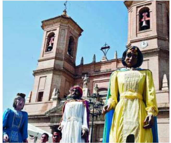
Los desfiles son muy esperados por San Agustín.

* Más información: www.alhendin.org www.turgranada.es