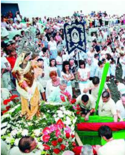
Procesión de la Virgen del Carmen. AYTO. SALOBREÑA