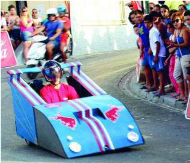
Carrera de autos locos por las calles de la localidad.