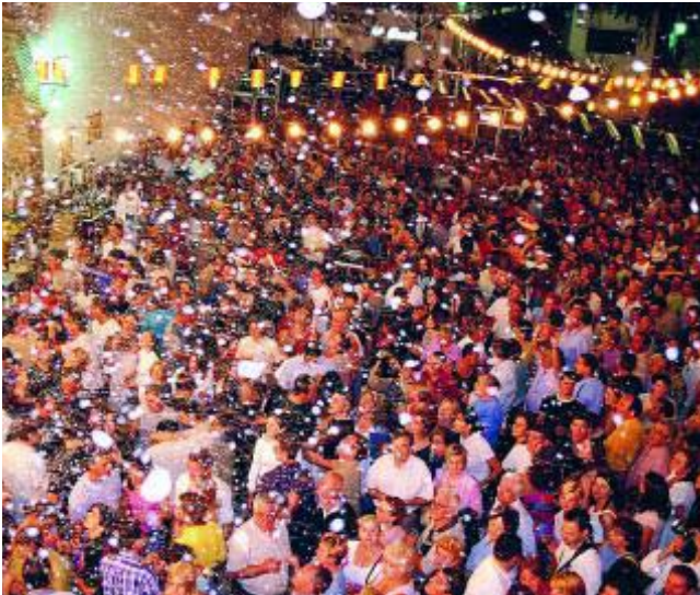
La Nochevieja se celebra en verano.