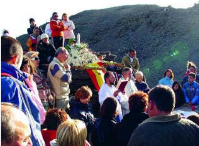
La romería concluye con una misa a los pies del pico del Veleta.