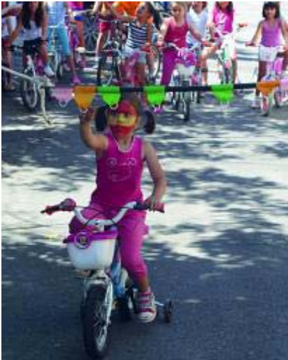
Carrera de cintas por San Antonio.