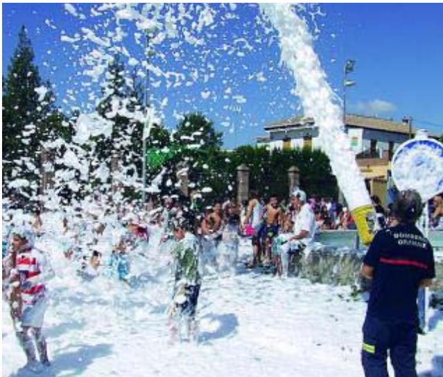
La fiesta de la espuma es un clásico en Jun.