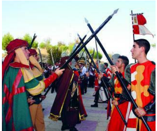
Vecinos ataviados como moros y cristianos.

* Más información: www.berchules.es www.turgranada.es