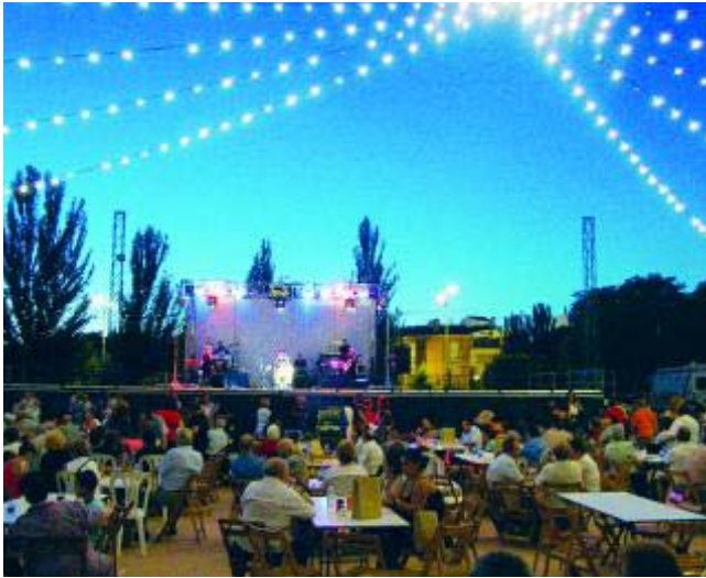
El recinto de la Feria de Verano se llena al fresco de la noche.