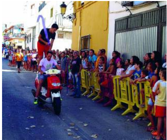
Las carreras de cintas son habituales en estas fiestas.

* Más información: www.ayuntamientojun.org