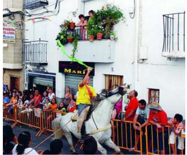
Las carreras de cintas a caballo son típicas en las fiestas.

* Más información: www.maracena.es www.turgranada.es