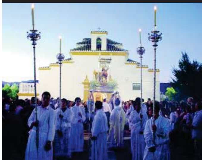
Procesión de la Virgen de las Nieves a la salida de su ermita.

La Virgen de las Nieves está todo el año guardada en una pequeña ermita en la falda de Sierra Nevada. Pero el 15 de agosto se engalana y sale en procesión hasta el pueblo. Durante estos días, Dílar se viste con sus mejores atuendos y se llena de actividades culturales y lúdicas que atraen a muchos visitantes de distintos puntos de la provincia. Cada noche culmina con la verbena