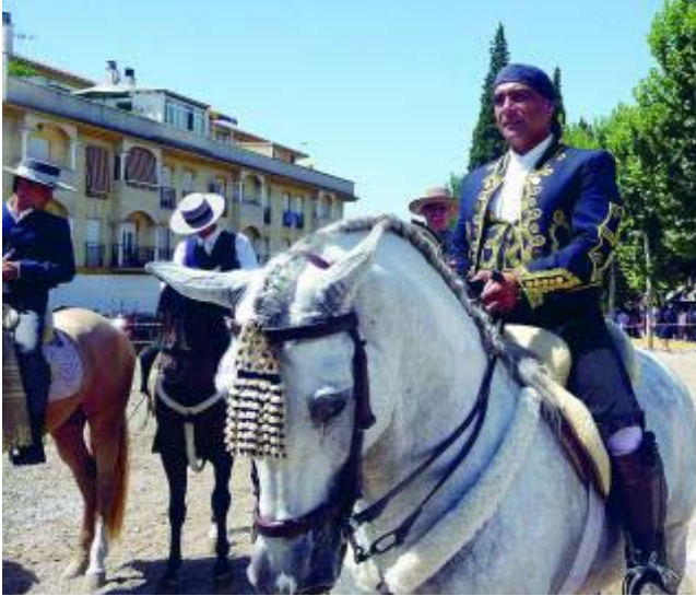
Los caballos son una pieza fundamental en las celebraciones.