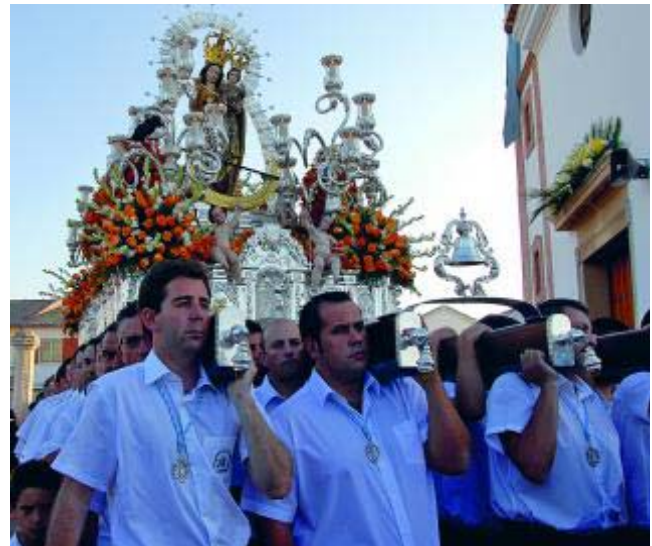
Procesión de la Virgen de las Nieves, su patrona.

* Más información: www.monachil.es www.turgranada.es