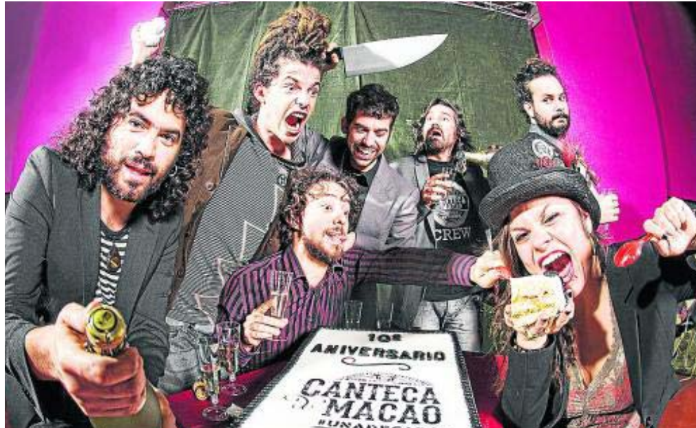
Canteca de Macao presentarán la noche del viernes Nunca es tarde .