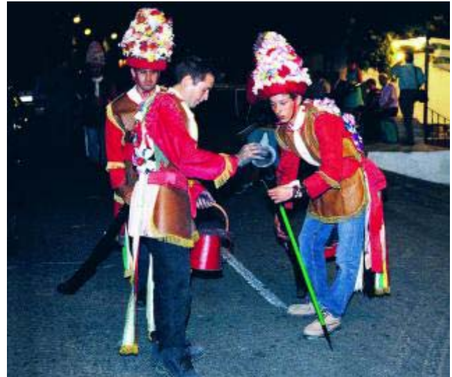
Mosqueteros cargando su arcabuz.

* Más información: www.lataha.es www.turgranada.es