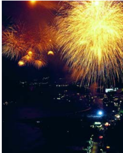
Fuegos artificiales. PATRONATO PROV. DE TURISMO

* Más información: www.ayto-salobreña.org