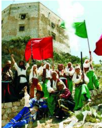
El Castillo de la localidad.