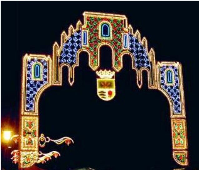
La portada de la feria abre paso al recinto ferial.