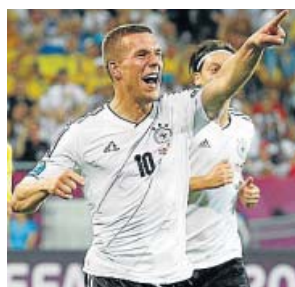
Podolski dedicó su gol a los aficionados alemanes.