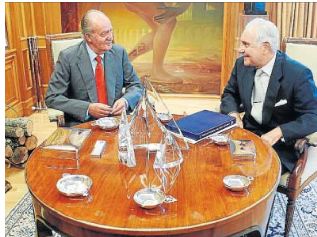
Dívar y el rey, en una audiencia el pasado mes de septiembre.

El cambio de agenda del rey pondrá hoy todos los focos