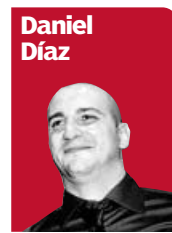
Ni libre ni ocupado

Un hombre subió a mi taxi y me pidió, con la que está cayendo, que lo llevara a la plaza de España. Asombrado, me di la vuelta y le pregunté que para qué quería ir a ninguna parte, si ahora es Merkel quien decide dónde tenemos que ir todos. El hombre se excusó alegando que era griego, que en sus manos estaba el destino de Europa, y me pidió que arrancara mi taxi por el bien de la democracia. Para evitar problemas con la troika, al final lo llevé. No fue un trayecto fácil. Tuvimos que sortear los agujeros de la banca, saltarnos unos cuantos indicadores en rojo y esquivar el cordón sanitario que habían dispuesto alrededor del Congreso. Al llegar, aprovechando un descuido del Fondo Monetario Internacional, me pagó la carrera con dracmas y salió silbando. Pero ahí lo esperaba Christine Lagarde, que por poco le atiza con su bolso Louis Vuitton. Le reprochaba haber cogido un taxi en lugar de ir caminando, que es lo suyo en los tiempos que corren. Después me alejé y encendí la radio. Salió Rajoy diciendo que todo estaba bajo control.