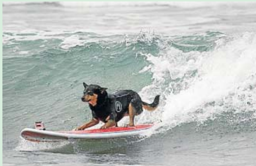
¡GUAU, ASÍ SE SURFEA! Los mejores surfistas del mundo canino se lucieron en las playas de San Diego (California), en un campeonato de surf para perros.

Y muchas más, en las fotogalerías de 20minutos.es