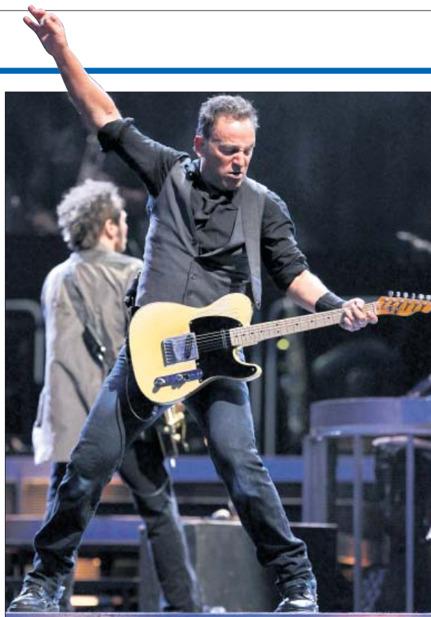
Springsteen, en su concierto de ayer en Madrid (arriba). A la derecha, Nacho Hurtado.

pusieron en marcha la campaña en Twitter y han logrado su objetivo