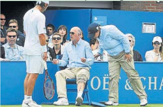
AGRESIÓN. Nalbandián propinó una patada a la silla de un juez de línea, que sufrió una herida leve, y fue descalificado de la final de Queen's. El título, para Cilic.