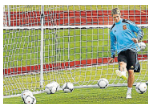
Fernando Torres, rodeado de balones en un entrenamiento.

«Hablamos mucho de fútbol en el vestuario, pero sabemos lo que ocurre en nuestro país. Ojalá el fútbol siga siendo una herramienta de unión», aportó por su lado Fernando Torres. Al de Fuenlabrada le defendió Del Bosque: «La carrera de un futbolista nunca es una línea recta, siempre hay altibajos». 20M