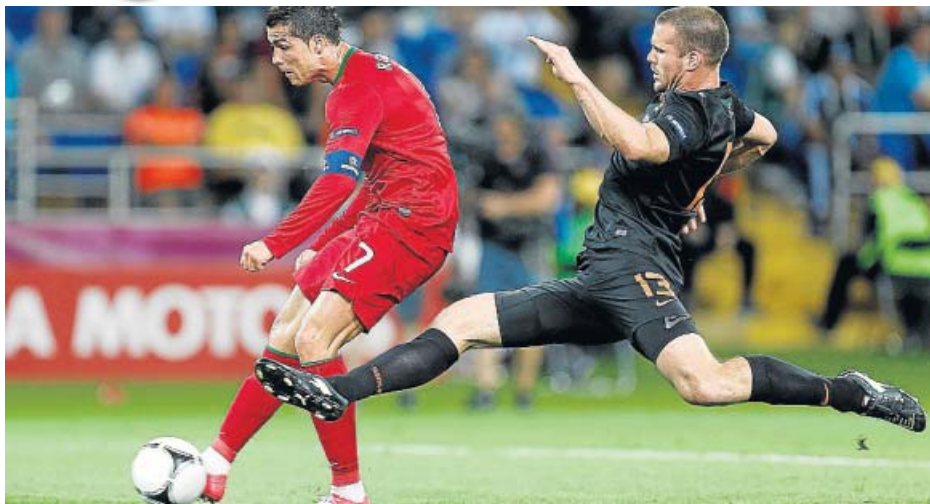
El delantero Cristiano Ronaldo dispara para marcar su primer gol.