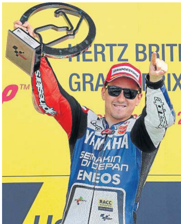
Jorge Lorenzo celebra en el podio su victoria, ayer en Silverstone.

la sexta, el australiano se colocó segundo, cuando Lorenzo ya era cuarto. El piloto balear rebasó entonces a Bautista y a Spies y, a doce giros para el final, superó a Stoner para marcharse en solitario y firmar una victoria incontestable.