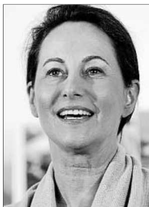
Ségolène Royal.

El triunfo, a pesar del mínimo histórico de participación en esta segunda vuelta de las legislativas (en torno al 56%) per-