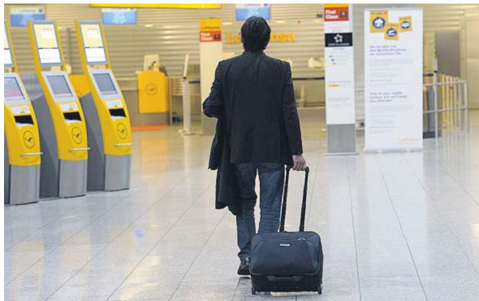
Un viajero en un aeropuerto alemán.

Bruselas plantea que los Estados miembros creen puntos de atención a escala nacional para ofrecer «información, asistencia y asesoramiento a los trabajadores migrantes y a los empleadores para que conozcan mejor sus derechos».