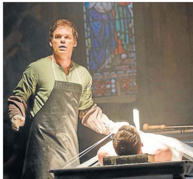
Dexter elevó el concepto de antihéroe a otro nivel.

No menos perturbador resulta Norman Bates, el trastornado personaje de Anthony Perkins en torno al que gira Psicosis . El joven Freddie Highmore recoge el testigo de Antho-