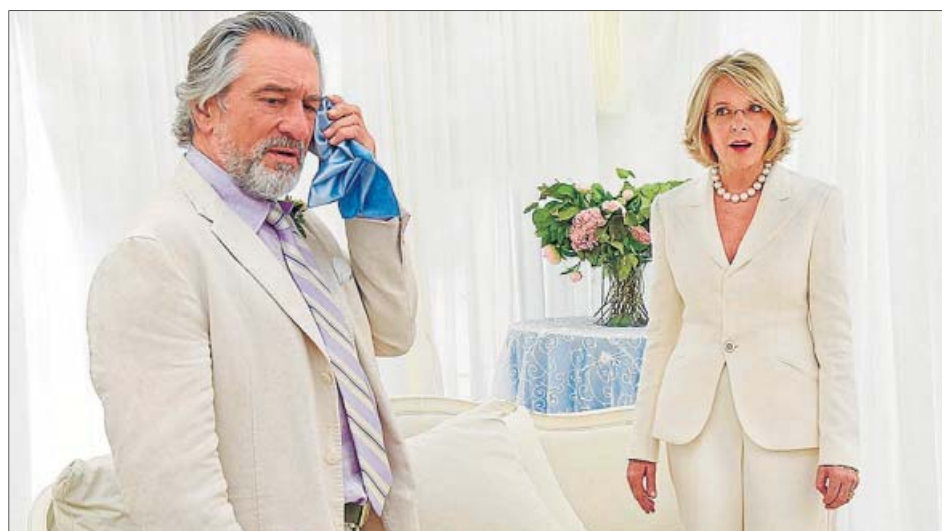
Una escena de La gran boda , con Robert De Niro y Diane Keaton.

saber que Ellie y Don están divorciados, así que deberán aparentar ser un matrimonio feliz. EE UU, 2013. Dir: Justin Zackham. Int: Robert De Niro, Susan Sarandon, Diane Keaton. Dur.: 90 min.