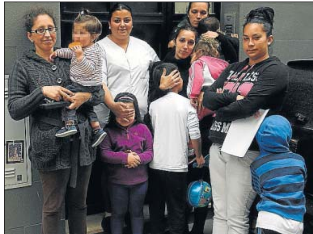
Alguna de las madres, ayer, a las puertas de La Corrala. M.M.

cial —«en este edificio o donde nos lo den»— y detallan que se encontraron «las puertas abiertas y las casas con luz y agua». Relatan que el vecindario los ha acogido bien, pero matizan. «Menos los inquilinos del edificio de enfrente, que dicen que nos van a