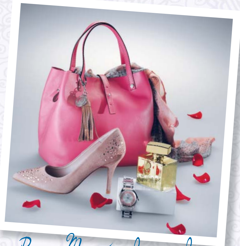
Para Mamás de moda