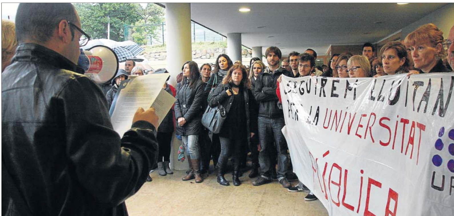
Interinos, profesores asociados y estudiantes, ayer, concentrados a la puerta del edificio Els Til·lers donse se reunió el Consell Social de la UPC.