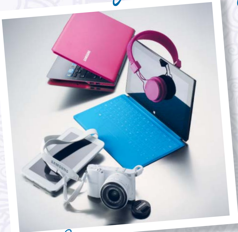
Para Mamás muy actuales