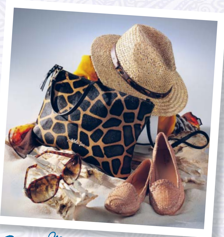
Para Mamás aventureras