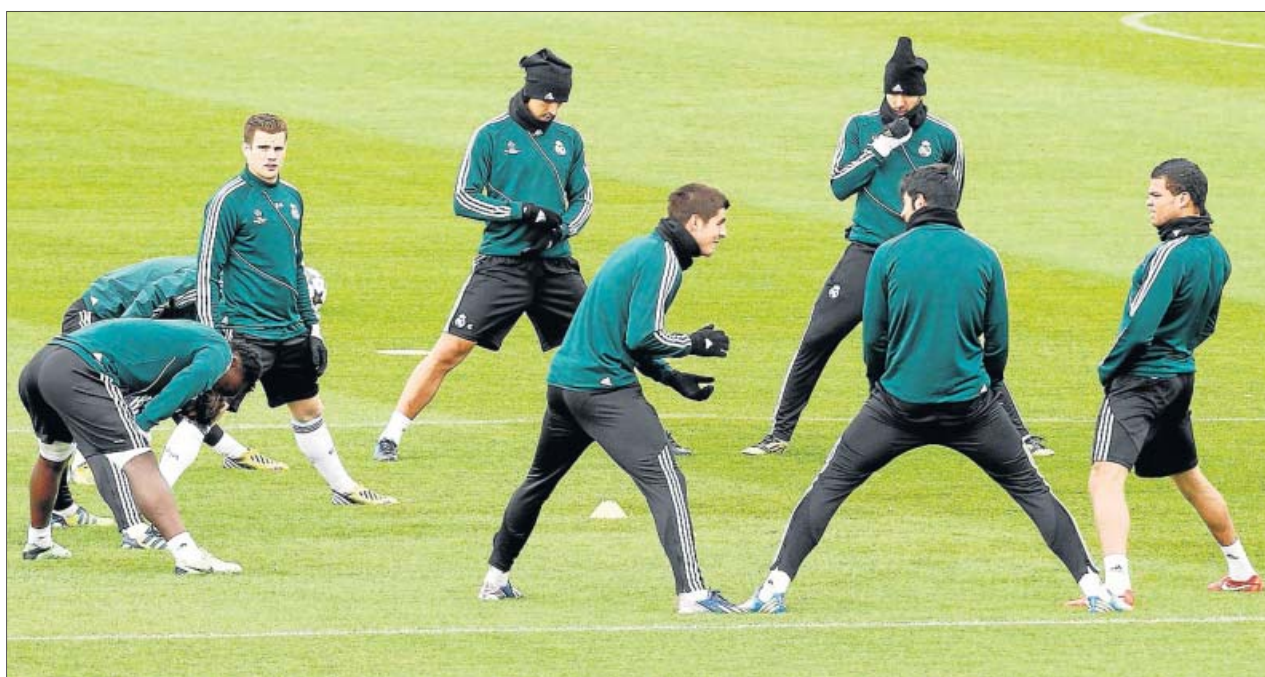
La plantilla del Real Madrid, durante el entrenamiento de ayer en Valdebebas.

La mejor noticia para el Madrid es la presencia de Cristiano Ronaldo, ya recuperado de sus molestias. El portugués liderará al equipo en el Bernabéu y Mourinho corregirá algunos errores de la ida. Di María será titular (en Dortmund no lo fue) y permitirá que Özil juegue por el centro con mayor libertad de movimientos. En defensa, Ramos podrá volver a la posición de central al contar con Essien para el lateral.