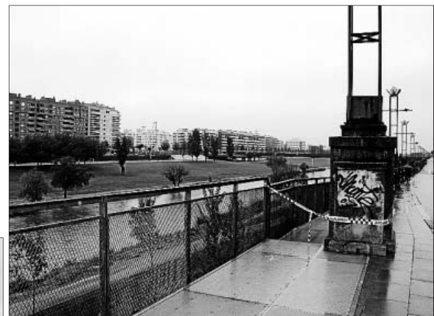
El cel marró de Barcelona (esquerra). A dalt i a baix (dreta), el riu Segre a Lleida i a les comportes.