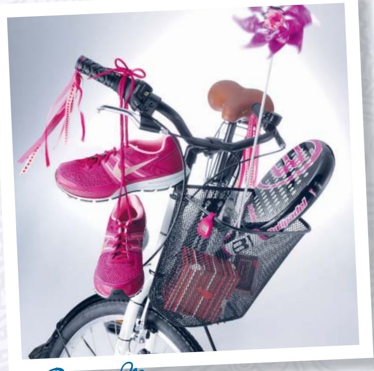
Para Mamás activas