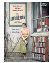
2017. Directora: Isabel Coixet Reparto: Emily Mortimer, Patricia Clarkson, Bill Nighy

Pero esta guerra no es sucia. Aquí no hay violencia ni palabras malsonantes. La batalla se desarrolla con el más estricto y protocolario saber estar británico, en un decorado lleno de telas por el que amabilísimas palabras vuelan como dardos envenenados. El reino por conquistar es un viejo local y los ejércitos, claramente descompensados, son casi invisibles.