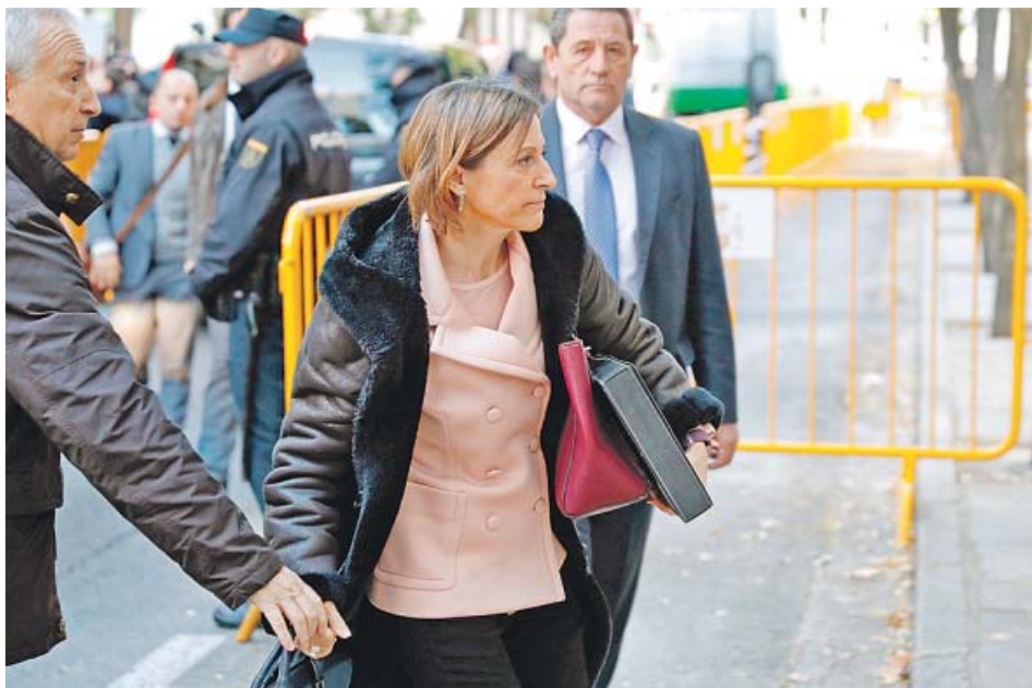
La presidenta del Parlament, Carme Forcadell, a su llegada ayer al Tribunal Supremo.

LA MESA, EN LIBERTAD La Fiscalía pedía prisión para cinco de los seis comparecientes