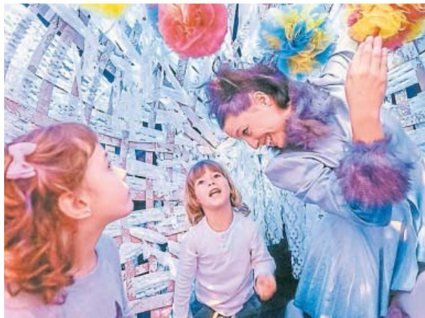
Festival El Més Petit de Tots.