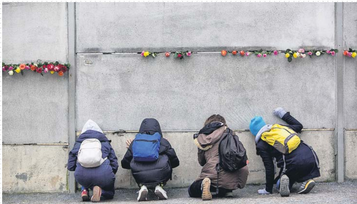
OWEN MESSINGER / EFE