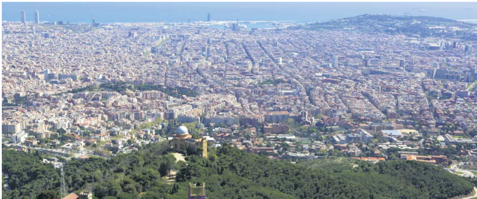
Els dies 13 i 14 de novembre es debatran polítiques d'urbanisme i desenvolupament sostenible en grans metròpolis com Barcelona.