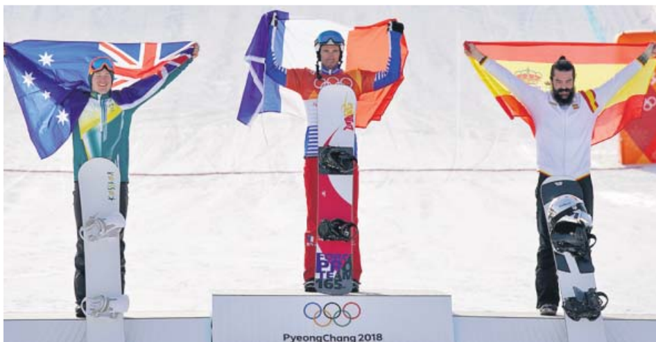
Regino Hernández, con la bandera de España, en el podio olímpico de PyeongChang.

El 'rider' de Ceuta consiguió el bronce en el cross de snowboard de los Juegos Olímpicos de PyeongChang. Es la tercera medalla de España en toda su historia olímpica invernal