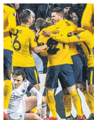
Los jugadores del Atlético celebran un gol.