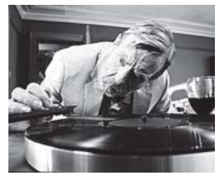
Una historia de humor ácido y giros inesperados.

Janet es una política progresista que acaba de dar un gran