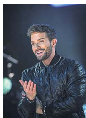
Alborán, ayer, presentando su gira Prometo.