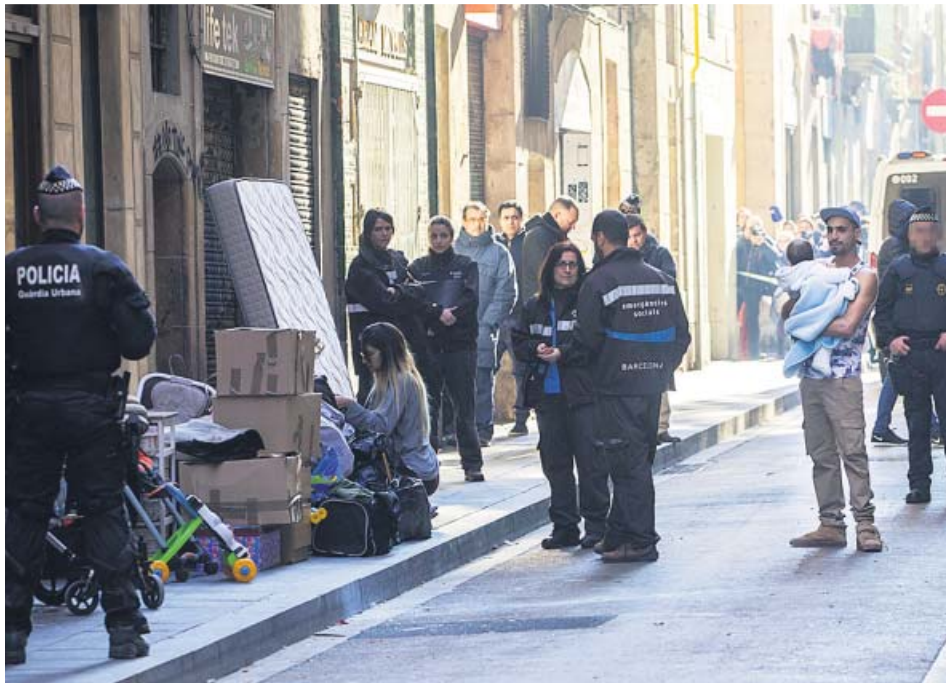
Agentes junto a las personas desalojadas ayer de un edificio propiedad del Ajuntament.

TENÍA 22 HABITANTES, uno de ellos menor. La finca se reformó para beneficiarios de alquiler social