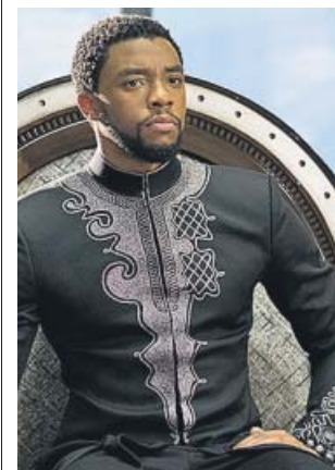
Chadwick Boseman es el héroe Pantera Negra. MARVEL

Tras la muerte de su padre, el príncipe T'Challa vuelve a su tierra para ser nombrado rey de Wakanda, una nación africana