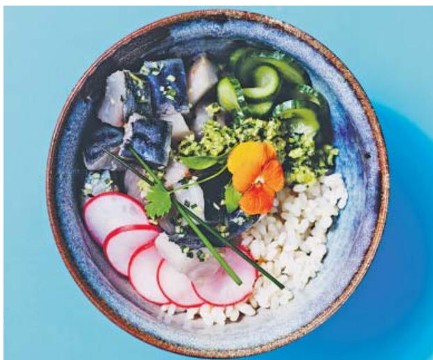
El poké, cuenco inspirado en la gastronomía hawaiana. LUNWERG

Instagram es un hervidero de tendencias ordenadas mediante hashtags , y en el aspecto gastronómico, la etiqueta #bowl se sitúa a la cabeza, con más de dos millones de publicaciones registradas. Comer en cuenco se ha transformado en una moda, y el éxito creciente del concepto ha hecho que hasta tenga sus propios títulos en las estanterías españolas, pero ¿es realmente sano?