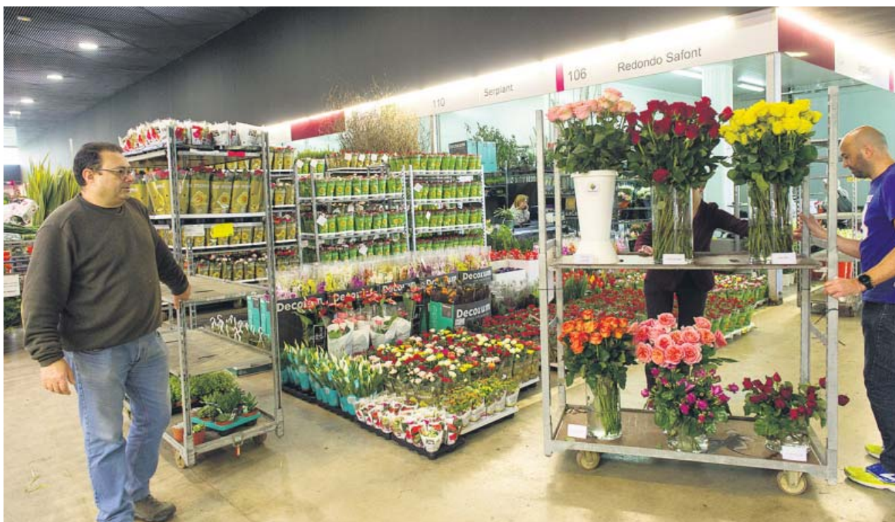
Floristas comprando género en Mercabana, ayer, en previsión de la jornada de Sant Jordi del lunes que viene. MERCABANA

LA ROSA AMARILLA solidaria con los presos soberanistas pasará de 60.000 a 600.000 unidades