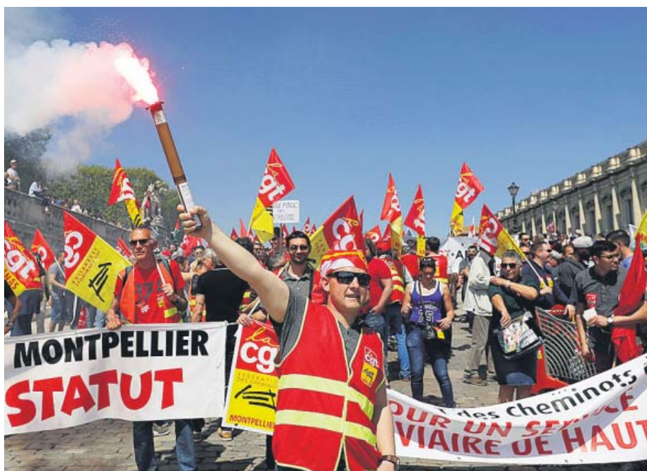
Miembros del CGT se manifiestan contra las reformas del presidente francés.