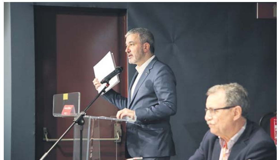
Jaume Collboni, vicepresident de Desenvolupament Social i Econòmic de l'AMB, presenta l'Estratègia per a la reactivació econòmica i la reindustrialització metropolitana de Barcelona.