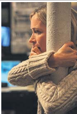
El filme usa el silencio como pilar para el terror.

Convertida en un fenómeno en EE UU, esta película ya es