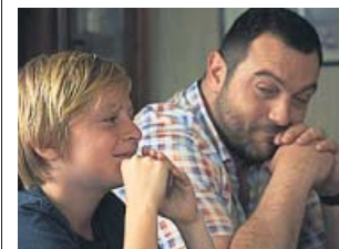
Esta película francesa arrasó en Venecia.

Myriam solicita el divorcio de Antoine para escapar de su comportamiento violento. Cuando pide la custodia de sus hijos para protegerlos de la ira de su marido, el juez decide con-