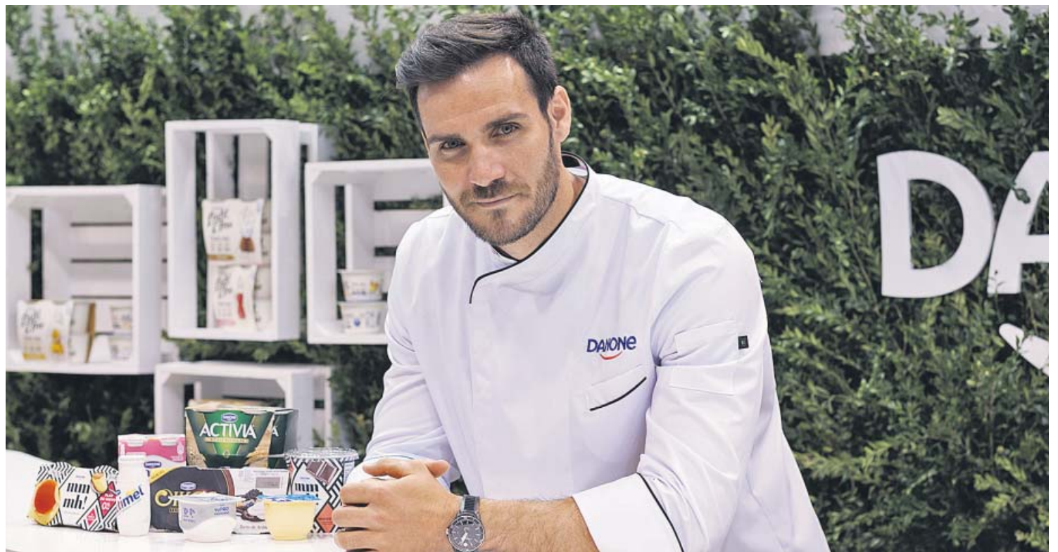
Saúl Craviotto fue el encargado de presentar en un 'showcooking' las novedades de Danone.

Dentro de los estrenos, cobra especial importancia una nueva línea de desnatados, Light & Free, gama de productos triple cero: 0% materia grasa, 0% azúca-