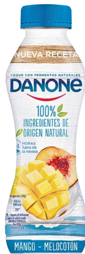
EL YOGUR BEBIBLE MÁS NATURAL Danone saca al mercado cinco variedades de yogur líquido sin conservantes ni aromas artificiales.

La oferta incluye, entre otros productos, un formato de 500 gramos ideal para combinar con frutas, semillas y cereales en el desayuno. Está disponible en tres variedades: sabor natural, con avena y con coco. También llega a las estanterías del supermercado un formato de 125 gramos que combina el sabor natural con distintas variedades de fruta: arándanos y frutos rojos; naranja, lima y limón; y melocotón, piña y maracuyá. Completan la oferta una gama de postres con vainilla y chocolate negro.