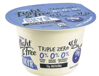
ENTRE EL YOGUR Y EL QUESO El primer Skyr de Danone, dentro de la gama triple cero, estará disponible en dos sabores.