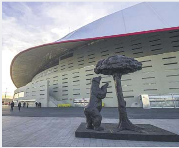
ATLETICO DE MADRID

Unos 3.200 efectivos formarán el amplio dispositivo de seguridad, uno de los mayores de los últimos años, previsto para la final de Copa en el Wanda Metropolitano, y que contará con medidas adicionales como la prohibición de que circulen camiones por las inmediaciones del estadio. Se prevé la asistencia de 66.500 personas y se recomienda acudir al campo con antelación para pasar los exhaustivos controles.