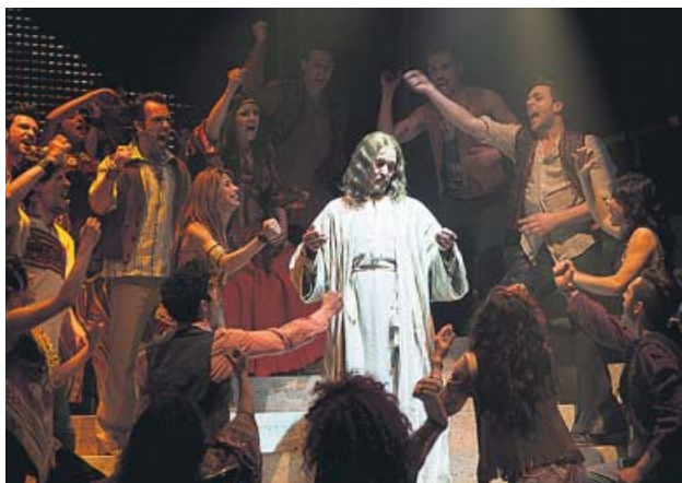
Momento de la superproducción musical. CHIEREGATO