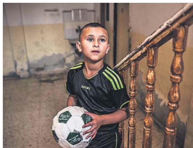
En la fotografía superior, una imagen de Etiopía y sobre estas líneas un niño palestino con una pelota.