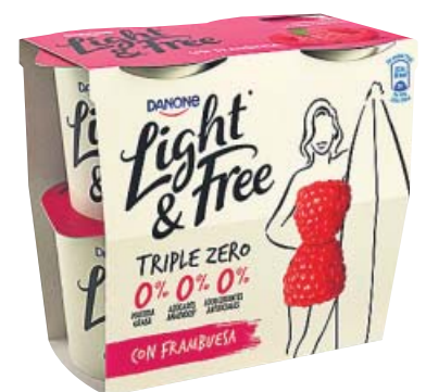
LIBRE DE AZÚCARES Y GRASA La gama Light & Free triple cero, con 0% materia grasa, 0% azúcares añadidos y 0% edulcorantes.