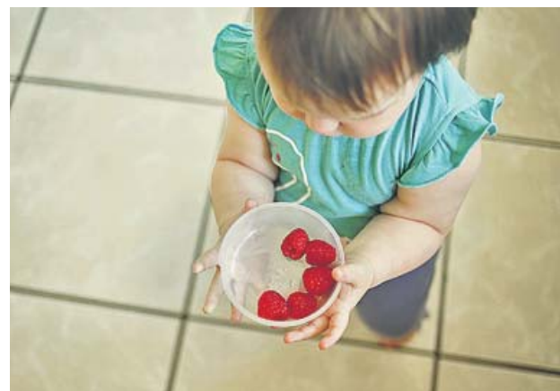
La educación alimentaria es vital en las etapas tempranas.