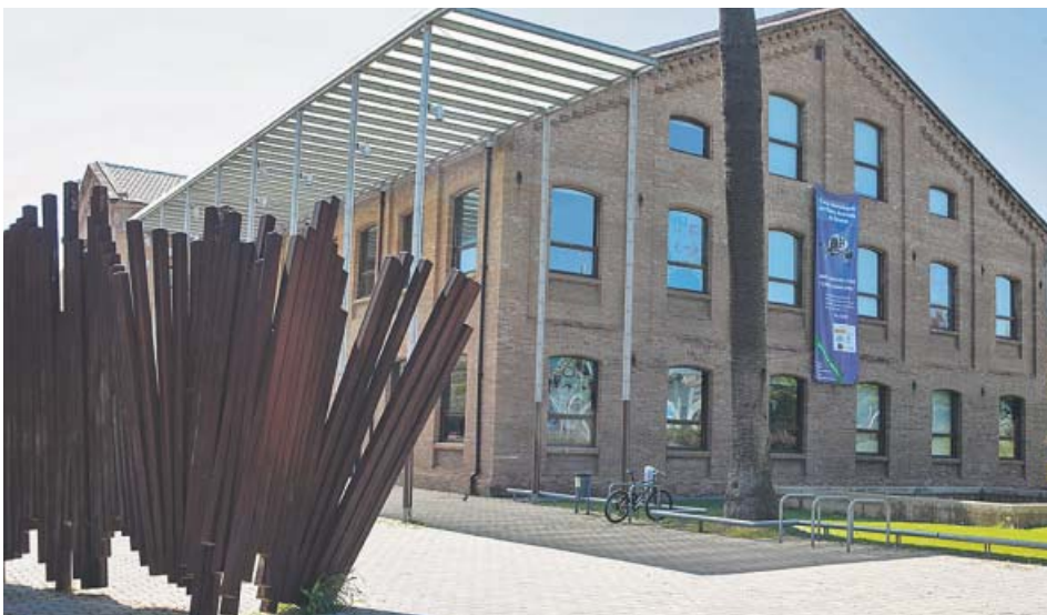
L'AMB promou la creació dels Fablabs, centres d'innovació tecnològica, com el Citilab de Cornellà de Llobregat.