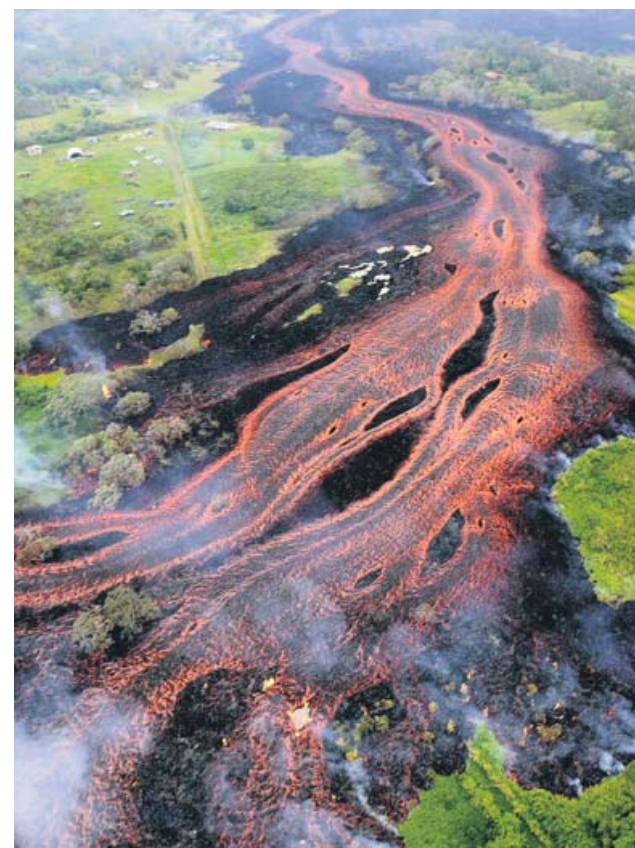
OBSEVATORIO DE VOLCANES DE HAWAII