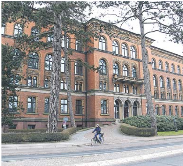
La seu de la fiscalia general de Schleswig-Holstein i del Tribunal Superior.

I. SERRANO isabel.serrano@20minutos.es / @isabelserrano2