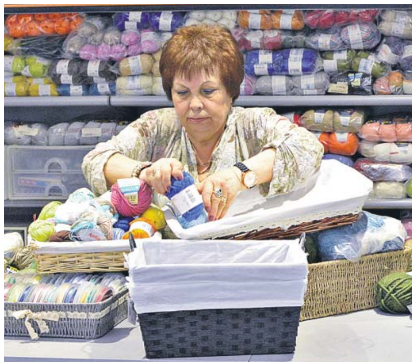
Algunes de les parades de roba i alimentació que ahir ultimaven els darrers preparatius per a l'obertura d'avui. MARINA LOPERENA

El Mercat de Sant Antoni obre avui per fi les seves portes al gran públic després d'una profunda reforma de 9 anys de durada. El mercat llueix avui els 235 establiments que acull, entre ells 52 d'alimentació, 105 dels Encants i 78 parades del mercat de diumenge. El pròxim cap de setmana se celebra una gran festa ciutadana d'inauguració, que programarà dissabte i diumenge 30 activitats per a tots els públics repartides pels tres espais dels voltants del nou mercat: el del carrer Tamarit, l'espai Fossat i la superilla de Sant Antoni. ● R. B.