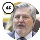
ÍÑIGO MÉNDEZ DE VIGO Ministro de Educación

«El sistema es sostenible. Los tiempos difíciles han quedado atrás y vamos a presentar reformas»