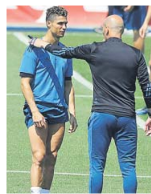
Zidane y Cristiano, en el entrenamiento.

Otro peso pesado del vestuario blanco, Cristiano Ronaldo,