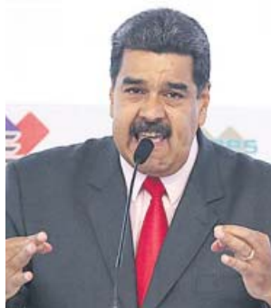
Nicolás Maduro, ayer, en su discurso de proclamación.

La UE cuestionó así estos comicios en los que fue reelegido Nicolás Maduro como jefe de Estado, marcados por una abstención cercana al 54%, y anunció la posibilidad de estudiar sanciones, una posibilidad que ya había platea-