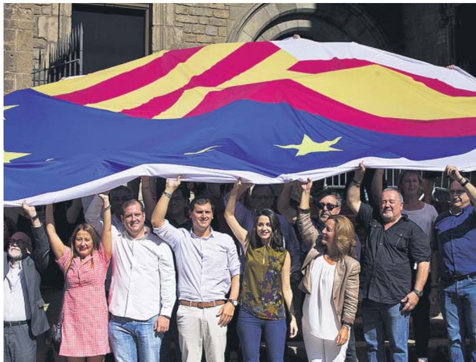
El líder de Cs, Albert Rivera, y su dirigente en Cataluña, Inés Arrimadas, ayer.

Ciudadanos no participó ayer de los actos institucionales de la Diada en Cataluña y organizó uno paralelo en la plaza del Rei de Barcelona. Allí, su líder, Albert Rivera, avisó al presidente del Gobierno, Pedro Sánchez, de que el president de la Generalitat, Quim Torra, «no es un aliado sino un rival político». Y aseguró que «los aliados somos los que, desde la discrepancia política, compartimos valores democráticos». Lamentó que los nacionalistas hayan convertido la Diada «en una jornada de odio y ataque a España». ● R. B.