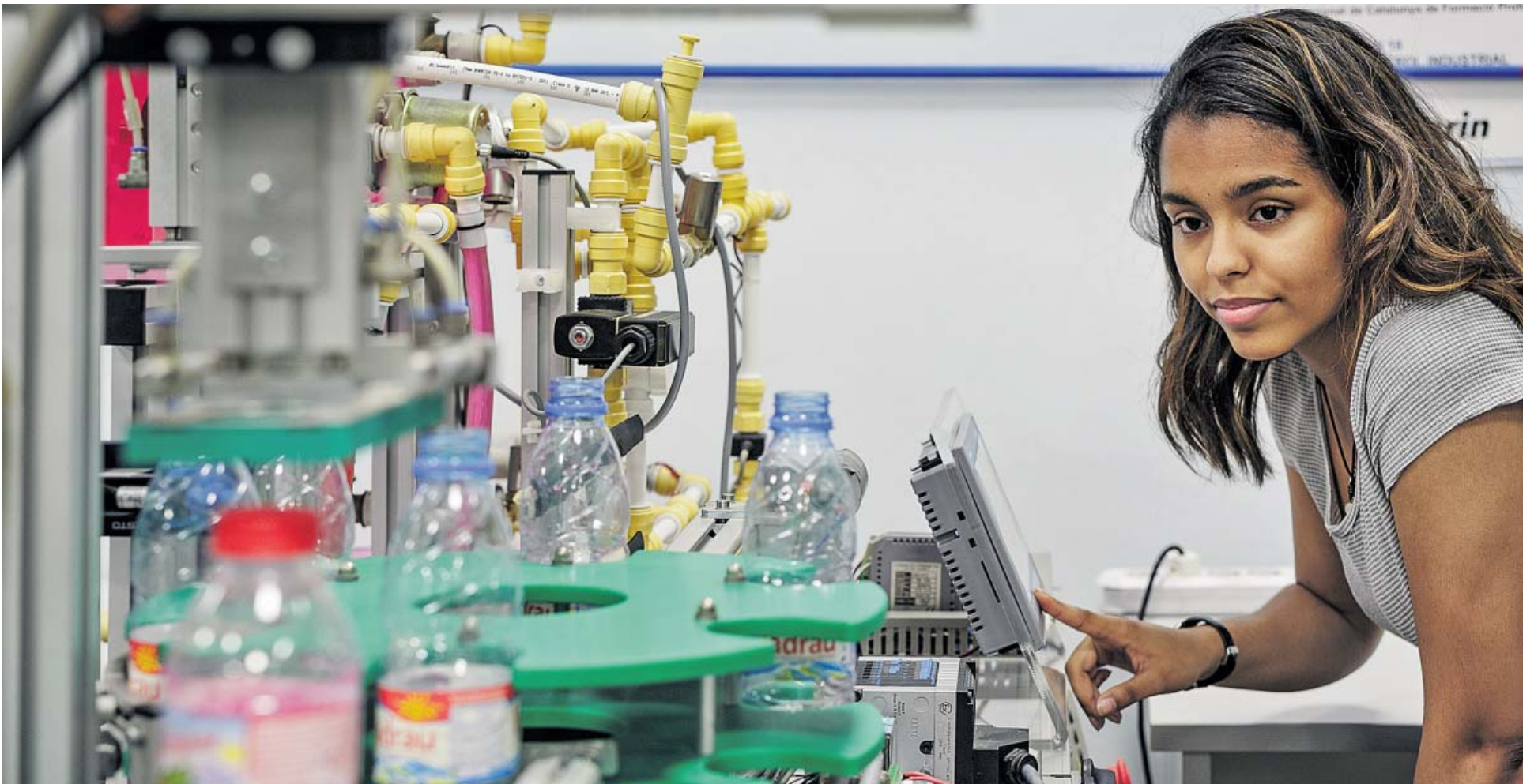
El Programa STEAM pretén impulsar les vocacions científiques i tecnològiques en els estudiants catalans.

ES VOL augmentar la presència de dones i d'alumnat socialment desafavorit en aquestes àrees