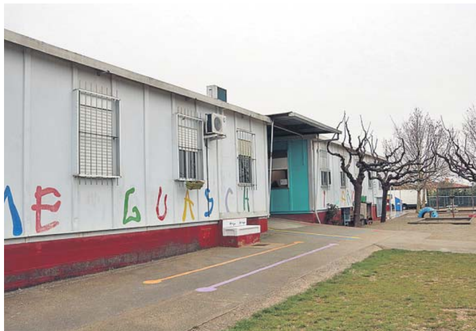
Escola Carme Guasch de Figueres (Girona) que opera en barracons, el curs passat.

El conseller Josep Bargalló ho va atribuir als retards provocats «per l'aplicació de l'article 155 i a les pluges de l'estiu». Durant la parada escolar de juliol i agost s'han portat a terme 369 actuacions de millora als centres per valor de