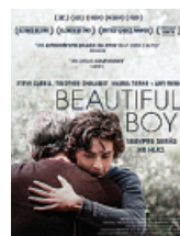
2018. Director F. Van Groeningen Reparto Steve Carell, Timothée Chalamet, Maura Tierney

Frente a sus ojos azules, los de Timothée Chalamet (lejos queda ese Elio que lo catapultó a la fama en Call Me by Your Name ), huidizos, frágiles, ciegos tras un flequillo largo y despeinado, en gran parte avergonzados por la