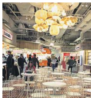
Así es el nuevo Mercado Little Spain.

«[Queremos] vender España a través de su cultura» y «mostrar nuestra manera de vivir», puntualiza Adrià, que junto con José Andrés se encuentra en Nueva York para asegurarse de que todo esté a punto antes de la apertura.