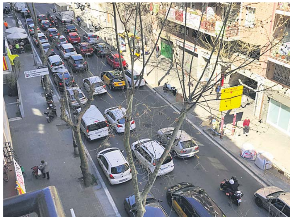
Imatge del carrer Independència a l'alçada d'Aragó, amb quatre carrils de circulació.

A partir del dia 24 de març, el carrer Independència reduirà de quatre a tres els carrils de circulació. La comissió d'Urbanisme de l'Ajuntament va aprovar ahir per unanimitat una proposta del PSC que urgeix al govern municipal a mesurar els nivells de contaminació i de soroll i a prendre mesures urgents. Tal com va avançar 20minutos , els veïns han denunciat que el carrer Independència ha augmentat el trànsit i la contaminació al mateix ritme que les obres de Glòries i de Meridiana. ●I.S.