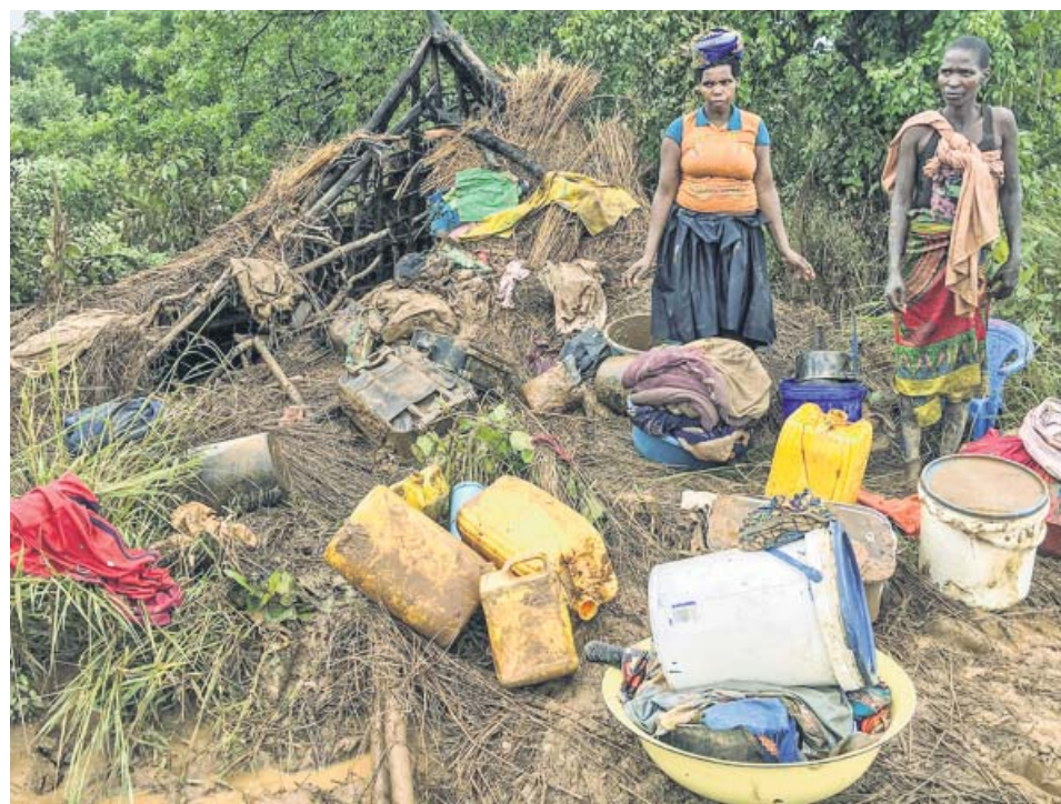
Varias personas amontonan sus pertenencias en una zona inundada en Mozambique.