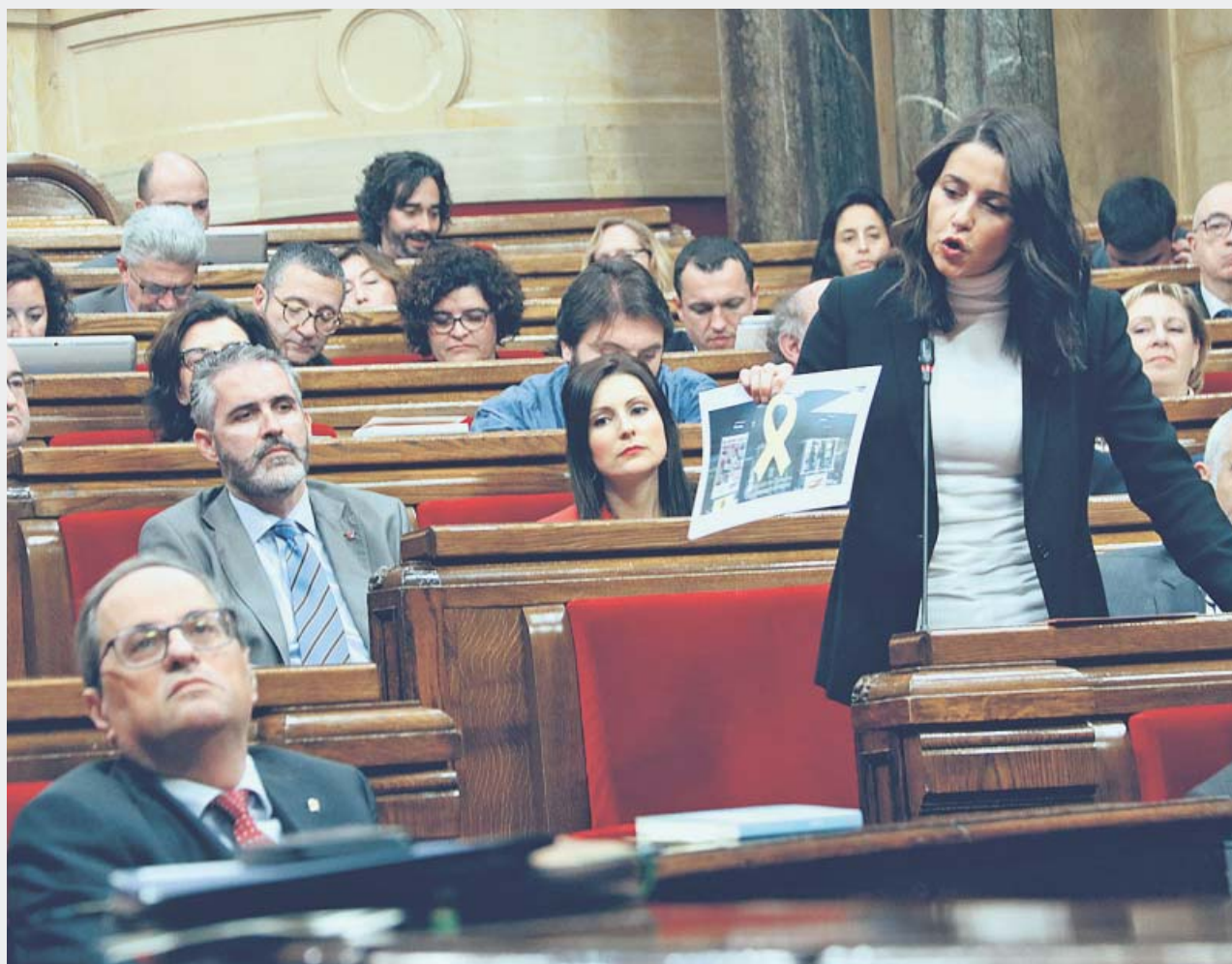
La líder de Cs, Inés Arrimadas, enseñó un cartel con un lazo amarillo al president Torra, ayer, en el pleno del Parlament.