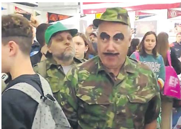
Una captura d'un vídeo de la protesta contra l'Exèrcit.