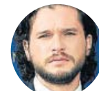
KIT HARINGTON El actor, sobre la fama por Juego de Tronos en Variety

«Empecé a ir a terapia y a hablar con la gente. Me sentía muy inseguro, pero no se lo contaba a nadie»