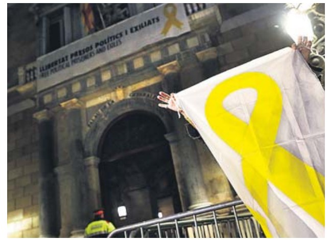
Una persona despliega un lazo frente a la Generalitat, ayer.

El Ejecutivo insistió en que está a disposición de lo que diga la JEC cuando tome hoy una decisión, rechazando así actuar de oficio. Por ejemplo, enviando a Torra a la Fiscalía, como le reclaman PP y Ciudadanos. El ministro de Interior, Grande-Marlaska, recordó que en periodo electoral es la JEC la que tiene competencias y lo contrario sería «extralimitarse». ●