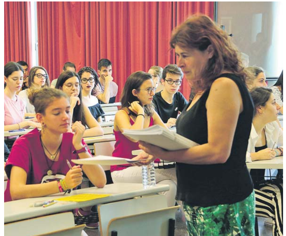
Imatge d'una professora repartint els exàmens de la Prova d'Accés a la Universitat.

En la fase específica, que poden fer tant els alumnes de batxillerat com els procedents de cicles formatius de grau superior, els estudiants poden examinar-se de fins a tres matèries de modalitat entre 22 assignatures. Les matèries comunes d'opció també poden ser objecte d'exa-