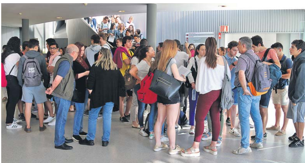
Un grup d'estudiants espera per entrar a fer la Proves d'Accés a la Universitat.

Tota la informació sobre l'accés a la universitat la podeu consultar al Canal Universitats: universitats.gencat.cat