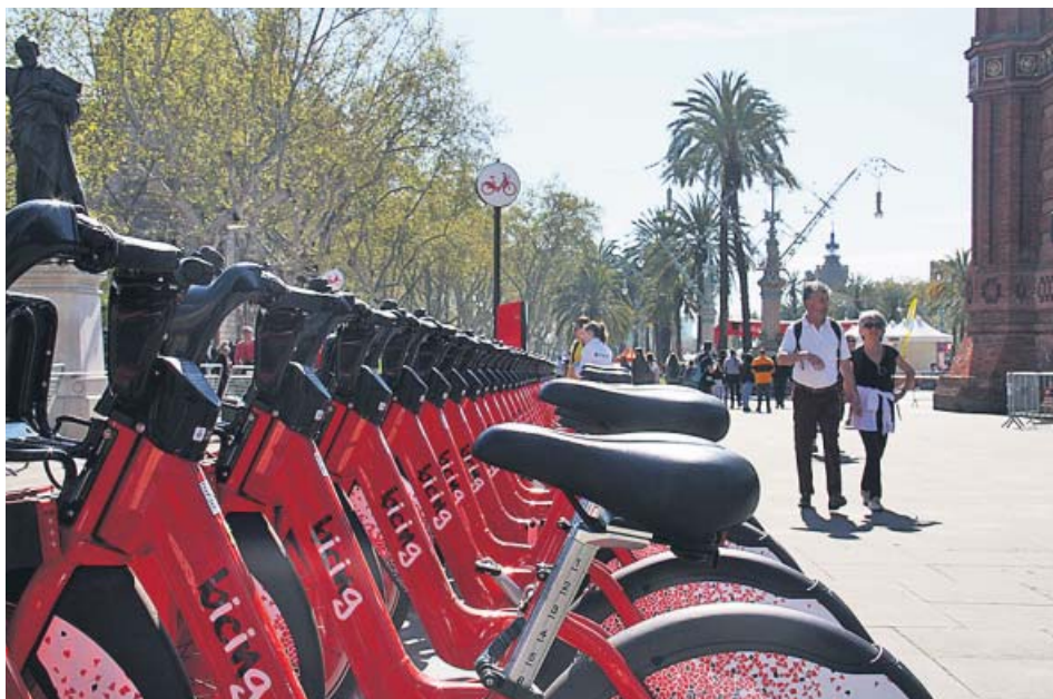
Bicicletes del nou servei de Bicing de Barcelona al Passeig Lluís Companys.