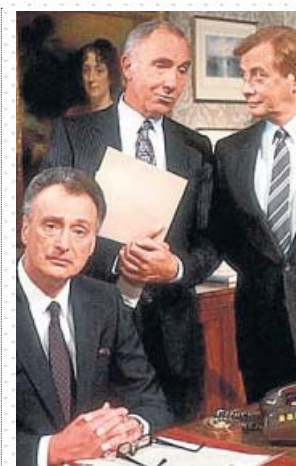
Los protagonistas de la serie Sí, ministro .

Tal vez por eso, Sí, ministro fue un éxito rotundo: aclamada como una de las mejores comedias británicas de la historia, la serie generó una