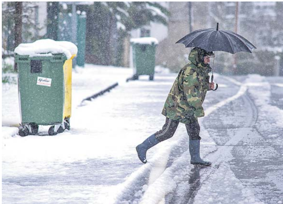
Una mujer camina por una calle nevada en Vendas da Barreira (Riós) en Orense.

Las lluvias y el frío invernal que se instalaron en la Península el pasado viernes seguirán, al menos, hasta Semana Santa, según la predicción de la Agencia Estatal de Meteorología (Aemet) para los próximos días. Aunque los termómetros y la cota de nieve subirán paulatinamente, una sucesión de borrascas seguirá dejando lluvias en casi toda España durante la próxima semana. En Semana Santa, aunque aún hay mucha incertidumbre, se espera más calor y menos lluvia de lo habitual. ●