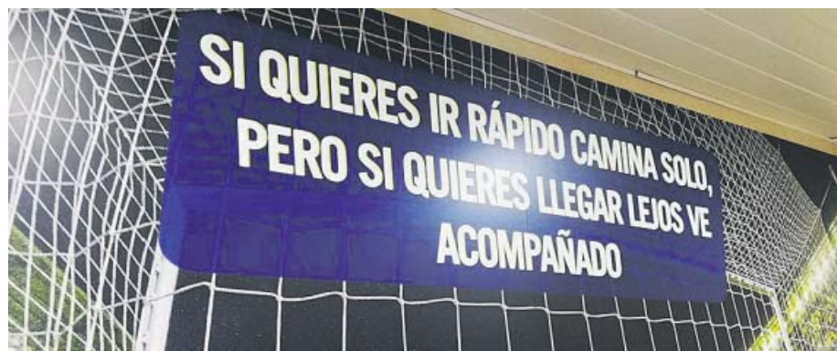
Los campos de Getafe, Leganés, Betis y Villarreal, sembrados de frases motivadoras.