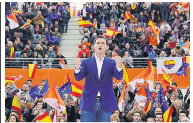
Albert Rivera, ayer, en un acto de Cs en Las Rozas (Madrid).

También, citó un nuevo estatuto de los trabajadores, el blindaje en la Constitución de la revalorización de las pensiones, la protección del sistema sanitario, el aumento del número de viviendas sociales o la derogación la ley de protección de la seguridad ciudadana. «Lo que hemos hecho durante diez meses es nuestra mejor tarjeta de visita», afirmó. ●