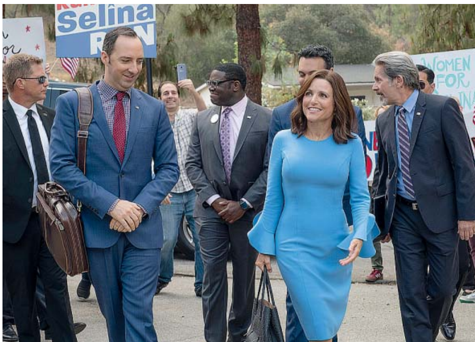
La expresidenta Meyer (Louis-Dreyfus) y Gary (Tony Hale), su asistente personal.