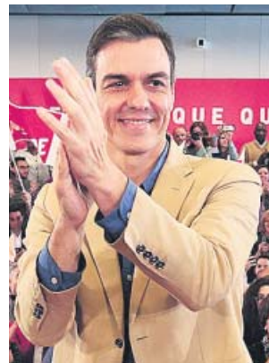
Sánchez, ayer, durante su acto en Zaragoza.

A renglón seguido, aseguró que «hay un riesgo real de que la derecha y sus tres siglas sumen una mayoría parlamentaria» y de que repitan el esquema de pacto de Andalucía. Así, defendió que el PSOE es «el único partido que puede sumar más». «Si nos movilizamos, no van a frenar esta ola de ilusión y esperanza», abundó.