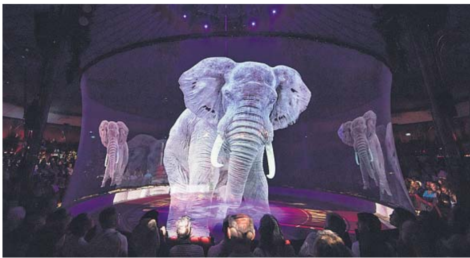
Imagen holográfica de un elefante en una representación del Circus Roncalli. CIRCUS RONCALLI