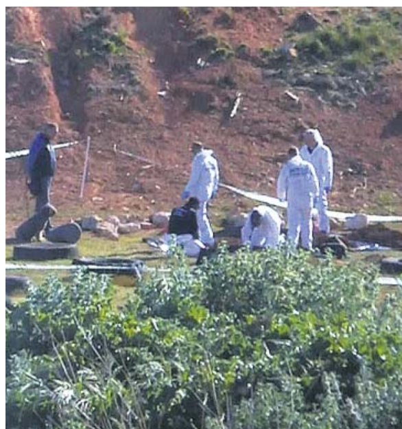
La Policía Científica investiga el lugar donde fue hallado el cuerpo. El presunto autor, detenido.