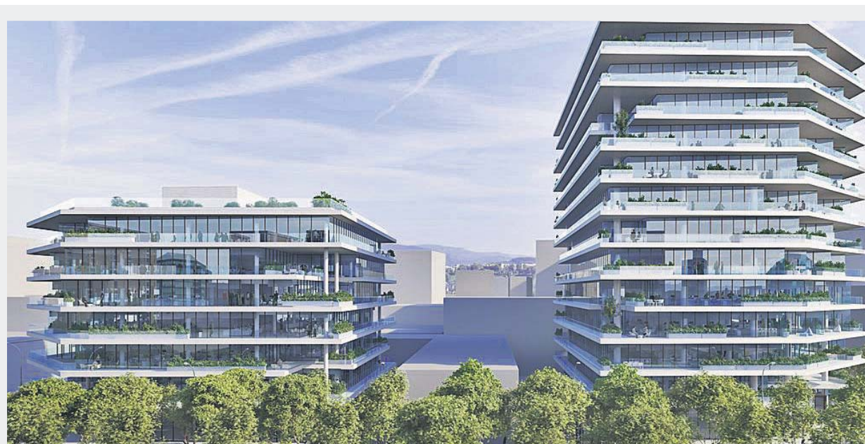
El edificio que se levantará en el número 213 de la avenida d'Icària y al que se trasladarán 2.900 personas. EVERIS