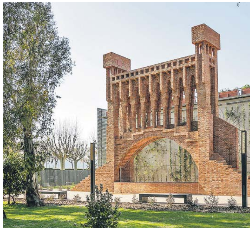
La cascada de Antoni Gaudí reproducida en el Museu de les Aigües.

Para ayudar a la población a comer más sano, Monereo insta a realizar grandes acciones como «bajar el IVA» al pan integral o reducir el precio de la fruta y verdura. «Los sectores más deprimidos suelen tener peores hábitos de alimentación, pero también altos cargos con poco tiempo. Además, los jóvenes no saben guisar porque no se ha transmitido esa cultura, e ir a la compra y planificar las comidas ocupa mucho tiempo», indica la endocrina del Gregorio Marañón. ●