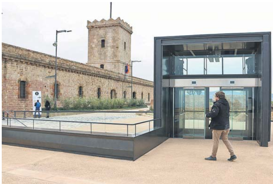
Imatge de l'entrada i porta d'accés al Castell de Montjuïc.

El primer tinent d'alcalde de l'Ajuntament de Barcelona, Gerardo Pisarello, va afirmar ahir que amb el desallotjament d'Amics del Castell «acabem amb una anomalia a la ciutat i culminem el procés iniciat per l'ajuntament en 2015» que pretén «recuperar espais per a usos ciutadans i l'eliminació de distincions i reconeixements concedits pel franquisme». Segons Pisarello, l'associació «no ha pretès