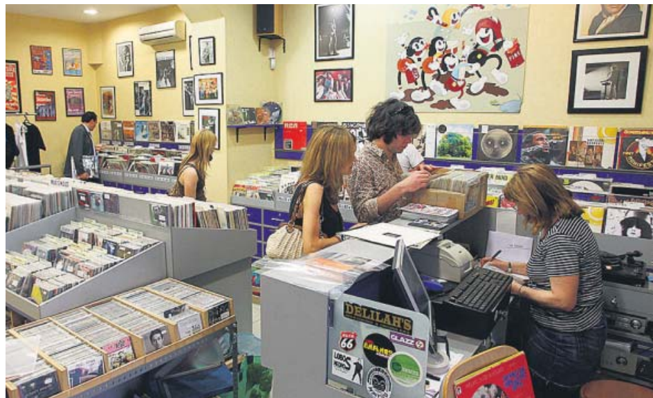
Interior de Escridiscos, una de las tiendas madrileñas que participan en la iniciativa.

Al RSD se han sumado tiendas de toda España. En Barcelona, Daily Records ofrecerá un vermut; Revólver, el concierto de The Wax (18.00 h); BCore, pinchadas de 11.30 h a 19.00 h; y habrá actuaciones y DJ desde la mañana al cierre en Decibel, Disco 100, Ultra-Local Records y El Genio Equivocado - La Botiga. Otras localidades catalanas como Girona, Lleida, Reus, Sabadell, Tarragona, Terrasa y Tortosa también festejan el Record Store Day 2019.