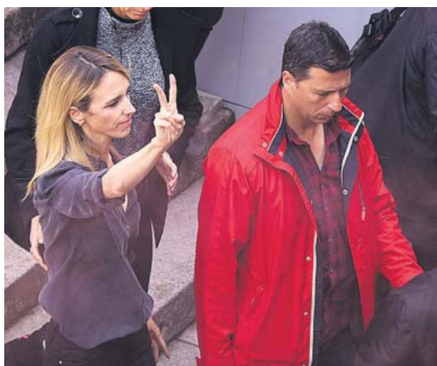
Cayetana Álvarez de Toledo, ayer, en la Autónoma.

Álvarez de Toledo definió como «niñatos totalitarios, pijos y subvencionados» a los estudiantes que intentaron impedir su acceso al coloquio y denunció que ese tipo de situaciones son habituales en la Autónoma: «Representan el secuestro de la universidad, pero no vamos a ceder un solo milímetro en defensa de la libertad». ●