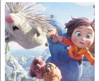
Subidón de adrenalina con June y sus amigos.

Esta producción española cuenta las aventuras de June, una niña con una imaginación desbordante que crea un parque de