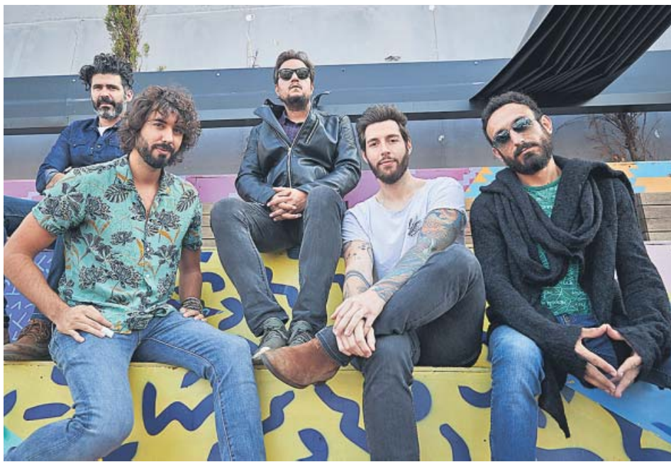
Mikel Izal (a la izquierda, con camisa estampada) y el resto de la banda Izal.