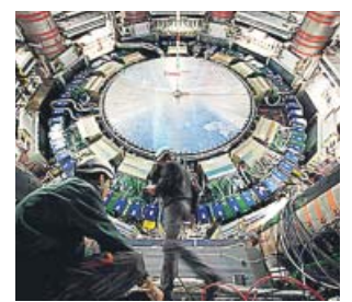
Laboratori Europeu de Física de Partícules. CCCB

El recorregut descobreix al visitant «un món invisible» en copsar, mitjançant l'art, qüestions que no es poden percebre pels sentits, explica la comissària de l'exhibició, Mónica Bello. Alguns dels autors de les projeccions, dibuixos, instal·lacions o escultures que es poden veure a