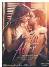
2019. Directora Jenny Gage Reparto Josephine Langford y Hero Fiennes-Tiffin

erotismo. Tanto en el texto original como en esta versión cinematográfica hay algo de pornografía suave. Voz dubitativa de narradora en off , fotografía llena de luz, colores pastel, cortinas enormes, bañera con espuma y respiraciones a gran volumen mientras suena Taylor Swift. Verse no se ve casi nada y todo tarda en llegar, pero se entiende, sin duda, el atractivo para la chavalada: el relato resulta una primaria guía iniciática hacia la madurez sexual y la pérdida de la virginidad.