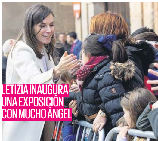
LETIZIA INAUGURA UNA EXPOSICIÓN CON MUCHO ÁNGEL

La reina acudió ayer a Lerma (Burgos) con motivo de la exposición Angeli, organizada por la Fundación Las Edades del Hombre y que persigue difundir el arte sacro en Castilla y León. PÁGINA 22