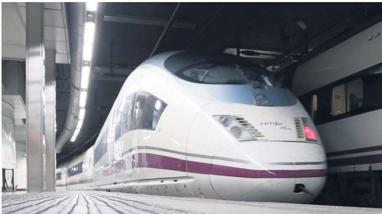
Un AVE saliendo de la estación de Sants de Barcelona en dirección a la de Atocha, en Madrid.