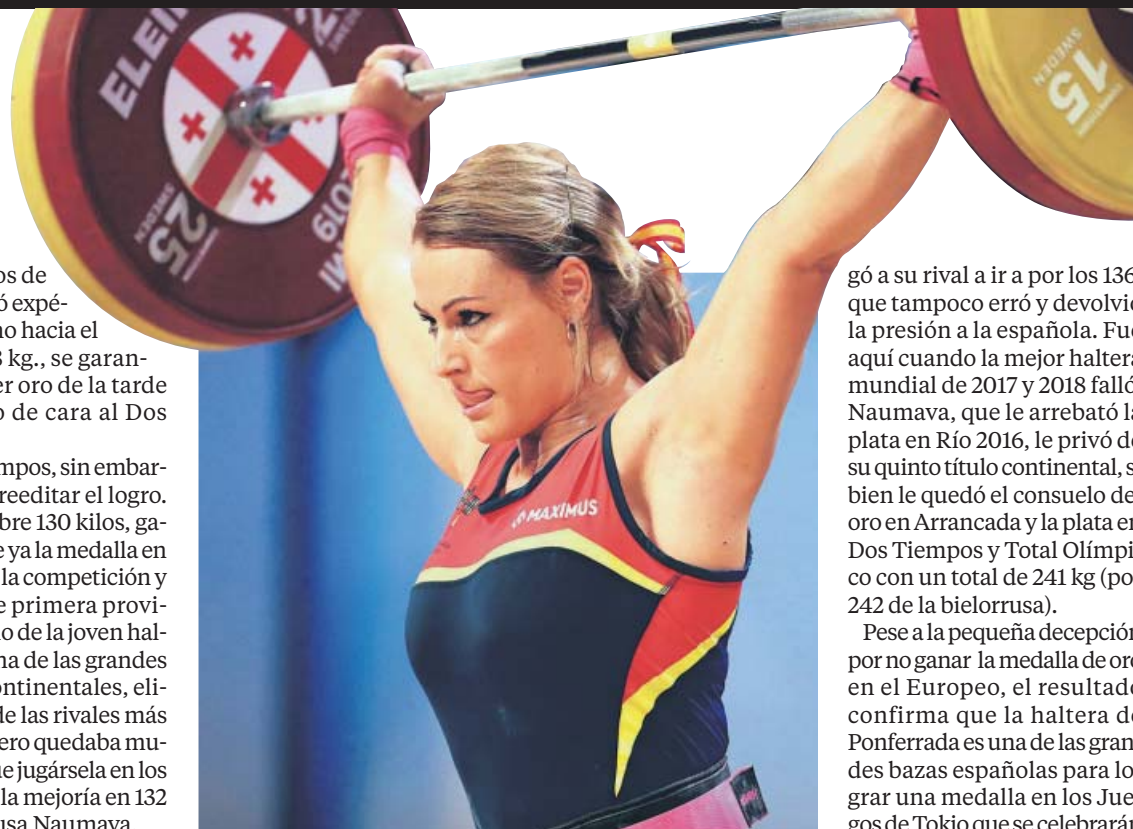
La berciana durante el torneo continental.