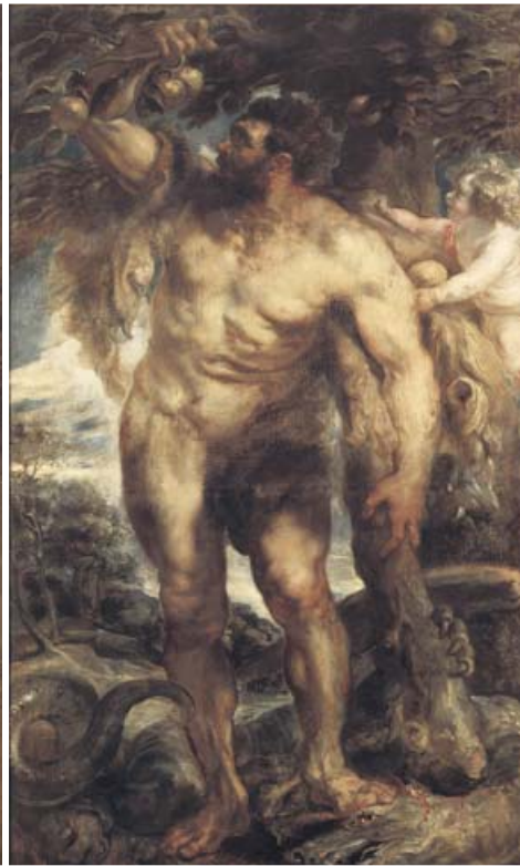
Deyanira tentada por la Furia y Hércules en el jardín de las Hespérides (c. 1638), de Rubens, provienen de los Museos Reales-Galería Sabauda de Turín.