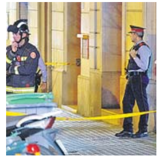
Parte del operativo desplegado.

Los agentes fueron alertados a través de una llamada, en la que se aseguraba que el hombre estaba «muy agitado». Para facilitar la labor de los negociadores, los Mossos cortaron la travesía del portal, tras desalojar a algunos veci-