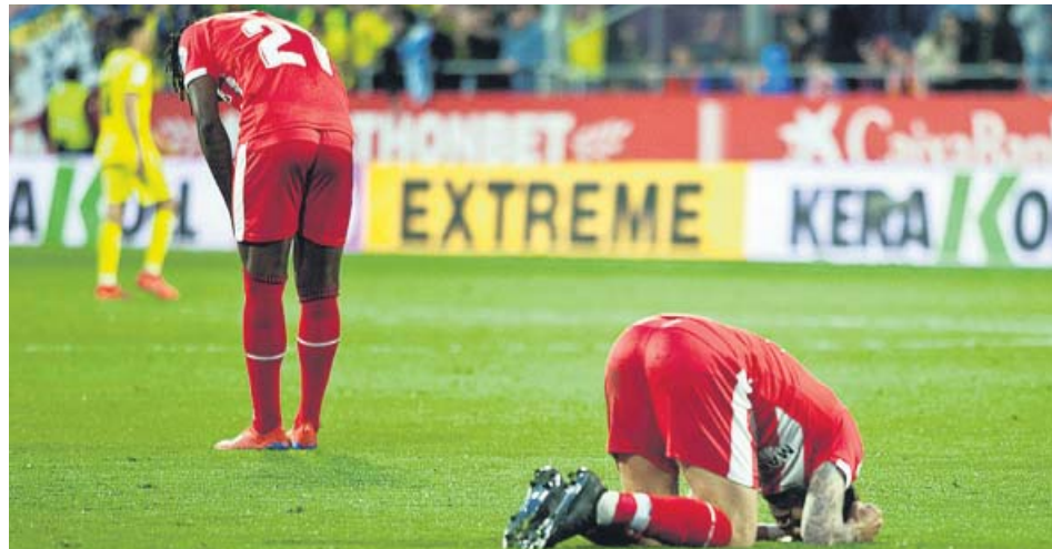
Decepción de los jugadores del Girona en Motilivi.

SAMU El nigeriano del Villarreal marcó en el minuto 7 y puso el partido cuesta arriba a los de Eusebio CRISIS Los catalanes se quedan a solo tres puntos de los puestos de descenso