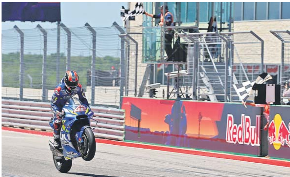
El piloto español Alex Rins celebra la victoria en el Gran Premio de las Américas.

EL DE HONDA abandonó cuando iba líder de la prueba y el de Suzuki consigue su primera victoria en la máxima cilindrada EL CAMPEONATO DE MOTOGP vuelve a empezar después de tres carreras: Marc pierde el liderato en favor de Dovizioso