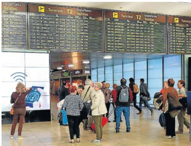
La Terminal 2 del aeropuerto de Barajas, el viernes.

Las convocatorias de huelga en el sector aéreo y ferroviario empezaron el viernes y se prolongarán hasta el próximo día 28