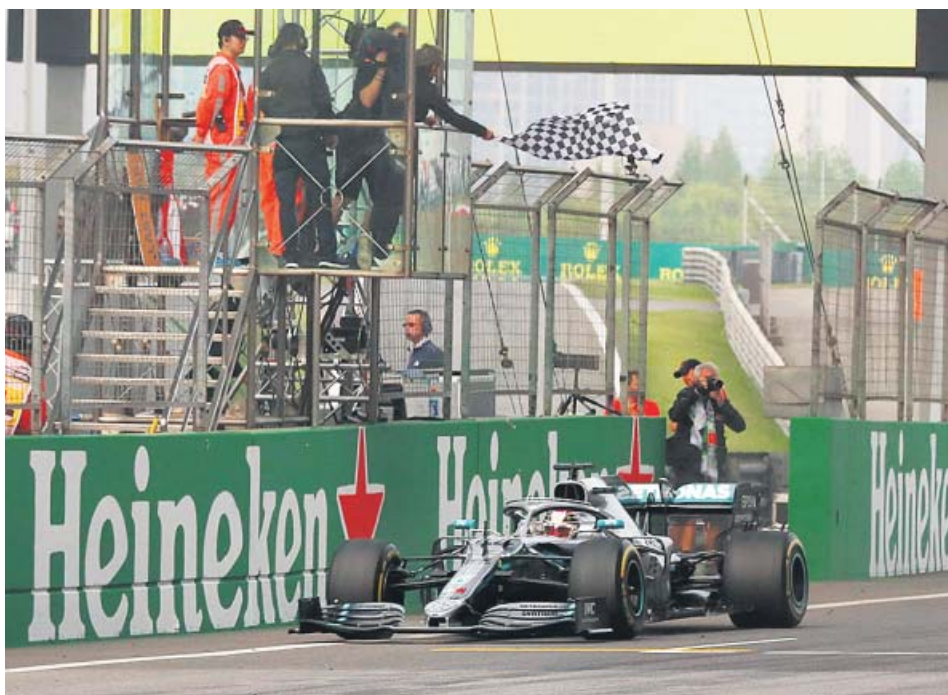
El Mercedes de Lewis Hamilton cruza la meta del GP de China en primera posición.