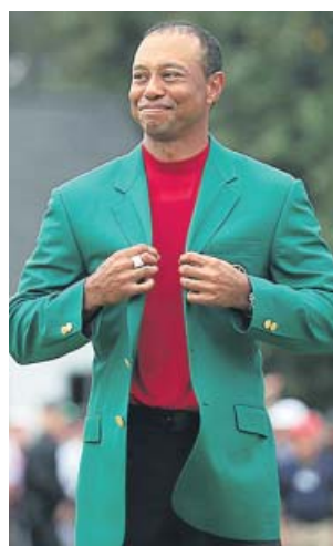
Tiger Woods, ganador del Masters de Augusta.

El vizcaíno Jon Rahm, número 8 del mundo, terminó entre los diez primeros clasificados. «He estado más cerca de lo que pensaba que iba a estar», dijo. ●