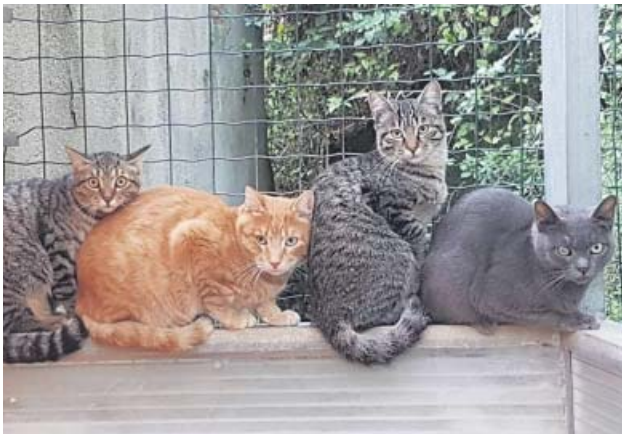
Miembros de una colonia de gatos controlada. AJUNTAMENT DE BARCELONA

Es la cantidad que abarca el Ajuntament. Con la ayuda de entidades, se llega a 1.200. El objetivo es evitar la sobrepoblación