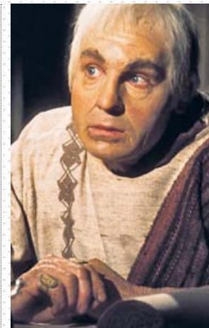
El actor Derek Jacobi protagonizó la serie.

Hablamos de John Hurt como un Calígula desafiante (si algún momento del show te hace apartar la mirada de puro asco, se deberá a él) y de Siân Phillips, actriz de discreta trayectoria en cine y televisión que triunfa aquí como Livia, una de esas malas malísimas que se ganan nuestra complicidad siendo perversas a la par que eficientes.