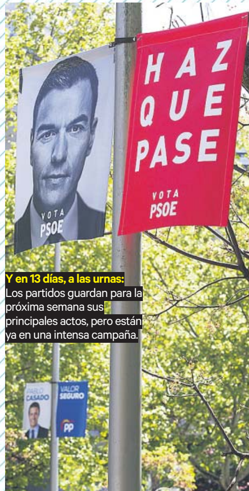
Y en 13 días, a las urnas: Los partidos guardan para la próxima semana sus principales actos, pero están ya en una intensa campaña.