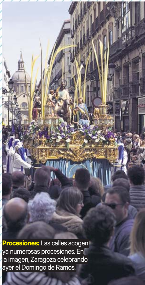
Procesiones: Las calles acogen ya numerosas procesiones. En la imagen, Zaragoza celebrando ayer el Domingo de Ramos.