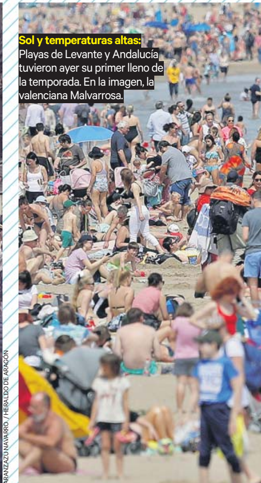
Sol y temperaturas altas: Playas de Levante y Andalucía tuvieron ayer su primer lleno de la temporada. En la imagen, la valenciana Malvarrosa.