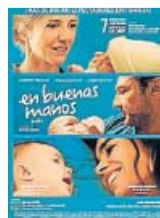
2019. Directora Jeanne Herry Reparto Sandrine Kiberlain, Gilles Lellouche, Élodie Bouchez