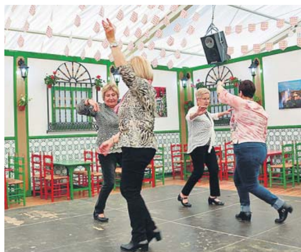
Un grup de dones ballant dins d'una caseta.

Parc del Fòrum. Fins al 5 de maig. Avui divendres i dissabte de 10 a 03.30 hores i el diumenge de 10 a 23 hores. Gratis. fecac.com .