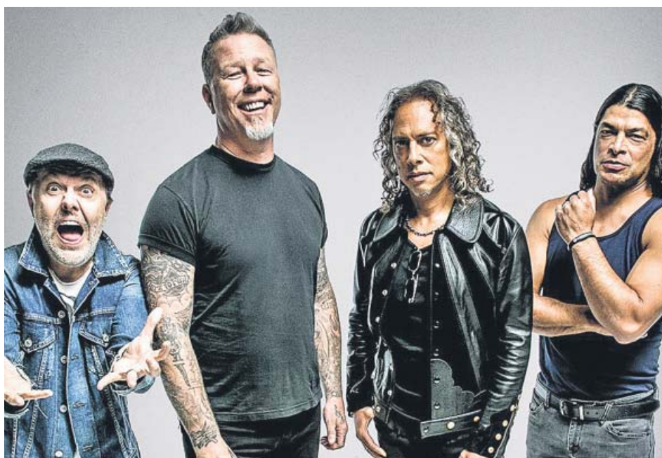
De izda a derecha: Lars Ulrich, James Hetfield, Kirk Hammett y Robert Trujillo.

Los inicios de este grupo se remontan a 1981, cuando un danés, fan de Iron Maiden, puso un anuncio en un periódico en el que buscaba músicos para formar una banda de metal. James Hetfield fue el primero en responder. Y le siguió Dave Mustaine (que fue sustituido por Kirk Hammett