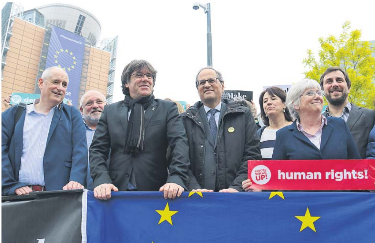
Carles Puigdemont y Quim Torra, ayer en Bruselas.