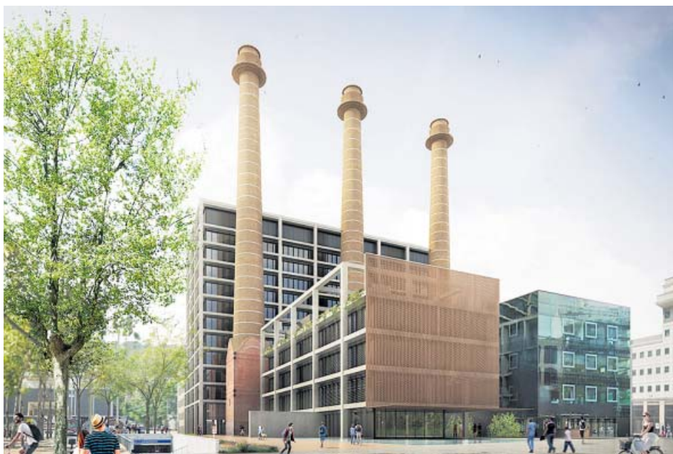
Una imagen virtual del aspecto que tendrá el edificio una vez remodelado. CONREN TRAMWAY

EL GOBIERNO municipal señala que estudia la demanda vecinal, de una «gran complejidad urbanística»