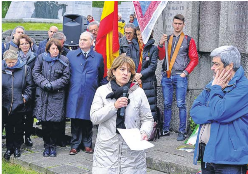
Delgado, ayer, durante un momento de su intervención en el campo de concentración.

La ministra de Justicia en funciones, Dolores Delgado, abandonó ayer un homenaje de la Generalitat a los presos españoles de Mauthausen (Austria) después de que se les comparara con los políticos en prisión preventiva por la consulta del 1-O. Delgado participó en varios homenajes en el antiguo campo de concentración nazi. Tras escuchar las palabras de la representante de la Generalitat, abandonó el lugar. Regresó después para la ofrenda floral. ●