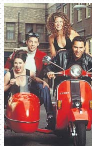
Los protagonistas de la serie Will & Grace.

Claro que si dichos secundarios son Jack (Sean Hayes) y Karen (Megan Mullally), eso es comprensible: en la cabeza del primero —uno de esos personajes que neutralizan los estereotipos ofensivos a base de hipérboles— solo hay espacio para el sexo, Cher y su ego; mientras que el petardeo alcoholizado y fornicatorio de la segunda pondría en aprietos hasta a las antiheroínas de Absolutamente fabulosas .