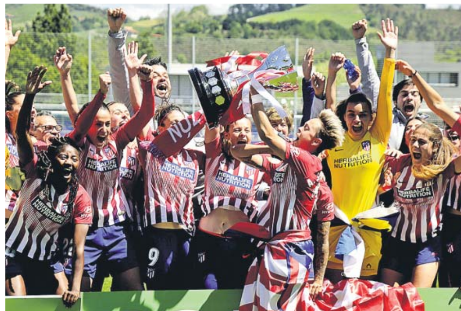
Las jugadoras del Atlético de Madrid celebran su victoria ante la Real y el título de Liga.

Por su parte, el Barcelona, menos efectivo que en otras ocasiones ante un batallador Granadilla que confirmó su gran temporada, cayó en La Palmera de San Isidro (1-0) con un tanto de Mari Jose en el minuto 54 de juego. El conjunto azulgrana dio la impresión de