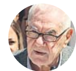
ERNEST MARAGALL Candidat d'ERC a l'alcaldia de Barcelona

«Espanya és monarquia, nosaltres, república. És centralisme, nosaltres territori organitzat i compartit. Espanya és forat negre de Madrid, nosaltres som Barcelona-ciutat-país»