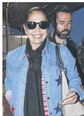
Isabel Pantoja, tan feliz rumbo a Honduras.

Porque Pantoja quiere que su retorno discográfico lleve escrita la palabra éxito incluso antes de que se produzca. Con esas intenciones aceptó la propuesta televisiva,