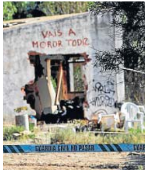
Casa donde vivía la familia, en Godella.

había ordenado Dios». Según su confesión a la Guardia Civil, publicada por el programa Espejo Público , explicó a los agentes que quitarles la vida a sus hijos «era la única forma de salvar sus almas y salvarme yo misma». La mujer asegura que Dios le «ordenó que practicara un ritual de purificación». Gombau tenía antecedentes por problemas mentales y desatención a los menores que habían alertado a los servicios sociales. ●