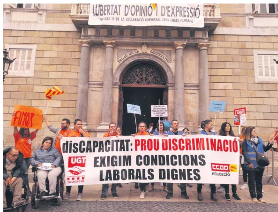
Treballadors de residències i centres especials a la plaça Sant Jaume.

Els sindicats CCOO i UGT van denunciar ahir amb una concentració a la plaça Sant Jaume de Barcelona irregularitat en l'aplicació del salari mínim interprofessional (SMI) als centres especials de treball, empreses que asseguren una feina remunerada a persones amb discapacitat. Segons van afirmar, es fan «trampes» com per exemple, assimilar els complements salarials o condicionar el sou de 900 a un augment de les hores de feina. ● M.L.L. / R.B.