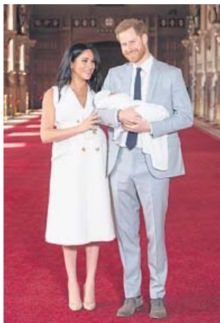
Los duques de Sussex y su bebé, en Windsor.

Los abogados americanos de la tenista no dan por perdida la batalla con el catalán, a pesar de que él asegure que está todo ganado. El último set sigue en juego. ●