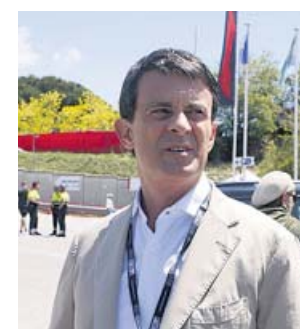
Valls asistió ayer al Circuito de Montmeló.

El ex primer ministro francés y candidato a la alcaldía de Barcelona, Manuel Valls, se desplazó ayer hasta el circuito de Barcelona-Cataluña en Montmeló, donde asistió al Grand Prix de Fórmula 1, para asegurar que «reforzará» esta equipación. Valls explicó que el circuito «genera casi 400 millones de euros al año y 10.000 puestos de trabajo» y apostó porque la capital catalana acoga grandes acontecimientos de-