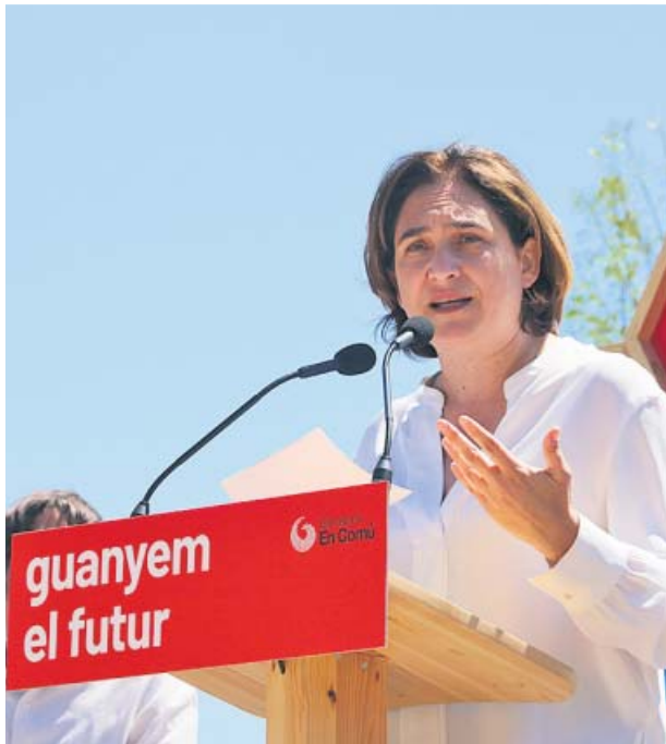
Ada Colau en el acto electoral de ayer en Glòries.

Model; en la calle Cristòbal de Moura; creando un parque en espacios que se generen en La Sagrera; en Trinitat; en Can Batlló y generando un nuevo parque en el litoral entre la Mar Bella y el Fòrum, entre otros espacios, que también incluyen solares vacíos, interiores de manzana, muros y terrados.