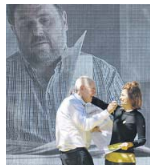
Junqueras, Maragall y Alamany en el acto de ayer.

El presidente de ERC y número 1 en las elecciones europeas, Oriol Junqueras, aseguró ayer que ganar las elecciones municipales a Barcelona es «imprescindible» para que el proyecto republicano sea «sólido» en Catalunya. A través de un vídeo grabado desde la prisión de Soto Real, Junqueras apostó por «consolidar» la victoria de los republicanos en las elecciones generales del 28-A con un «éxito» en Barcelona y que Ernest