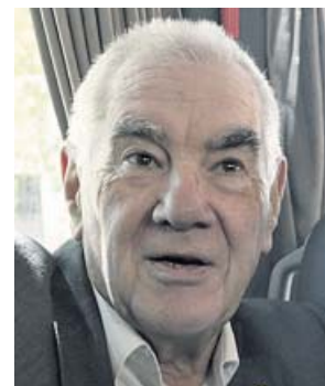
El candidat d'ERC, Ernest Maragall.

ERC Ernest Maragall va demanar ahir «una àmplia majoria» de vots republicans per aconseguir una clara victòria el 26-M, donat que els sondejos auguren un estret marge de vots amb la candidatura d'Ada Co-