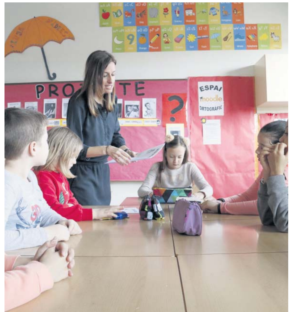
Alumnes amb la seva mestra atents a les explicacions que els hi dona.

De la mateixa manera, s'ha proposat un nou model d'FP dual per al proper curs acadèmic que, amb el disseny d'un currículum únic per cada cicle formatiu, permetrà una major flexibilitat organitzativa als centres; i s'ha signat el Pacte contra la Segregació, amb l'objectiu de crear un servei d'educació a Catalunya just i equitatiu i per lluitar contra la segregació escolar. ●