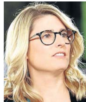
La número dos de JxCat, Elsa Artadi.

JUNTS PER CATALUNYA La número 2 de JxCat a les eleccions a l'Ajuntament de Barcelona, Elsa Artadi, va afirmar ahir que vol reduir la taxa de delinqüència de la ciutat als nivells del 2015,