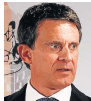
L'exprimer ministre francès i candidat, Manuel Valls.

Valls L'ex-primer ministre francès i alcaldeable per Barcelona, Manuel Valls, va proposar ahir reformes de vies importants com el Paral·lel, la Meridiana, la Via