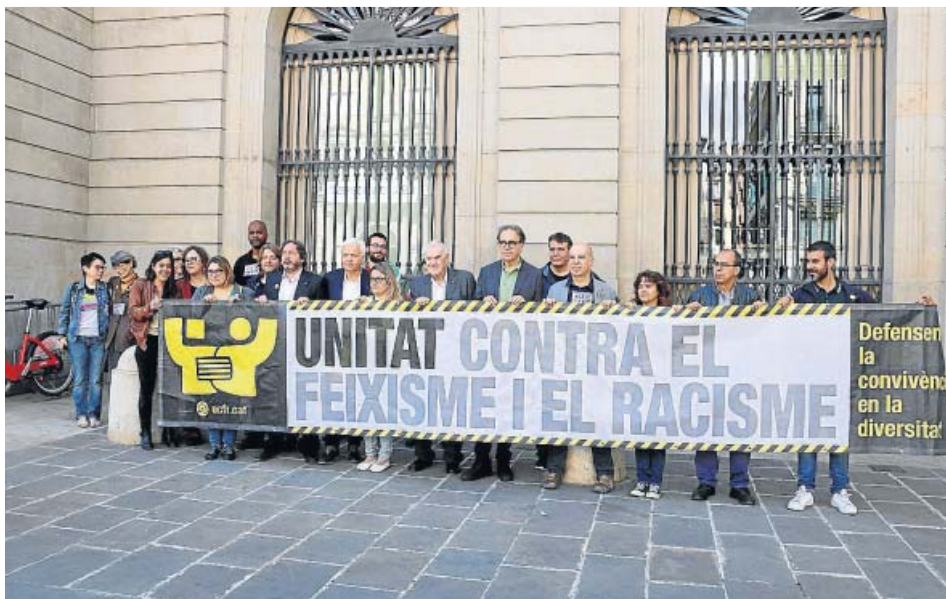
Els signataris del manifest Stop Vox, ahir, davant l'Ajuntament de Barcelona. MAR VILA / ACN