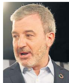
Jaume Collboni, l'alcaldeable pel PSC.

PSC El candidat del PSC a l'alcaldia de Barcelona, Jaume Collboni, va insistir ahir que Barcelona en Comú i ERC, amb els candidats Ada Colau i Ernest Maragall al capda-