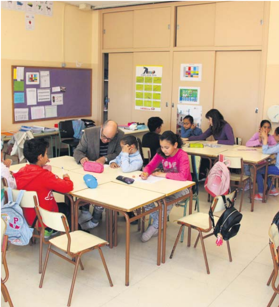
Imatge de dos professors ajudant als alumnes en les tasques educatives.