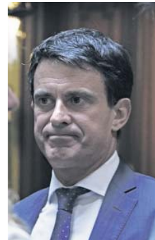
Manuel Valls, candidato a la alcaldía por BCN Canvi-Cs.

Por otro lado, hizo un llamamiento a los ciudadanos para que se movilicen y voten contra el independentismo en las elecciones municipales con el objetivo de «recuperar las instituciones». «No puede haber equidistancia entre los que respetan el Estado de Derecho y la Constitución y los que han roto