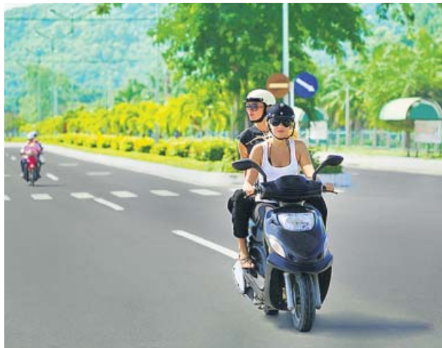
En verano los motoristas descuidan más su equipamiento.

Cuando comienzan a subir los termómetros, no es extraño ver a motoristas circulando con chanclas y pantalones cortos, algo a evitar. El problema es que estos automóviles carecen de carrocería, por lo que cuando se produce un accidente es el propio cuerpo del conductor —y del pasajero si lo hubiese— el que