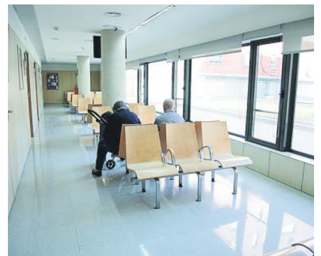
Pacients esperant per entrar a la consulta d'un CAP.

L'aposta del Departament de Salut per l'atenció primària d'orientació comunitària, a l'entorn de la qual vol estructurar el sistema públic de salut, es completa amb altres d'implementació immediata que milloren les condicions laborals dels professionals. Així, s'està potenciant la tasca de la professió infermera i del conjunt dels professionals dels equips, i s'han acordat millores salarials per als professionals de l'atenció primària concertada, d'urgències d'atenció primària i de salut sexual i reproductiva dels CAP. ●