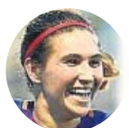
Mariona Caldentey ■ FC Barcelona ■ Centrocampista