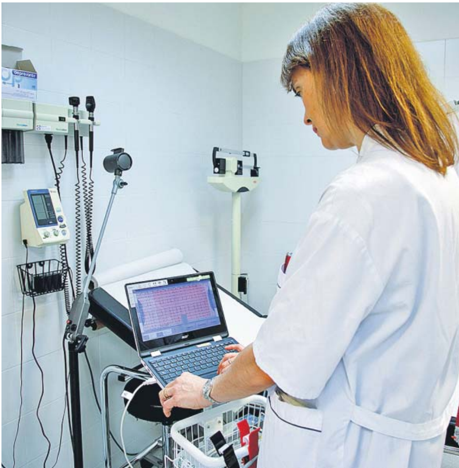
Imatge d'una professional de la sanitat en una de les consultes d'un CAP.