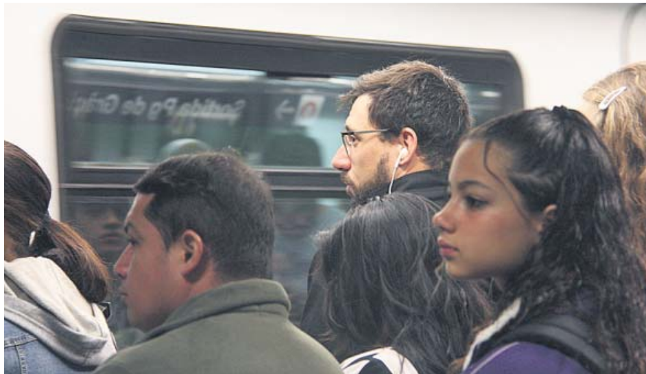
Gent esperant l'arribada del metro a l'andana de la L5 a Diagonal.