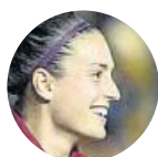
Alexia Putellas ■ FC Barcelona ■ Delanteras