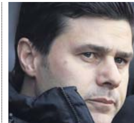
Mauricio Pochettino Entrenador del Tottenham (47 años)

El técnico español sabe dar a cada uno de sus equipos su impronta. Ahora, lucha por reverdecir viejos laureles con el Arsenal.