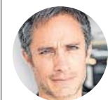
Gael García Bernal El Factory director, en Cannes

«¿Cómo podemos conciliar el día a día en un país como México, con tantos muertos, con tanta impunidad?»