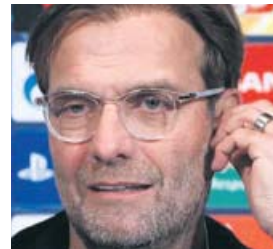
Jürgen Klopp Entrenador del Liverpool (51 años)

El alemán ha revolucionado al Liverpool hasta convertirlo en, posiblemente, el mejor equipo de Europa. Su personalidad le hace casi más popular que sus jugadores.