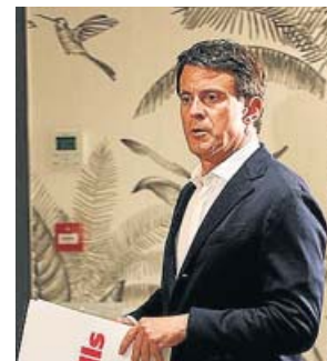
Manuel Valls va presentar el seu programa cultural.

Valls va apostar perquè la cultura sigui un «element essencial del posicionament» de la