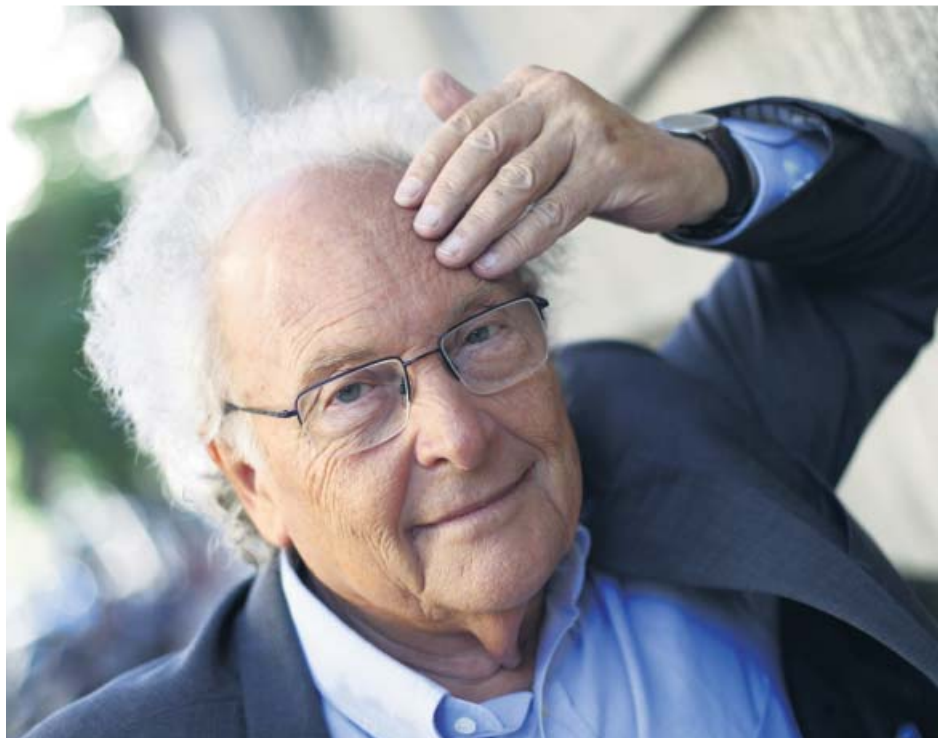
Eduard Punset, retratado durante una entrevista con 20minutos en 2013.

Nacido en 1936 en Barcelona, se formó en la Universidad de Londres y en la Complutense de Madrid en Ciencias Jurídicas. Tras la muerte de Franco, entró en política de la mano de Centristes de Catalunya y, en