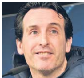
Unai Emery Entrenador del Arsenal (47 años)

El alemán ha revolucionado al Liverpool hasta convertirlo en, posiblemente, el mejor equipo de Europa. Su personalidad le hace casi más popular que sus jugadores.