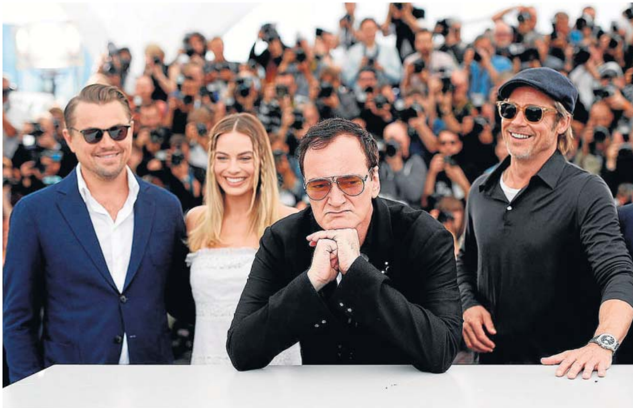
Leonardo DiCaprio, Margot Robbie, Quentin Tarantino y Brad Pitt, ayer ante la prensa en Cannes.

Aunque la situación entre el cantante y la actriz es menos temeraria, las aguas no bajan del todo tranquilas. Tal vez por eso se ha desentendido de todo lo que concierne a la venta de su casa. ●