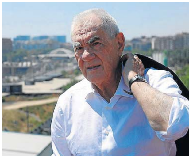
Maragall (ERC) ahir al terrat de la Nau Bostik.

En la mateixa línia, Maragall va proposar la número dos de JxCat reunir-se plegats a Bèlgica amb l'expresident de la Generalitat Carles Puigdemont. Maragall com alcalde i Artadi com a regidora. Així va respondre a les crítiques d'Artadi que l'acusa «d'aïllar Puigdemont a Brussel·les». ●