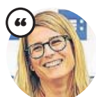
ELSA ARTADI Número dos de JxCat

«Estem a favor de col·laborar amb ERC des del 2012, no entendríem cap altra aliança o estratègia»