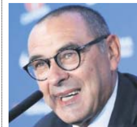
Maurizio Sarri Entrenador del Chelsea (60 años)

El argentino rechazó la llamada del Madrid y siguió trabajando en el Tottenham. A la chita callando, lo ha convertido en un equipo sólido y muy difícil de batir.