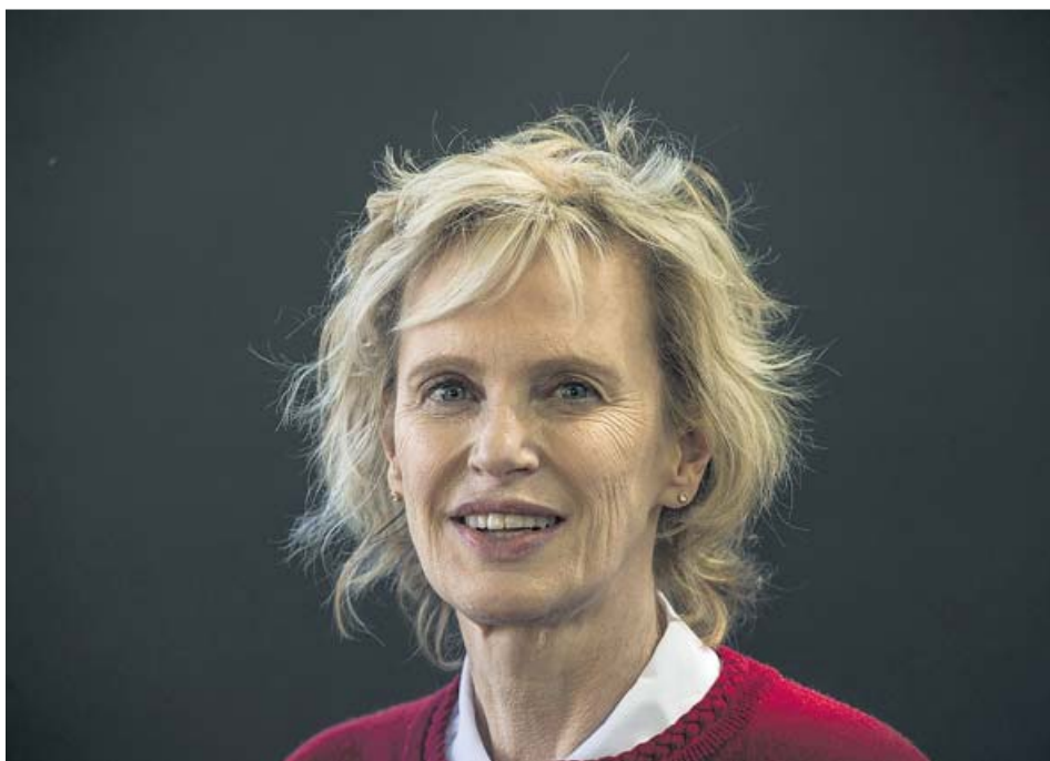
La escritora Siri Hustvedt, en una imagen tomada en 2017.