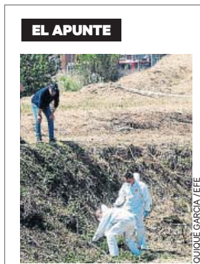
Fábrica de la Seda

El presunto autor del crimen, en prisión provisional desde el 9 de mayo, solía frecuentar el paraje donde se halló el cuerpo: «Le conocía de haberle visto pasear al perro por la zona donde justo se ha encontrado el cadáver, pero nadie sospechaba nada de él». En ese descampado es «donde pasea casi todo el mundo a sus perros», pero el punto en el que ha sido hallado el cuerpo está delimitado por una valla, pues antiguamente era la zona por la que se entraba a la Fábrica de la Seda. «El cadáver estaba en la parte donde antes se encontraba la fábrica. Los que