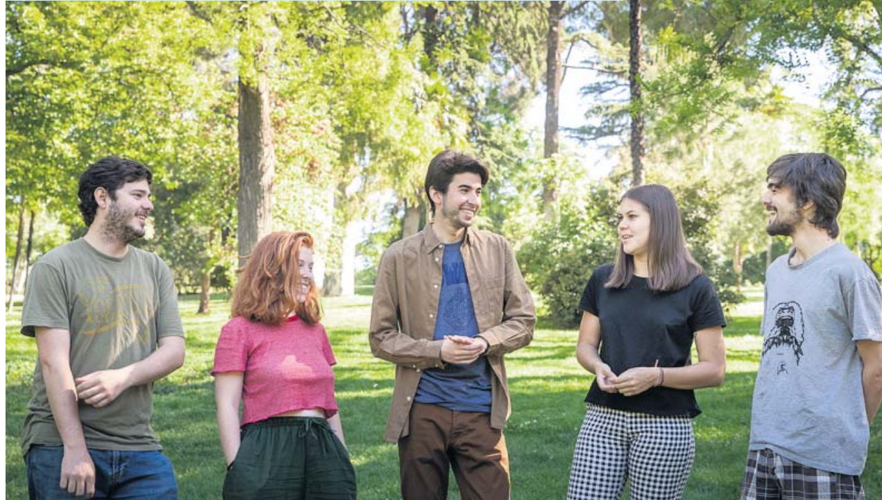
Miembros del movimiento estudiantil Fridays For Future en el parque del Retiro de Madrid. ELENA BUENAVISTA

El movimiento estudiantil Fridays For Future celebra mañana su duodécima sentada frente al Congreso. Antes, se manifestarán en Sol durante la huelga global por el clima