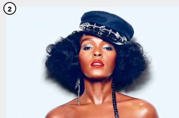
Janelle Monáe (Hoy; Escenario Pull&Bear; 21.35 horas)

El pop, el flamenco y las nuevas corrientes de la música latina ya no son lo mismo desde la irrupción de este terremoto musical. La de Sant Esteve Sesrovires experimenta vocal y estéticamente y ha irrumpido en la escena musical planetaria con el disco El Mal Querer (2018), un diccionario de los diferentes episodios de una relación amorosa.