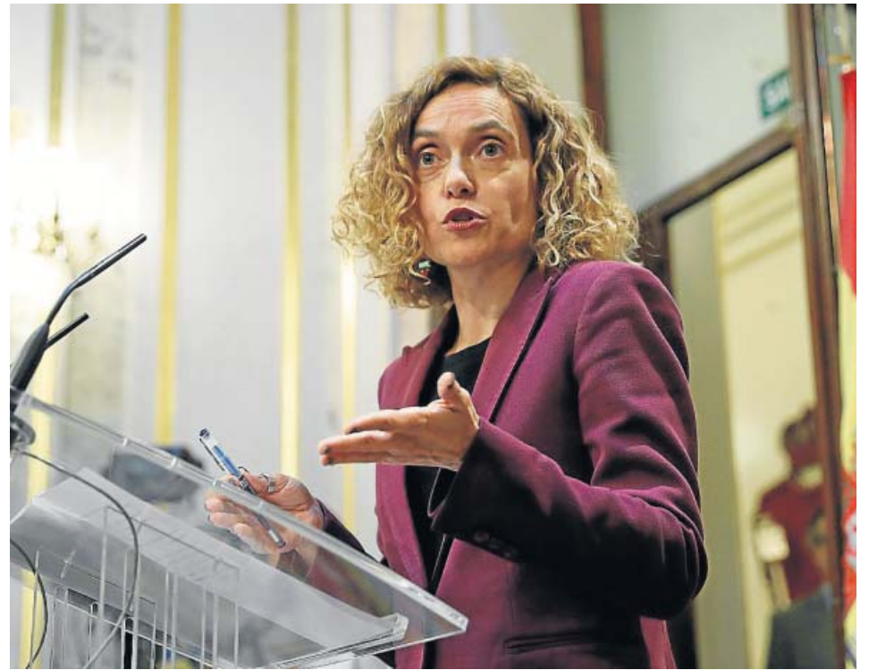
La presidenta del Congreso, Meritxell Batet, tras la reunión de la Mesa.

ERC reformuló las características de su grupo en el Congreso mientras espera solventar en el Senado la falta de senadores por el que esta semana quedó en suspenso el grupo que quiere formar allí junto a Bildu. La suspensión de Raül Romeva descuadró las cuentas y la Cámara Alta dio a ERC y Bildu un plazo de cinco días para que sol-