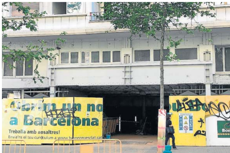
Fachada de los antiguos cines Urgell cuya cubierta es de uralita.

El espacio que ocupó la sala de proyección se habilitará, en su subsuelo, para acoger un supermercado Bonpreu. La isla interior que comprende las calles Comte d'Urgell, Florida Blanca, Comte Borrell y Sepúlveda se ganará como un nuevo patio interior del distrito de