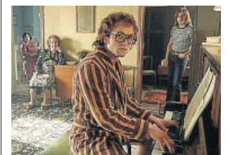
Taron Egerton se pone las gafas de Elton John.

Me he follado todo lo que se mueve y me he metido todas las drogas posibles. Y además, mamá —le dice el Elton John de Taron Egerton a su apática madre (Bryce Dallas Howard)—, lo he disfrutado». Una frase que cierra de un portazo las comparaciones con la reciente Bohemian Rhapsody , dos películas que comparten director, Dexter Fletcher, e intención de llegar a los corazones de los fans. Pero si con Freddie Mercury pasaron de puntillas por las dro-