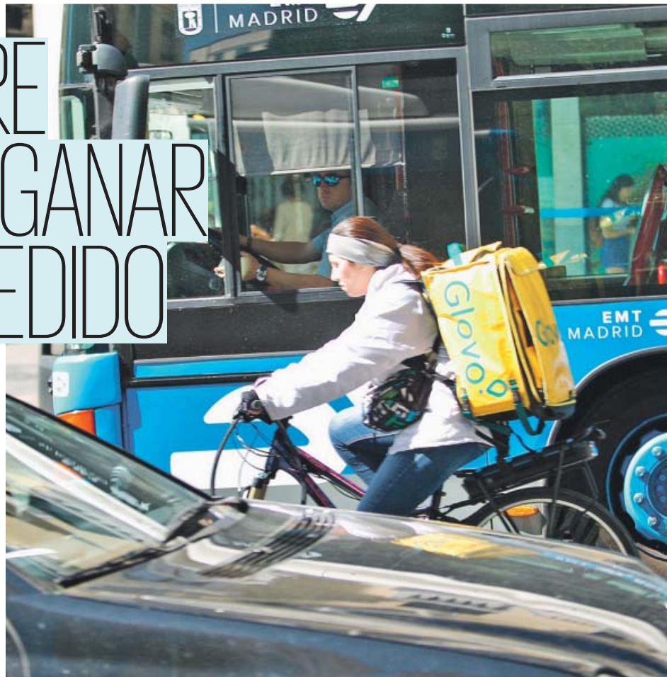
Una rider circula entre el tráfico de Madrid para entregar su pedido.