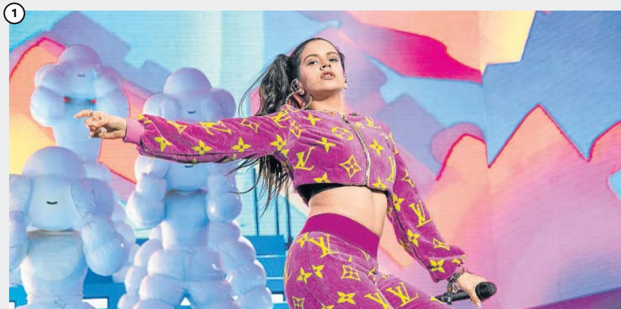
Rosalía (Sábado; Escenario Pull & Bear; 21.55 horas)

El pop, el flamenco y las nuevas corrientes de la música latina ya no son lo mismo desde la irrupción de este terremoto musical. La de Sant Esteve Sesrovires experimenta vocal y estéticamente y ha irrumpido en la escena musical planetaria con el disco El Mal Querer (2018), un diccionario de los diferentes episodios de una relación amorosa.