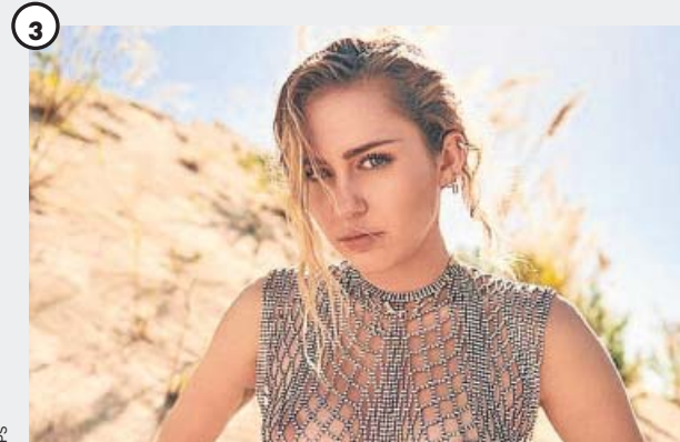
Miley Cyrus (Hoy; Escenario Seat; 23.10 horas)

Alter ego de Cindi Mayweather, la de Atlanta presenta nuevo disco en el Fòrum, Dirty Computer (2018). Monáe compatibiliza la música con la actuación ( Moonlight ).