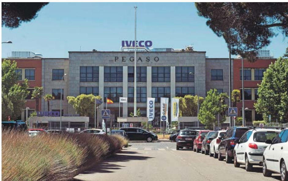
Sede de la empresa Iveco, en San Fernando de Henares (Madrid).