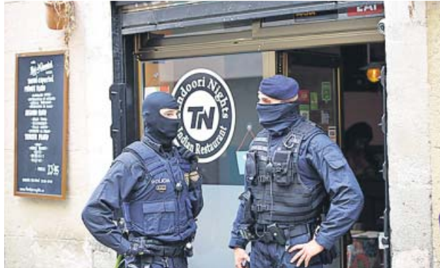
Macrooperatiu policial contra narcopisos del Raval.

El barri del Raval va estar ahir a la tarda literalment blindat per un miler d'agents dels Mossos d'Esquadra, la Policia Nacional i la Guàrdia Urbana que van actuar conjuntament en un dispositiu a gran escala contra la venda de drogues. Helicòpters i sirenes avisaven al voltant de les 16.30 hores de la tarda d'ahir del desplegament d'un operatiu a gran escala amb sols un precedent recent a Ciutat Vella l'octubre passat. Els agents van escorco-