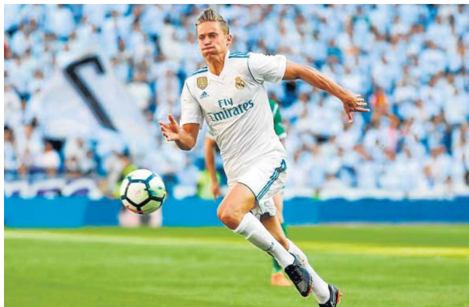
Marcos Llorente, con el Real Madrid.

Tras llegar a la presidencia en pleno ciclo triunfal de la Quinta del Buitre, Jesús Gil se prometió arrancar a los blancos a alguna de sus estrellas, aunque tan sólo pudo hacerse en 1991 con el delantero Sebastián Losada,