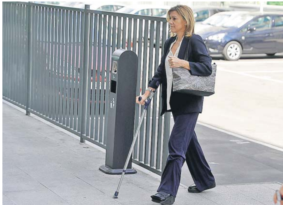
La exsecretaria general del PP, María Dolores de Cospedal, acude a declarar en muletas.

El exalcalde de Londres Boris Johnson y el ministro británico de Exteriores, Jeremy Hunt, se disputarán el liderazgo del Partido Conservador y la jefatura del Gobierno del Reino Unido.