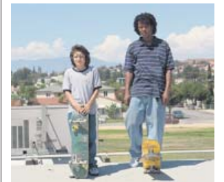
Joya de la cultura skater y hip hop de los 90. DIAMOND FILMS

En esta carta de amor a la cultura skater , el hip hop y una callejera Los Ángeles, Hill tira de su experiencia y de su admiración por esa escena en la que creció. Dibuja un re-