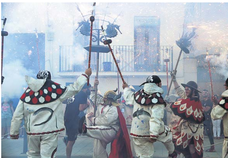
Una colla de diables durant una revetlla de Sant Joan.