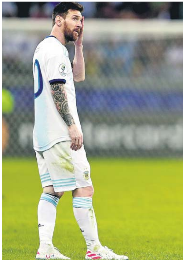
Messi, ayer durante el partido.

Scaloni lo rodeó de socios diferentes. Por delante, en lugar