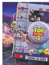
2019. Animación. Director Josh Cooley

El mérito de Toy Story 4 parece mayor si uno recuerda que, justo tras el despido de John Lasseter por acoso sexual, a la película le toca la papeleta de presentar al pri-