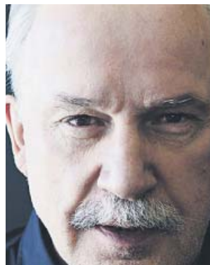
Giorgio Moroder, el pare de la música disco. FESTIVAL DE PEDRALBES

L'any 1997 ambdós van guanyar un premi Grammy a la millor gravació dance pel tema Carry On . Recentment, Moroder va participar al disc de tribut a Summer Love To