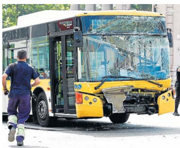
Imatge d' un dels autobusos afectats en l'accident.