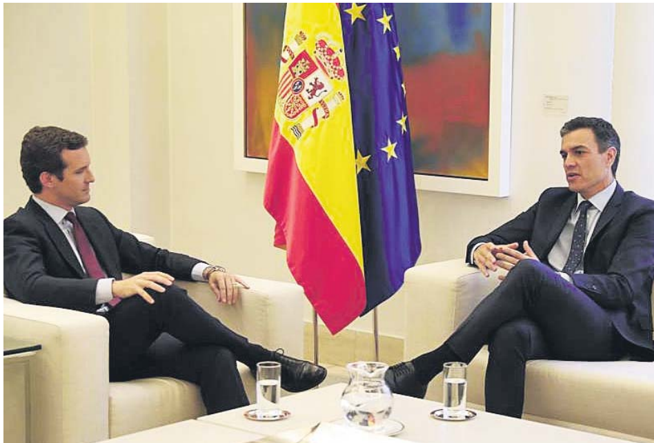
Sánchez y Casado, en una reunión en Moncloa justo después del 28-A.