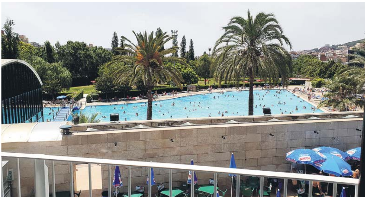
La piscina descoberta del CEM Can Dragó, en la calle Rosselló i Porcell.