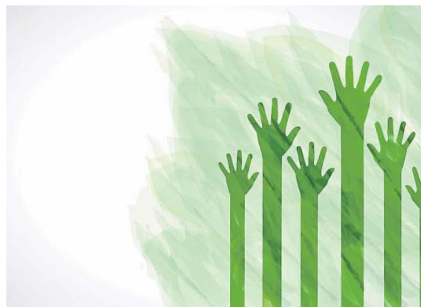
BBVA afronta nous reptes en finançament responsable i drets humans, entre d'altres. BBVA

Este mercado también genera intercambios con ferias especializadas como el salón Gamelab, el Congreso Internacional de Videojuegos y Ocio Interactivo, que comienza mañana mismo en L'Hospitalet. ●