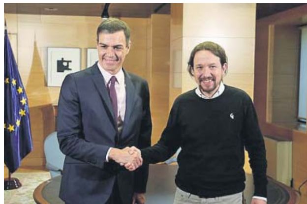
Sánchez e Iglesias en su última reunión pública.

SÁNCHEZ advierte de que la investidura será en julio aun sin acuerdo y niega un gobierno de coalición IGLESIAS vuelve a exigir ministros a Sánchez y someterá el posible acuerdo a las bases de su partido