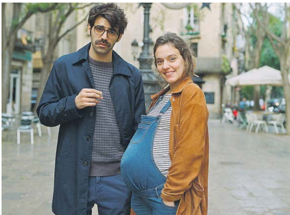
Fotograma de la premiada Los días que vendrán , de Carlos Marqués-Marcet.

El cine, además de ofrecer espectáculo y evasión, también ha buscado retratar la realidad de la manera más veraz posible