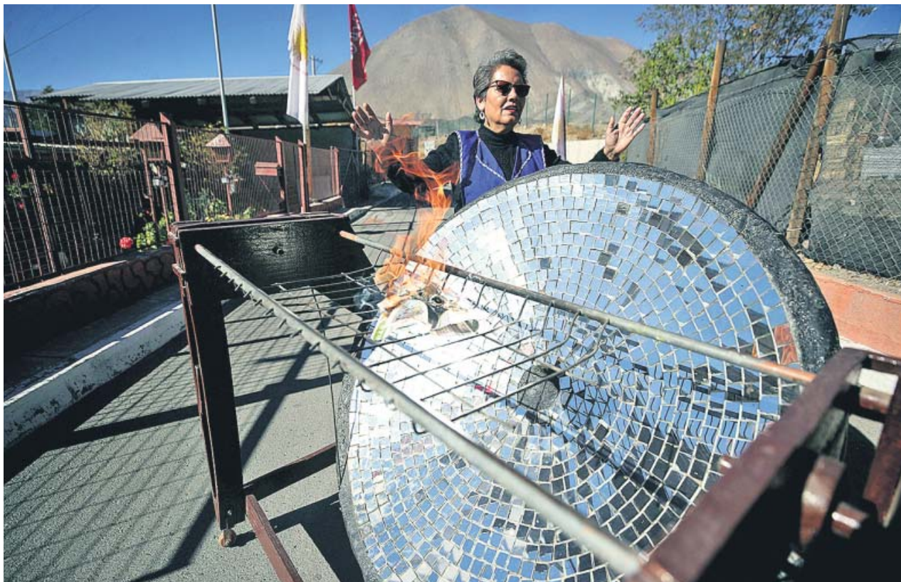
Una mujer prepara una parrilla solar para cocinar en la localidad chilena de Villaseca.

Para prevenir los efectos adversos del calor, especialmente en los más vulnerables —niños, mayores y enfermos crónicos—, la Cruz Roja propone una serie de medidas. Se recomienda beber líquidos aunque no se tenga sed, utilizar ropa ligera y con colores claros o evitar las actividades físicas en las horas centrales del día siempre que sea posible. Para proteger a los animales de compañía, la Guardia Civil recomienda comprobar si el asfalto no está demasiado caliente antes de pasearlos. ●