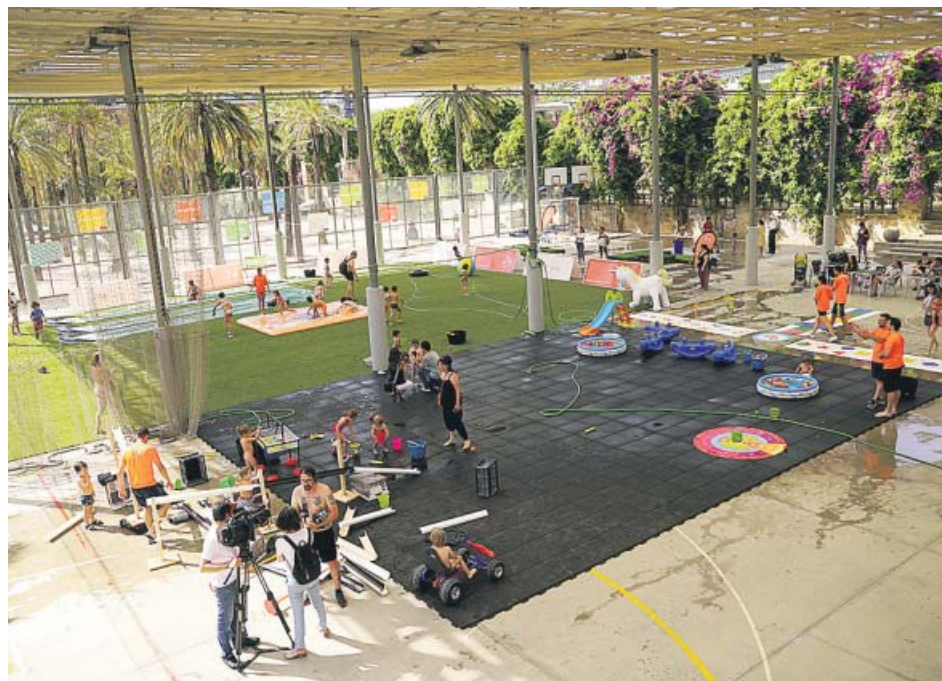
L'espai de jocs aquàtics està situat a les pistes poliesportives del parc Joan Miró.

La Guàrdia Urbana de Barcelona ha detingut una menor per haver llançat presumptament una noia a la via del metro a l'estació Urquinaona durant la revetlla de Sant Joan.