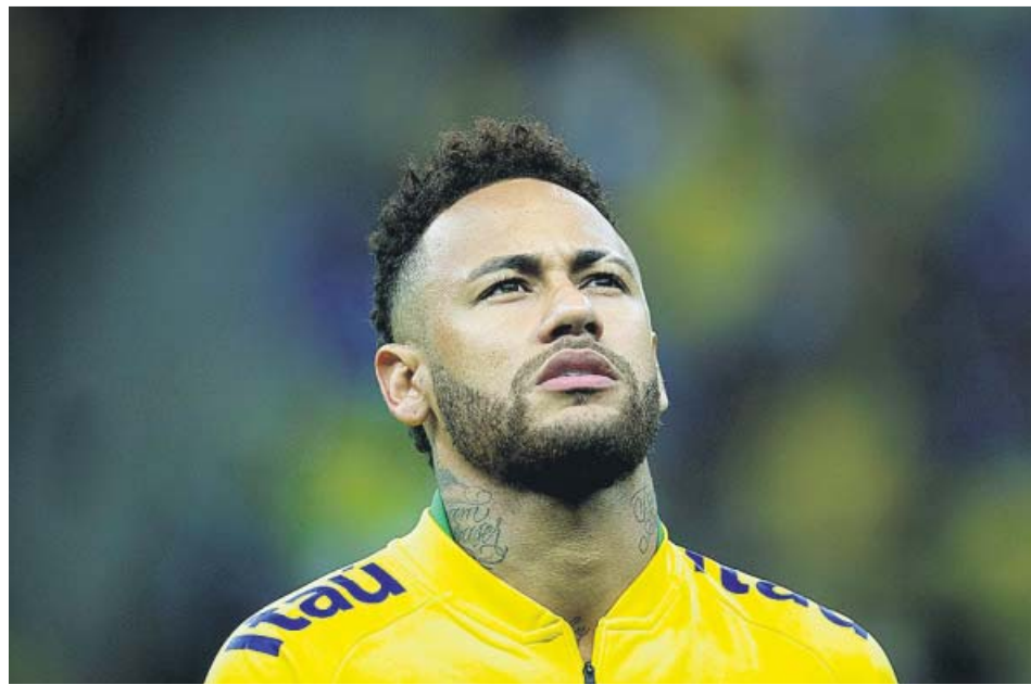
Neymar, en un partido con Brasil antes de lesionarse.