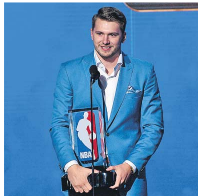
Luka Dončić, con el premio a mejor rookie del año.