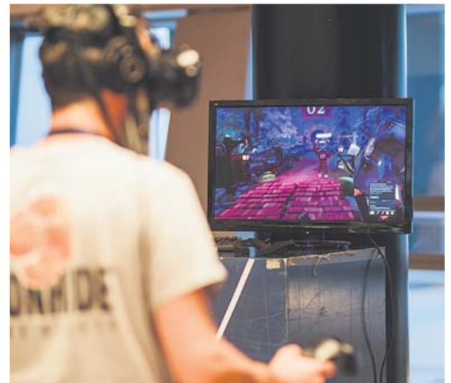
Un asistente a Gamelab prueba un juego de realidad virtual.

Todo este trabajo de visibilización hace que los videojuegos se despeguen cada vez más de la concepción de juguete que