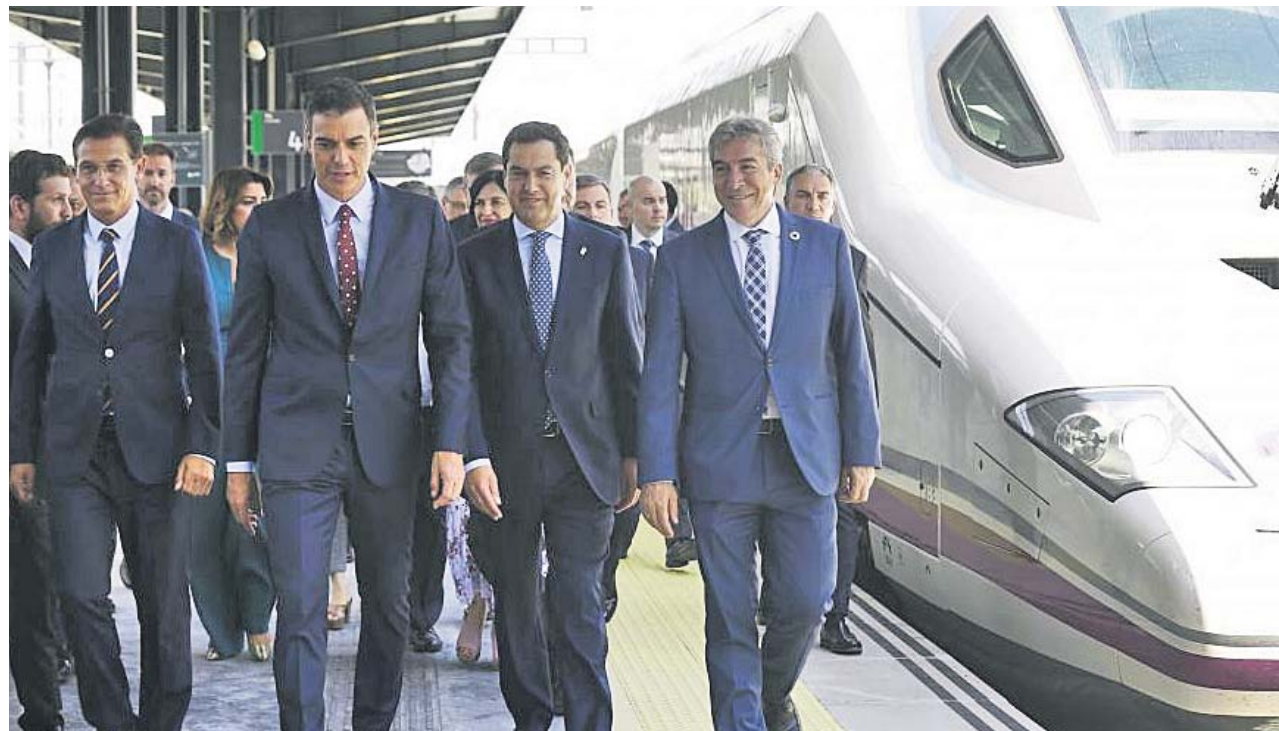
El presidente del Gobierno en funciones y el presidente de la Junta junto a otras autoridades en Granada.