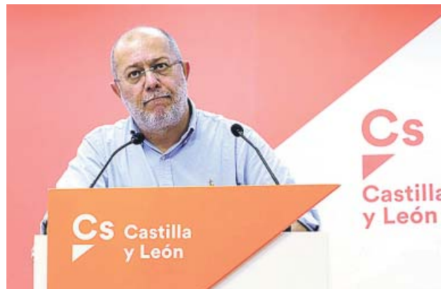
Francisco Igea, ayer durante una rueda de prensa.

Sin embargo, lamentó que Ciudadanos haya incurrido en debates sobre su propia existencia y haya «dejado de poner encima de la mesa propuestas concretas» en materia de políticas públicas, que es en lo que, en su opinión, debe centrar ahora sus esfuerzos para hablar de presupuestos y de financiación autonómica, que ve como «momentos culminantes», más allá de la investidura.