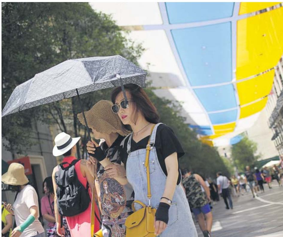
Dos turistas pasean por Madrid, en alerta naranja por las altas temperaturas. JORGE PARÍS