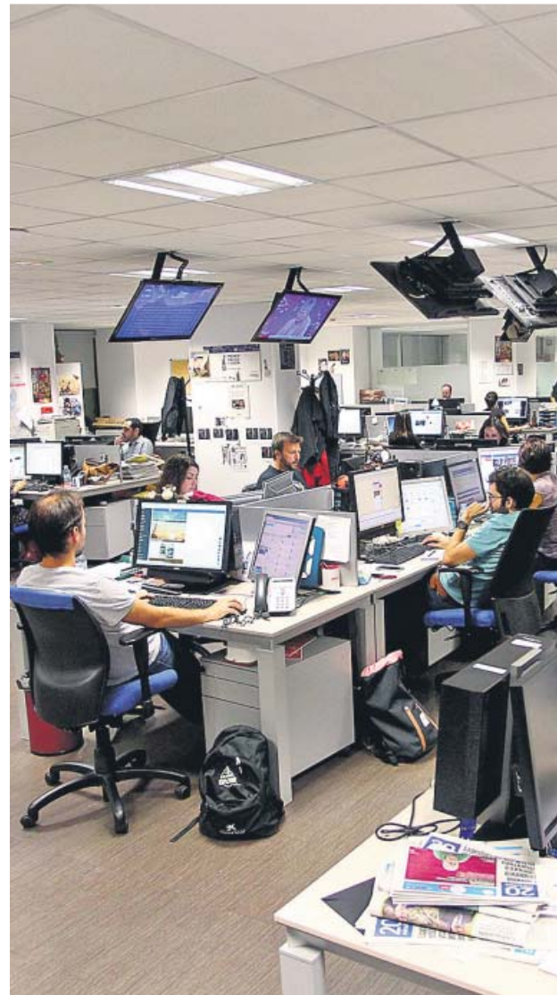
Redacción de 20minutos.