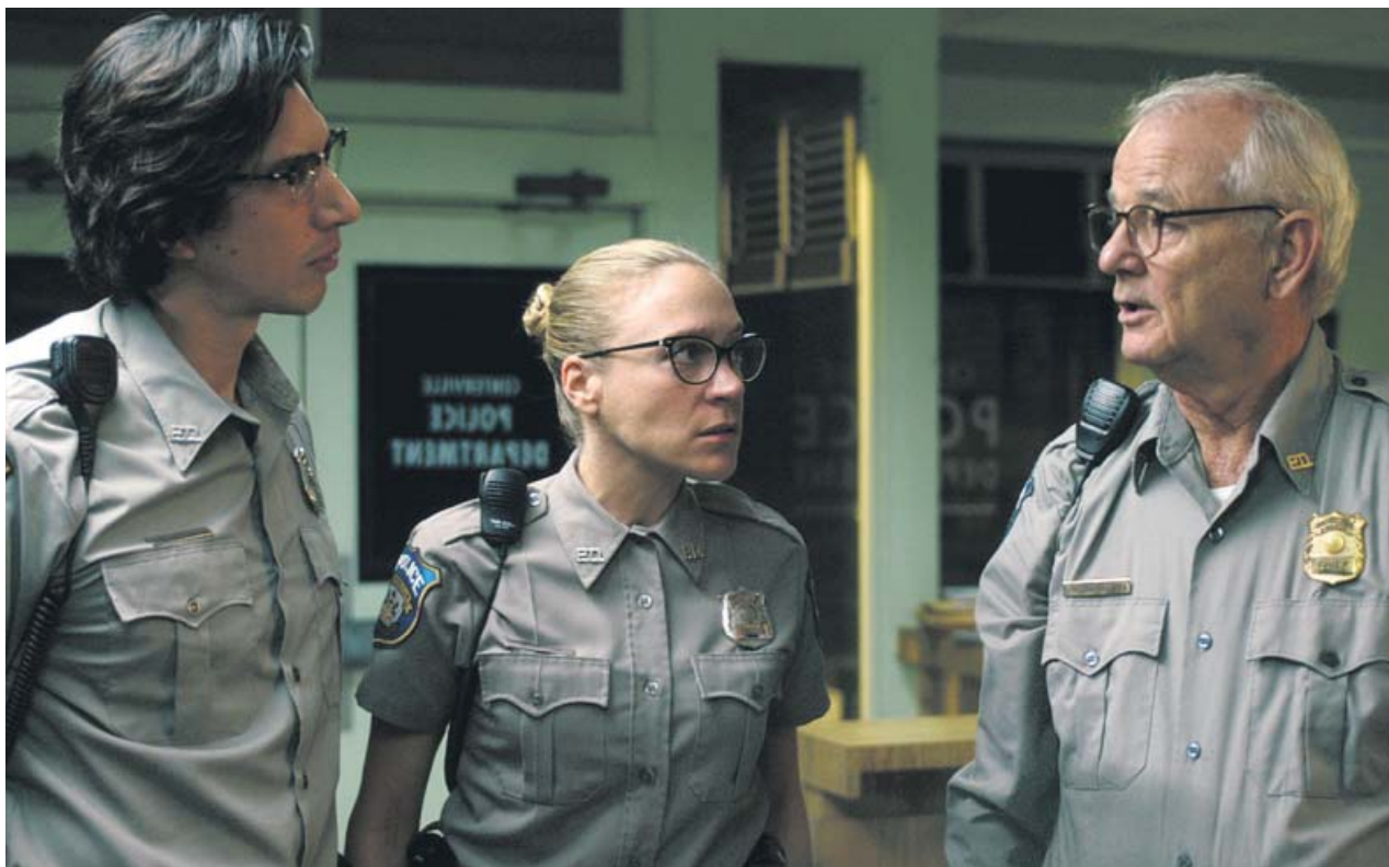
Adam Driver, Chloë Sevigny y Bill Murray en la zombie walk más cinéfila.