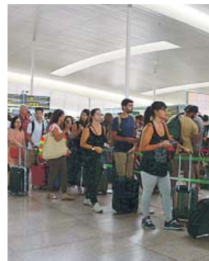
Cues de passatgers a la T1 durant la vaga del 2017.

El comitè d'empresa de la concessionària del servei de controls de seguretat a l'aeroport del Prat, Trablisa, ha convocat aturades parcials d'una hora i mitja de durada per dia a partir del 12 de juliol -tots els divendres, diumenges i dilluns- per obligar a fer complir els punts acordats al laude amb què es va resoldre el conflicte laboral del 2017 que va provocar llargues cues de passatgers a finals de juliol, inici i final de les vacances d'estiu per a molts viatgers, i