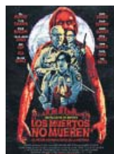
2019. Director Jim Jarmusch Reparto Bill Murray, Adam Driver, Tilda Swinton

Verles a todos pasándose lo bien —especialmente a Tilda con acento incierto y catana en mano— ante un apocalipsis zombi de sangre controlada es más que suficiente a ratos para disfrutar de la película. También se agradece que, a pesar de estos no muertos materialistas, nos deje una esperanza de edad adolescente: saldremos de esta, como pedía Mindy, porque el mundo es perfecto si sabemos apreciar los detalles, como pone en boca de otro gran amigo, RZA. ●