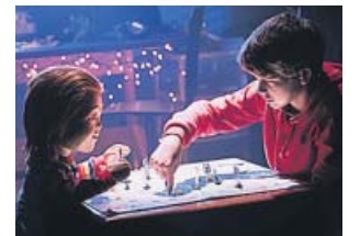
El muñeco más terrorífico está de vuelta. VÉRTIGO

El resultado es una comedia de terror, divertida y entrete-