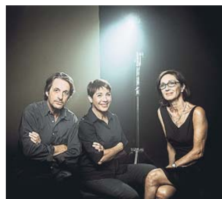
'Amor Mundi', 'Casa de Nines' i 'Nenes i nens', en el sentit de les agulles del rellotge.

del dramaturg contemporani britànic Dennis Kelly. Una productora de documentals mare d'un nen i d'una nena protagonitza un monòleg en el qual explica històries de la seva adolescència i joventut viatgera. Ens relata el dia en què va conèixer el seu marit, els èxits professionals de tots