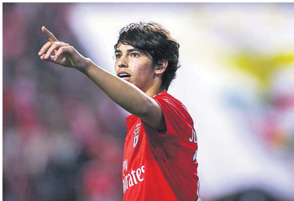
Joao Félix, en un partido con el Benfica.

Los 120 millones de euros que cuesta la libertad del jugador podrían haber supuesto un freno a su salida, pero la locura del mercado está haciendo que haya un club dispuesto a pagar incluso un poco más: 126 'kilos' desembolsará el Atlético de Madrid por el luso, un poco más a cambio de poder pagarlo a plazos. El Benfica ya ha hecho oficial la oferta, y ya solo es cuestión de tiempo, y no demasiado, que se haga oficial el fichaje.