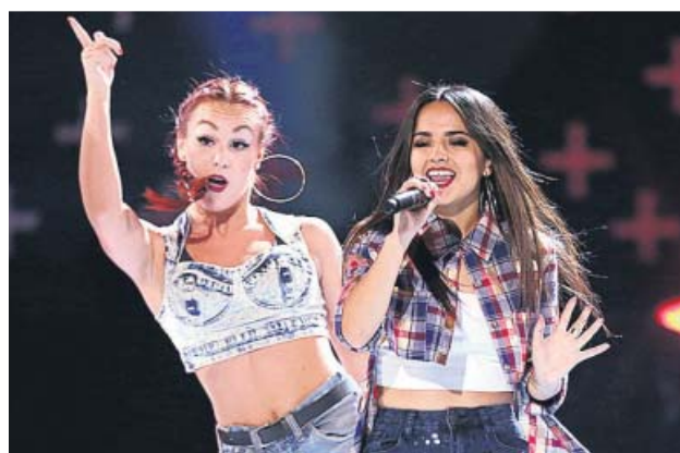
Becky G, a la dreta, en una actuació.

Música i solidaritat es donen de la mà avui al Poble Espanyol a la segona edició del Share Festival, amb una marató d'actuacions musicals dels principals exponents de les músiques urbanes i el pop-rock per a joves. El cartell l'encapçala l'artista Becky G, una de les estrelles de reggaeton. Li seguirà el cantant madrileny C. Tangana, un dels intèrprets de rap amb més seguidors, i Lola Índigo, que l'estiu passat va aconseguir l'èxit amb el tema Ya no quiero ná i que al Poble Espanyol presentarà en directe el seu primer