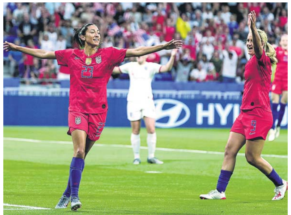
Las jugadoras de Estados Unidos celebran uno de sus goles.

El entorno del brasileño sigue trabajando en su regreso. El asesor del club azulgrana en Brasil, André Cury, ha sido el último en confirmar el deseo del jugador, al participar en una encuesta de 'Esporte Interactivo' titulada «¿A qué destino os gustaría que fuese Neymar?». Su respuesta fue rotunda: «Su casa es Barcelona». Además, Rakitic fue cazado ayer en un avión a París. ¿Para negociar su fichaje por el PSG? ●