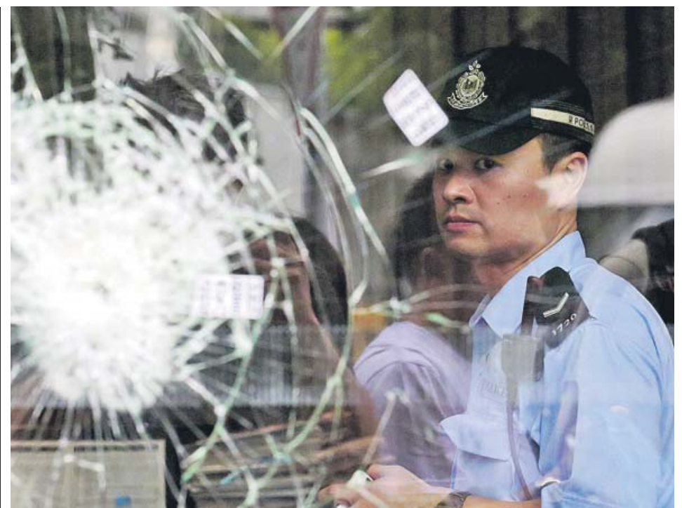
Un agente frente a un cristal roto durante las protestas en el Parlamento de Hong Kong.

Teléfono gratuito de atención a las víctimas de violencia machista